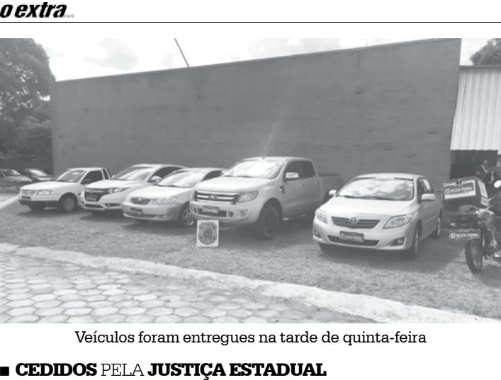
Veículos foram entregues na tarde de quinta-feira