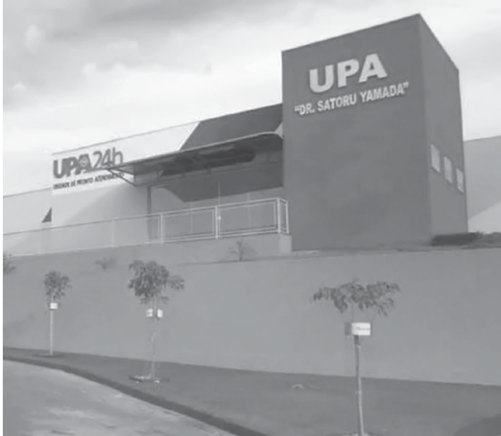
Vistorias promovidas pela Procuradoria também constataram que a prestação do serviço à população está comprometida

As vistorias promovidas pela Procuradoria também