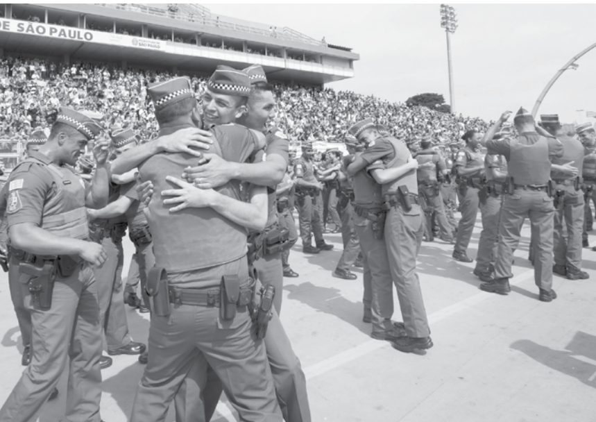
Objetivo é programar a reposição do efetivo por meio de um planejamento dos próximos anos

sivo. A remuneração inicial é de R$ 3.143,70, já com o adicional de insalubridade (R$ 691,64). SOBRE O CURSO DE FORMAÇÃO A formação do soldado no Curso Superior de Técnico de Polícia Ostensiva e Preservação da Ordem Pública, na Escola Superior de Soldados (ESSd), tem um ano de duração com mais de 1.500 horas de aulas. São 49 disciplinas dos módulos básico e específico, entre elas Direitos Humanos, Criminalística, Tiro Defensivo pela Preservação da Vida, Defesa Pessoal, Inteligência