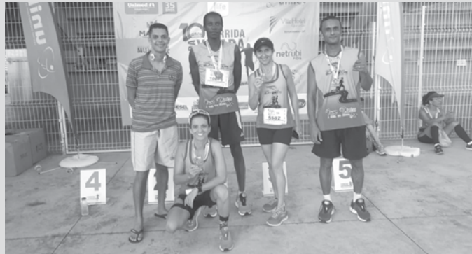
Na Corrida da Virada - Edição Carnaval, que aconteceu em Votuporanga, a equipe foi representada por seis atletas