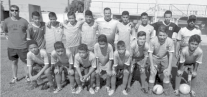
Jogadores que integram a equipe sub 14 de Ouroeste