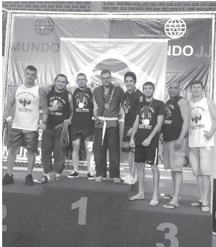
Ao todo 7 atletas que representaram Fernandópolis subiram ao pódio