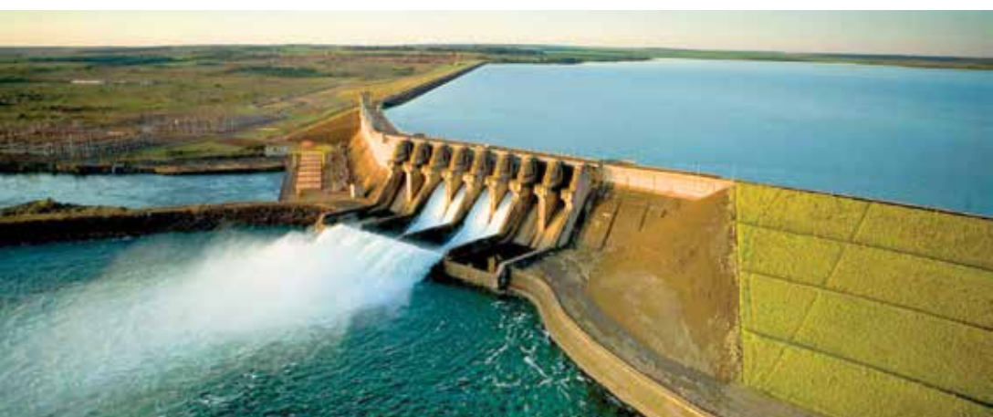
Comportas da Usina Hidrelétrica de Água Vermelha: autorizado novos investimentos

Segundo apurou a reportagem, a Prefeitura já foi notificada pelo TCE e na edição do Diário Oficial Eletrônico de quinta-feira, 28, publicou o aviso de suspensão do pregão até decisão da Corte.