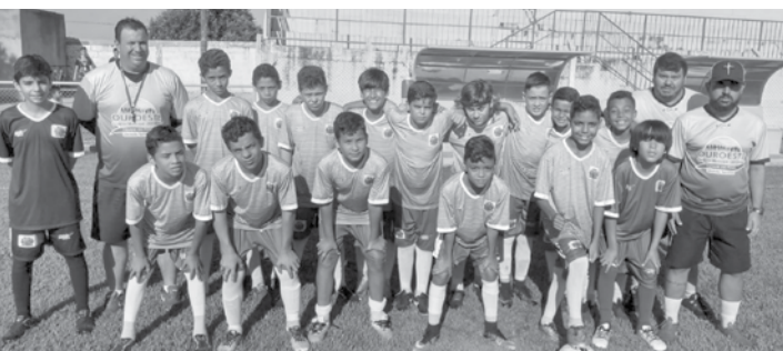
Jogadores que integram a equipe sub 12 de Ouroeste