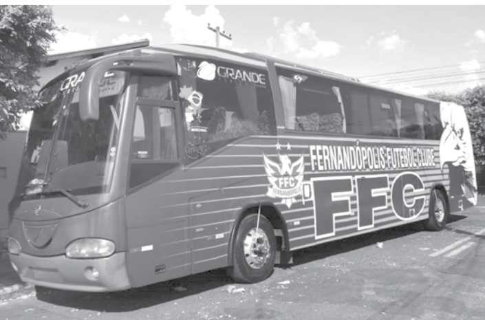
Ônibus levará os jogadores para as partidas fora de casa

→ WALDINEY MATOS contato@oextra.net Nesta sexta-feira, 29, a diretoria do Fernandópolis Futebol Clube (Fefecê) divulgou em sua página oficial o ônibus que será usado pela equipe nos jogos fora de casa, durante a disputa do Campeonato Paulista da Quarta Divisão.