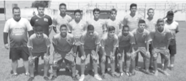
Jogadores que integram a equipe sub 16 de Ouroeste