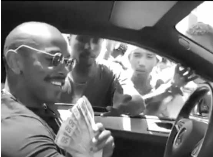
Nego do Borel distribui notas de R$ 50 para vendedores de balas no sinal

Ajudaria mais com um prato de comida”, disse outro. “Você deveria ter vergonha aparecendo assim desse jeito”, opinou um seguidor. “Legal brincar com a miséria dos outros para ganhar likes”, comentou uma seguidora.