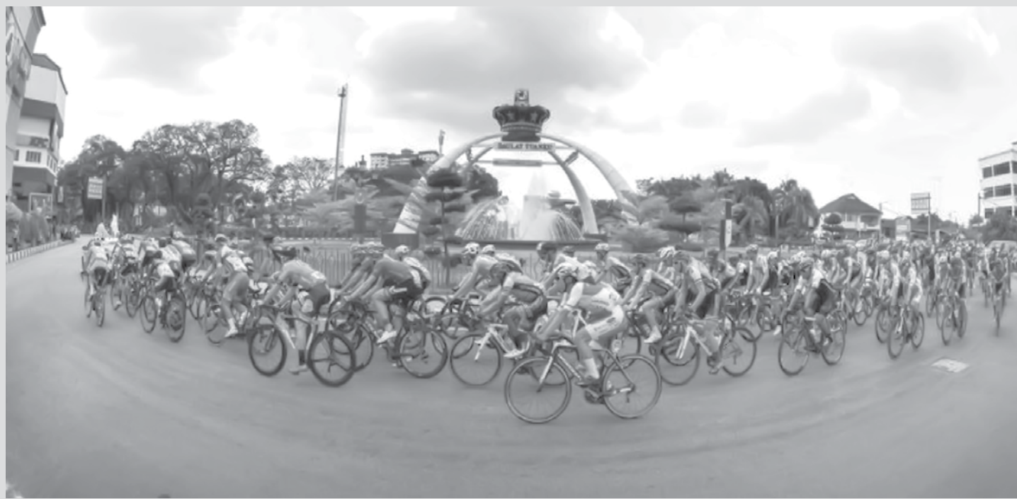
Ciclistas passam por um monumento em Muar durante a terceira etapa da corrida de ciclismo Le Tour de Langkawi, de Muar a Putrajaya, na Malásia