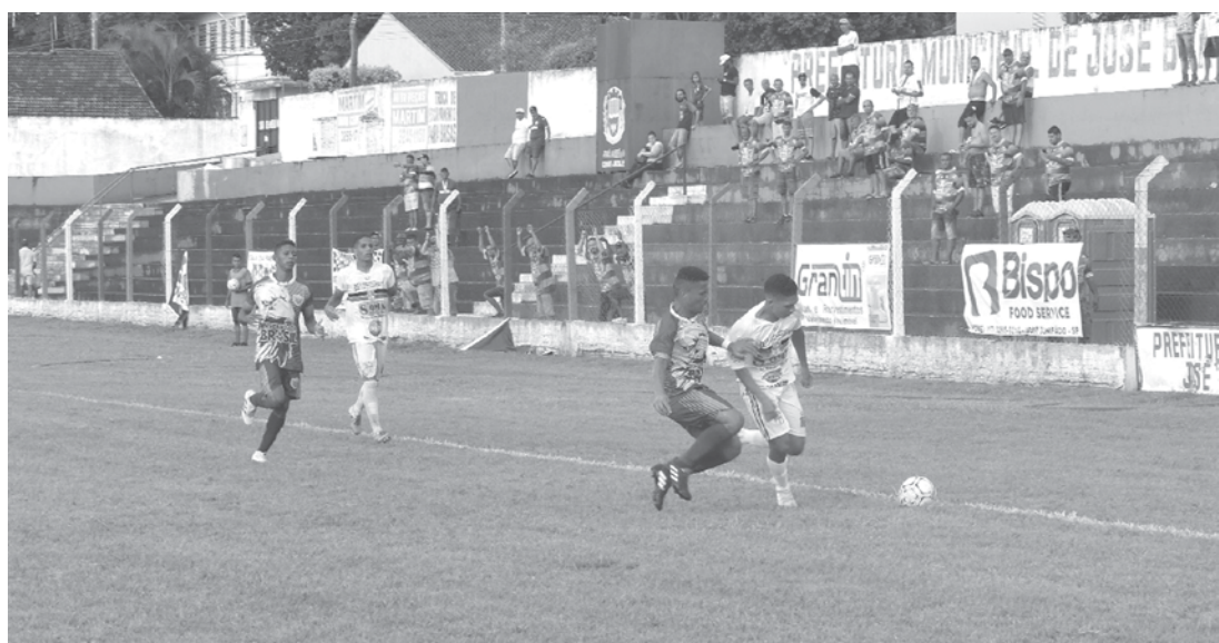
Águia estreou com a "asa" direita no Paulista da Quarta Divisão