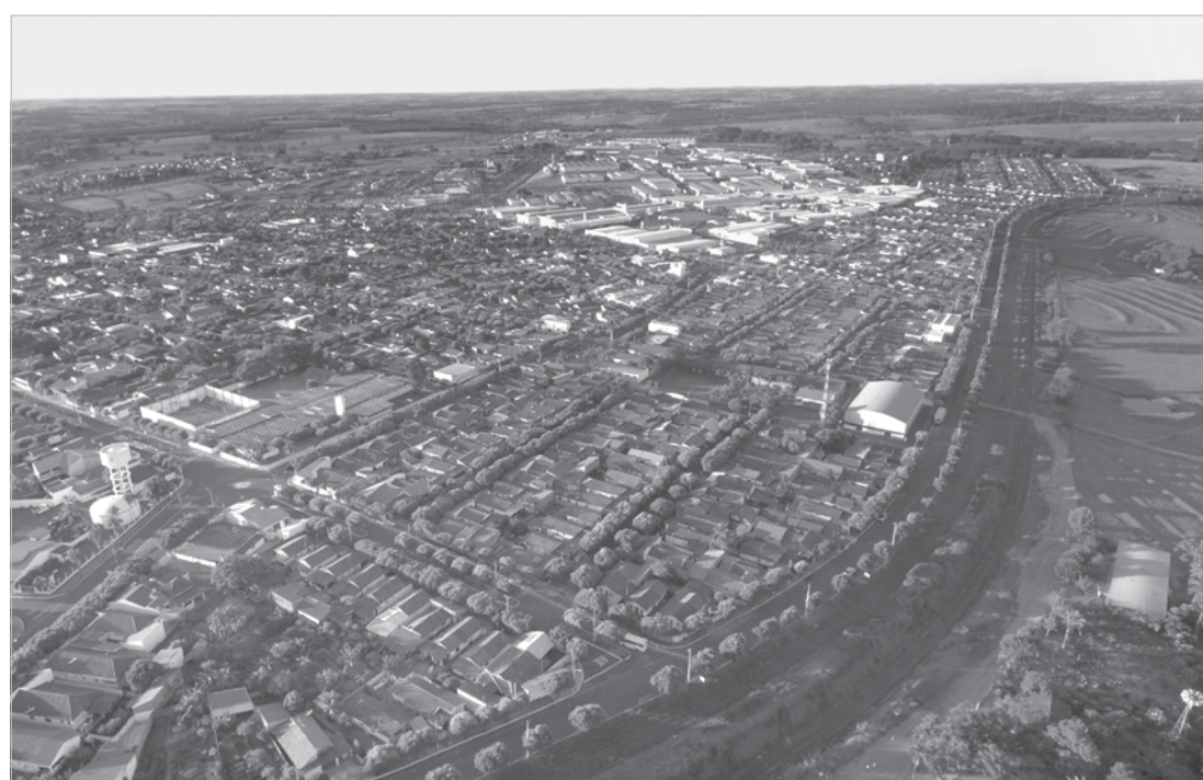
Na contramão desta crise, a prefeitura de Valentim Gentil está com a situação regularizada no CAUC

Utilize o QR Code para ter acesso a outras matérias relacionadas