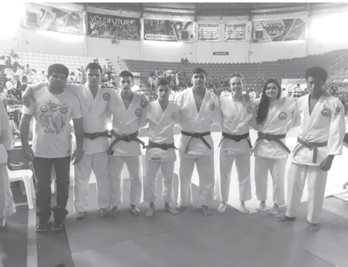
Atletas participaram do Campeonato Paulista de Judô 2019 - Fase Inter-Regional

Fernandópolis funciona na Avenida Rosalvo Aderaldo, 740 - Vila Esplanada (atrás do Estádio Municipal). As aulas acontecem de segunda e quarta das 18h às 21h, terça e quinta-feira das 19h às 21h e sexta-feira das 18h às 19h. Informações no local ou pelo telefone (17) 3442-2100.