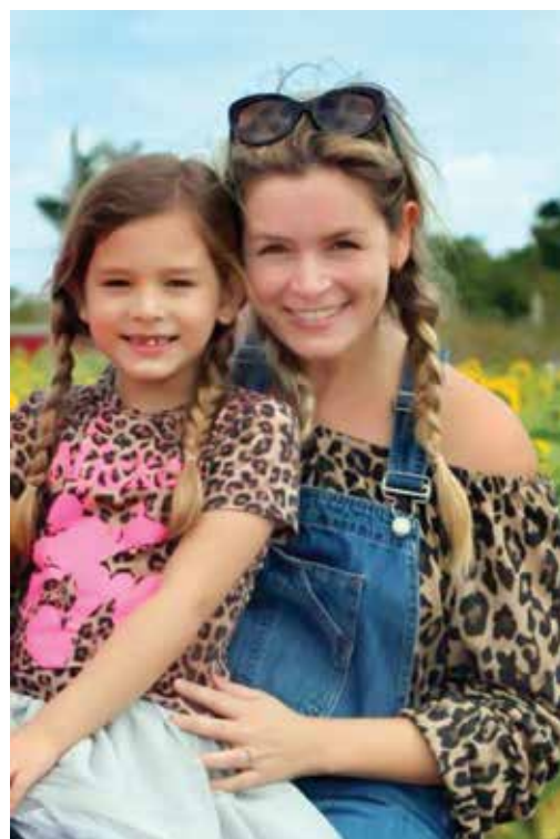
Ela mora há três anos e meio em Miami