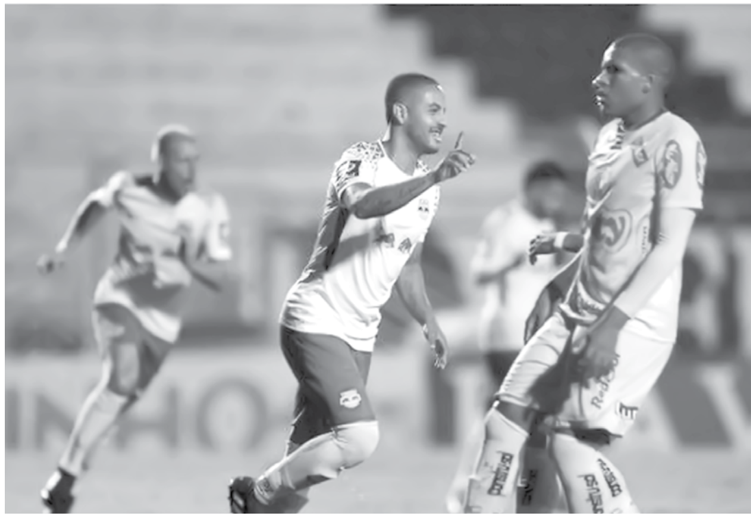
Jogo de volta ficou 3 a 1 para o time de Campinas

disputado em jogo único, no próximo fim de semana, para ter mais tempo de preparação à Série B do Brasileiro. Outro ponto é que os times jogam no Majestoso, o que não faria diferença no mando de campo. O Conselho Arbitral vai acontecer nesta terça-feira, na sede da FPF.