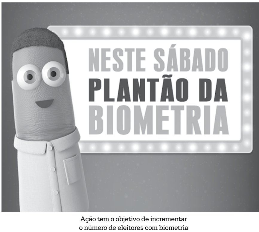
Ação tem o objetivo de incrementar o número de eleitores com biometria

DOCUMENTOS NECESSÁRIOS No momento do atendimento, o eleitor deve levar documento oficial de identificação e comprovante de residência. Se tiver o título, deve apresentá-lo também. O documento oficial de identificação precisa ser original, com foto, como RG, carteira de trabalho e carteira profissional emitida por órgão criado por lei federal. O comprovante de residência deve conter o nome do eleitor ou de seus pais. BIOMETRIA A biometria é uma tecnologia que confere ainda mais segurança à identificação do eleitor no momento da votação. Acoplado à uma eletrônica, o leitor biométrico confirma a identidade de cada pessoa por meio das impressões digitais, armazenadas em um banco de dados da Justiça Eleitoral e transferidas para as urnas eletrônicas.