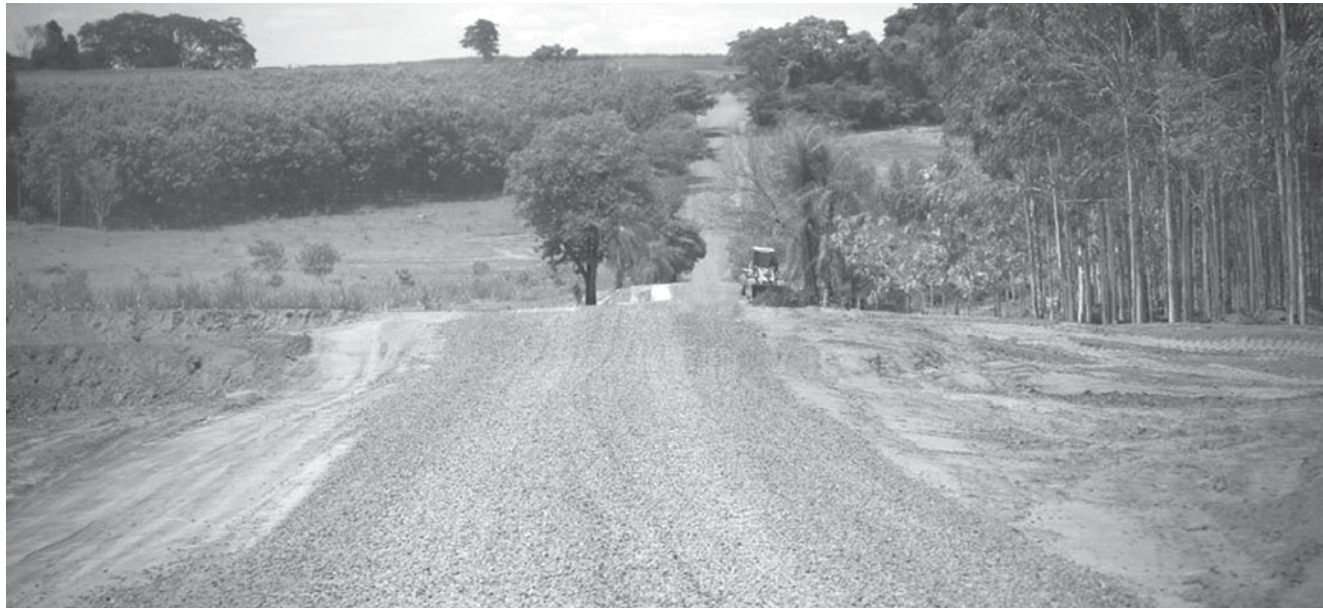
Para Valentim Gentil, a usina destinou pedras para a recuperação de estradas rurais e reconstrução de pontes