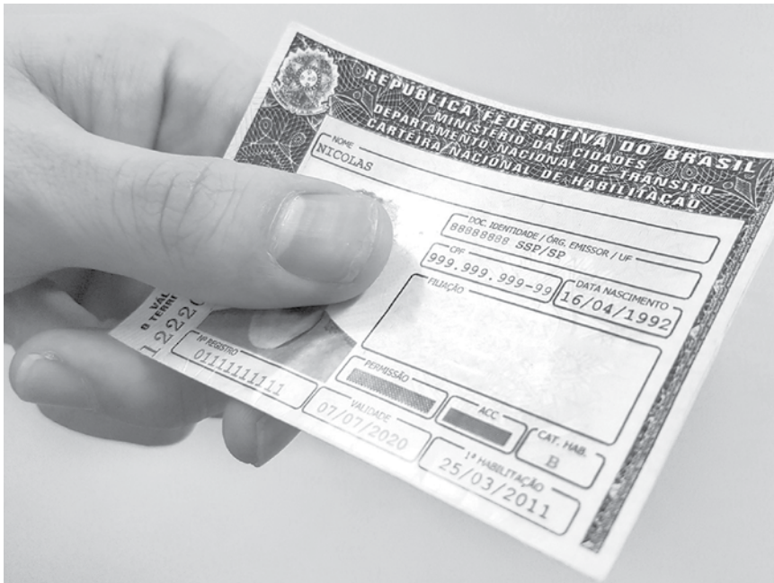
Projeto também vai tornar mais ágil a suspensão da habilitação em casos de infrações muito graves

→ Da REDAÇÃO contato@oextra.net Nesta segunda-feira, 8, o ministro da Infraestrutura, Tarcísio Freitas, afirmou que o ministério enviará ainda nesta semana para o Palácio do Planalto uma proposta de projeto de lei que prevê o aumento do prazo de validade da carteira de motorista (atualmente de cinco anos) e também da quantidade de pontos pela qual o motorista perde a habilitação em caso de acúmulo de infrações. O ministro não detalhou o projeto, mas disse que, além de aumentar a pontuação para a suspensão da carteira, a proposta também acelerará o processo de suspensão em casos de infrações mais graves, como dirigir sob o efeito de álcool. “A questão da prorrogação e mais um conjunto de questões, como a alteração na pontuação para perda de habilitação depende de lei. Já está pronto e será enviado para o Planalto ainda esta semana”, disse. Atualmente, o motorista pode ter a carteira suspensa se acumular, ao longo de 12 meses, 20 ou mais pontos. Esses pontos são acumulados de acordo com as infrações cometidas no trânsito. O projeto também vai tornar mais ágil, disse o ministro, a suspensão da habilitação em casos de