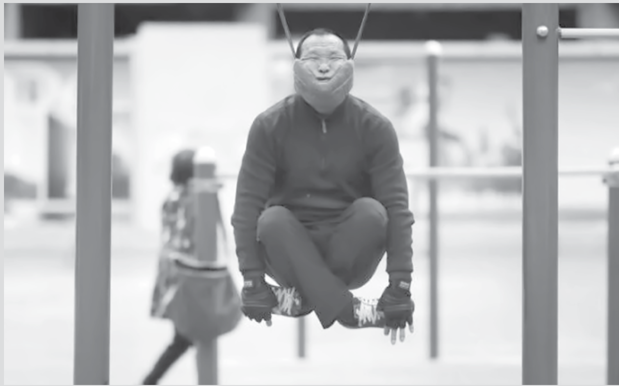
imagem do dia

Homem faz exercícios com um dispositivo de tração cervical improvisado anexado a barras complexo esportivo em Shenyang, província de Liaoning, China.