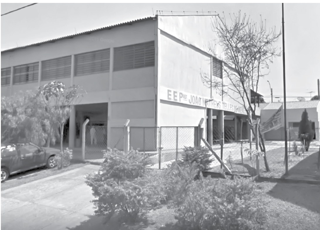
Aluno de 14 anos é detido após fazer lista com nomes para massacre em escola

Utilize o QR Code para ter acesso a outras matérias relacionadas