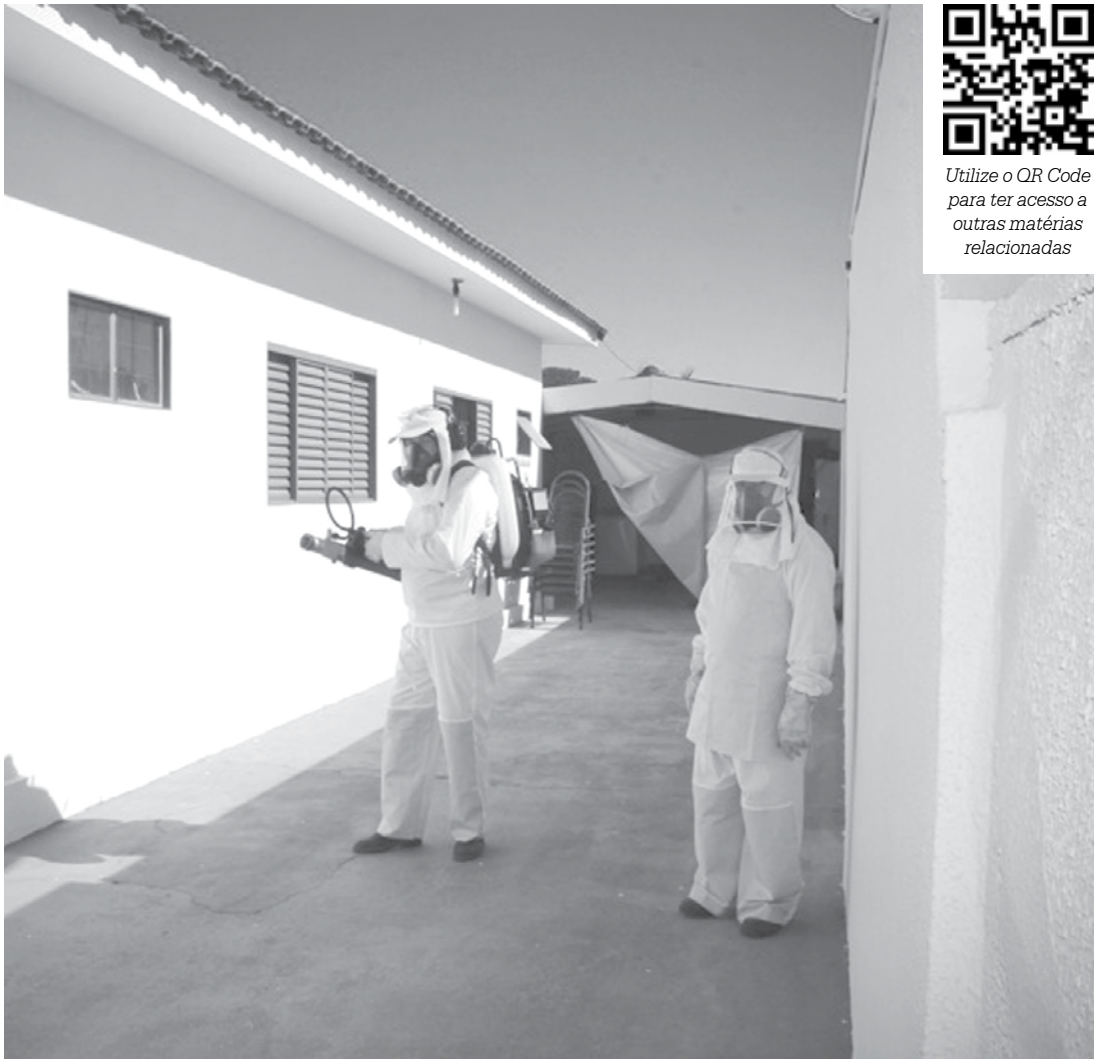
Agentes de saúde e de vetores estão percorrendo todos os bairros para identificar e eliminar criadouros do mosquito