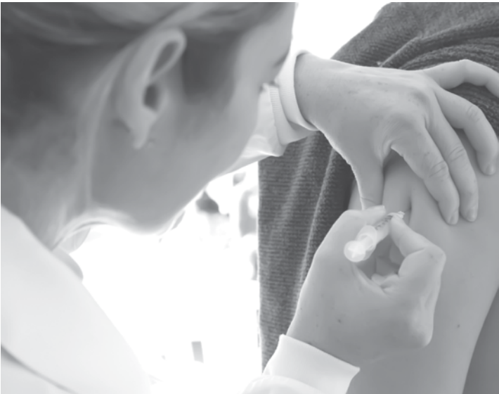
Campanha começa nesta quarta-feira, 10

Utilize o QR Code para ter acesso a outras matérias relacionadas