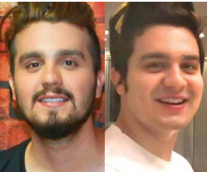
Antes e depois do cantor