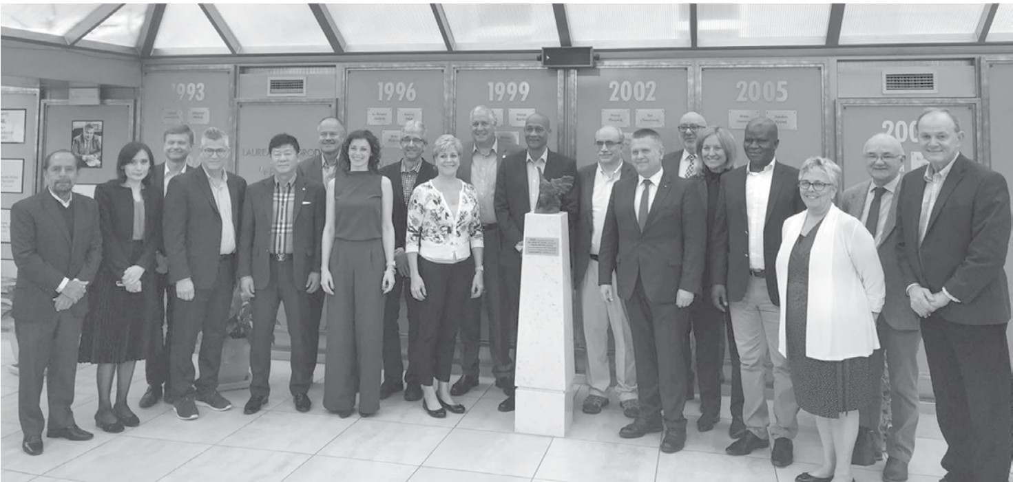
Evento que acontece entre os dias 3 e 5 de abril, na cidade de Sopot (Polônia), contou com a participação do Sicredi