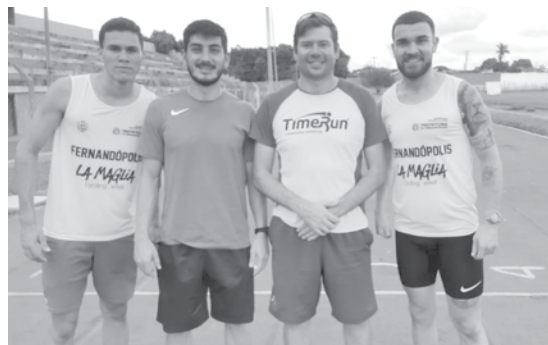
Atleta começou a treinar e competir em 2016

nais e jogos abertos. “Meu objetivo é estar entre os melhores em todas as competi-