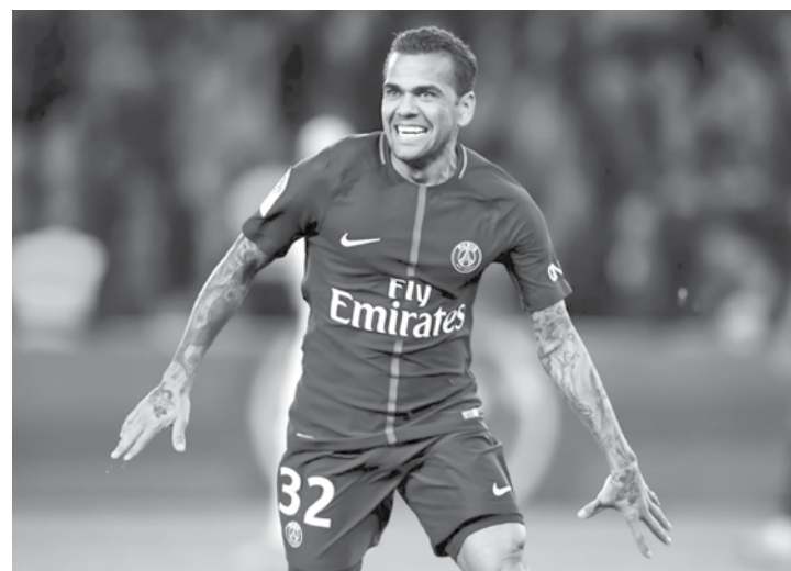
Daniel Alves é jogador do Paris Saint Germain

Na quinta-feira, 11, será realizado o Conselho Arbitral da competição e como o clu-