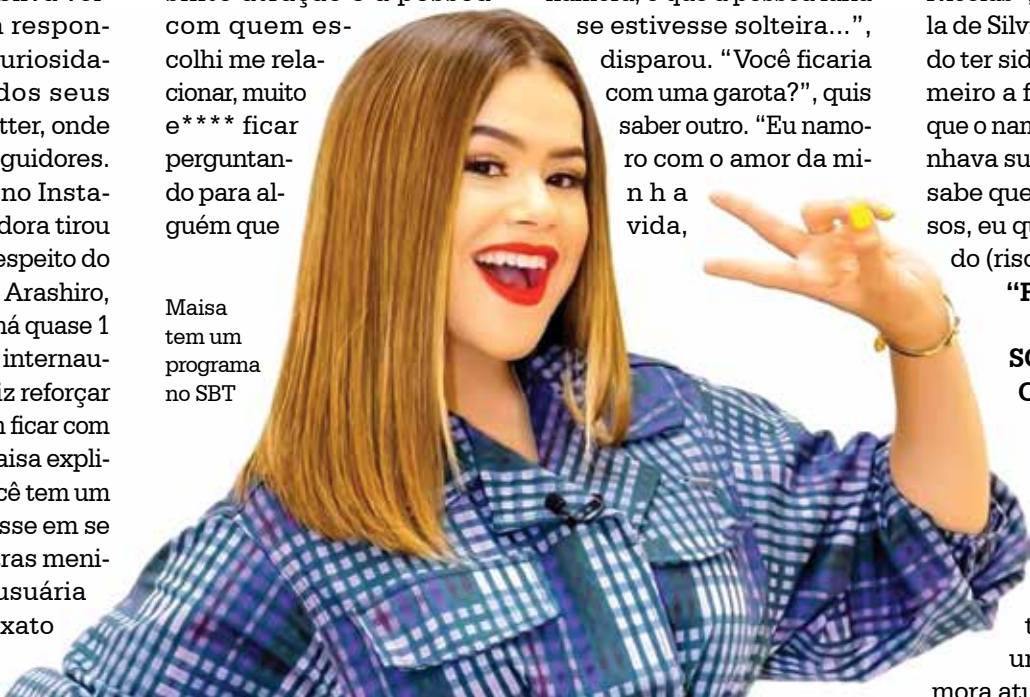
Maisa tem um programa no SBT

namora, o que a pessoa faria se estivesse solteira...”, disparou. “Você ficaria com uma garota?”, quis saber outro. “Eu namoro com o amor da minha vida,