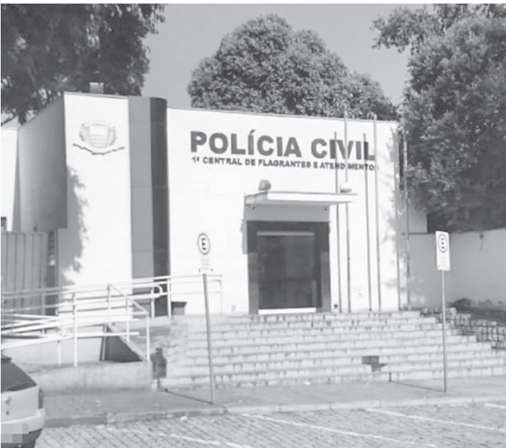
Caso foi registrado no plantão policial em Rio Preto

continha no site e negociou a compra do veículo por meio de lances online. Na sexta-feira, 5, ele fez o depósito de R$ 29,4 mil em uma conta de uma agência bancária de São Caetano do Sul (SP). Ao chegar no endereço em Rio Preto para pegar o carro, o empresário descobriu que no local não funcionava nenhuma empresa de leilão. Ele percebeu que caiu em um golpe e procurou a delegacia para registrar um boletim de ocorrência.