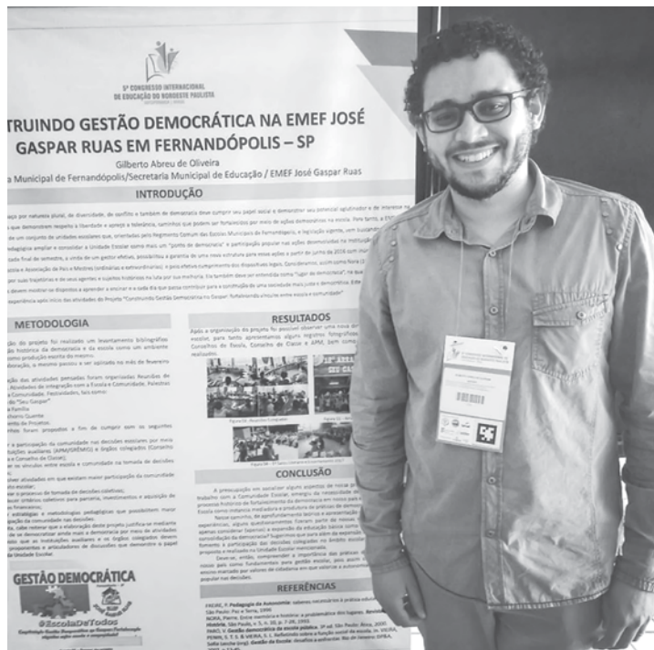
Diretor de Fernandópolis ministrará no Congresso

Utilize o QR Code para ter acesso a outras matérias relacionadas