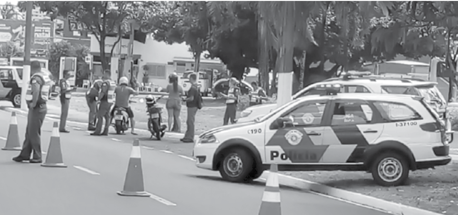
Operação contou com a mobilização de 18.600 policiais militares

arma é dele ou não. Também vamos investigar de quem é essa arma e aguardamos também a perícia do local”, diz.