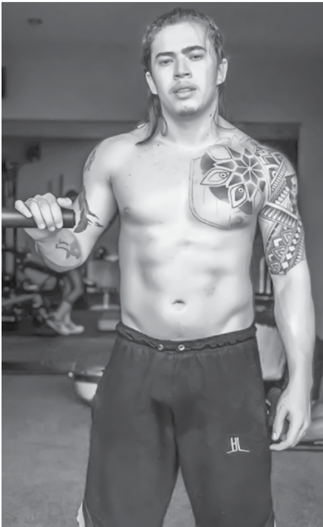
Ele não posta nada desde a última sexta-feira

Após o desabafo, Whindersson revolveu dar um tempo nas redes sociais. Sempre presente, com fotos e vídeos, ele não posta nada desde a última sexta-feira.