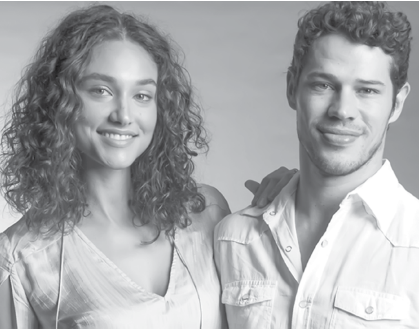
Os dois chegaram em carros separados