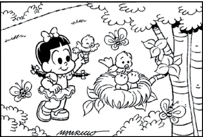
RESP: 1-BORBOLETA 2-ESQUELDA 3-COPA DA AR- VOR: 4-LAÇO DA ROSINHA 5-MANTINHA 6-FEITA DO SA- PARTO DA ROSINHA 7-TRANCA DA ROSINHA