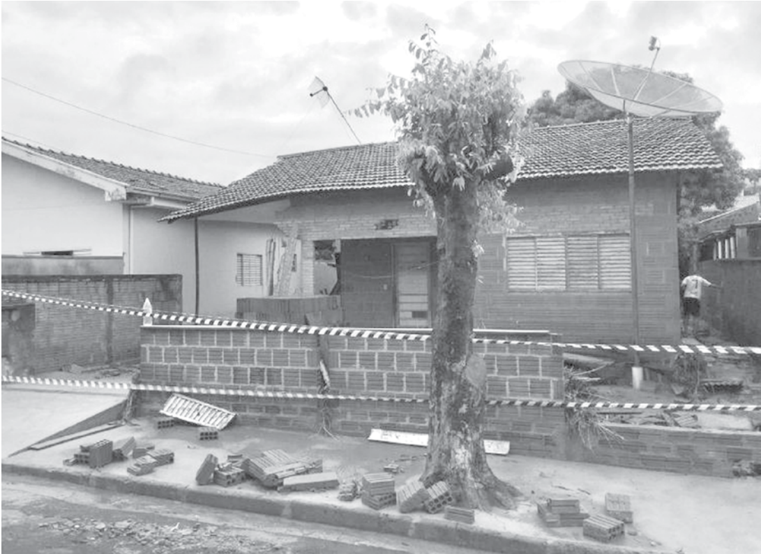
Casa foi interditada pela Defesa Civil após chuva

Já uma árvore impediu o trânsito na BR-153 em Nova Granada neste domingo (14). A queda teria sido provocada pela chuva e interditou o tráfego por cerca de 40 minutos nos dois sentidos da rodovia e teve congestionamento. A árvore, de aproximadamente 7 metros, foi retirada por funcionários da concessionária. Ninguém se feriu.