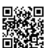
Utilize o QR Code para ter acesso a outras matérias relacionadas

início, soma mais de 67 bilhões de documentos fiscais processados. No total, a Nota Fiscal Paulista devolveu aos participantes do programa R$ 16,3 bilhões, sendo R$ 14,5 bilhões em créditos e mais de R$ 1,8 bilhão em prêmios nos 125 sorteios já realizados. Para conferir os créditos, aderir ao sorteio ou obter mais informações sobre a Nota Fiscal Paulista, basta acessar o site portal.fazenda.sp.gov.br/servicos/nfp. Para baixar o aplicativo do programa, acesse a loja de aplicativos de seus smartphones ou tablet.