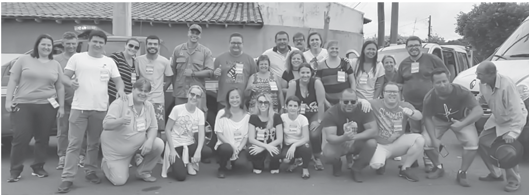
Segundo dia contou com diversos voluntários e muitas doações