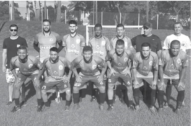
Deaço A e Santa Casa são os primeiros semifinalistas