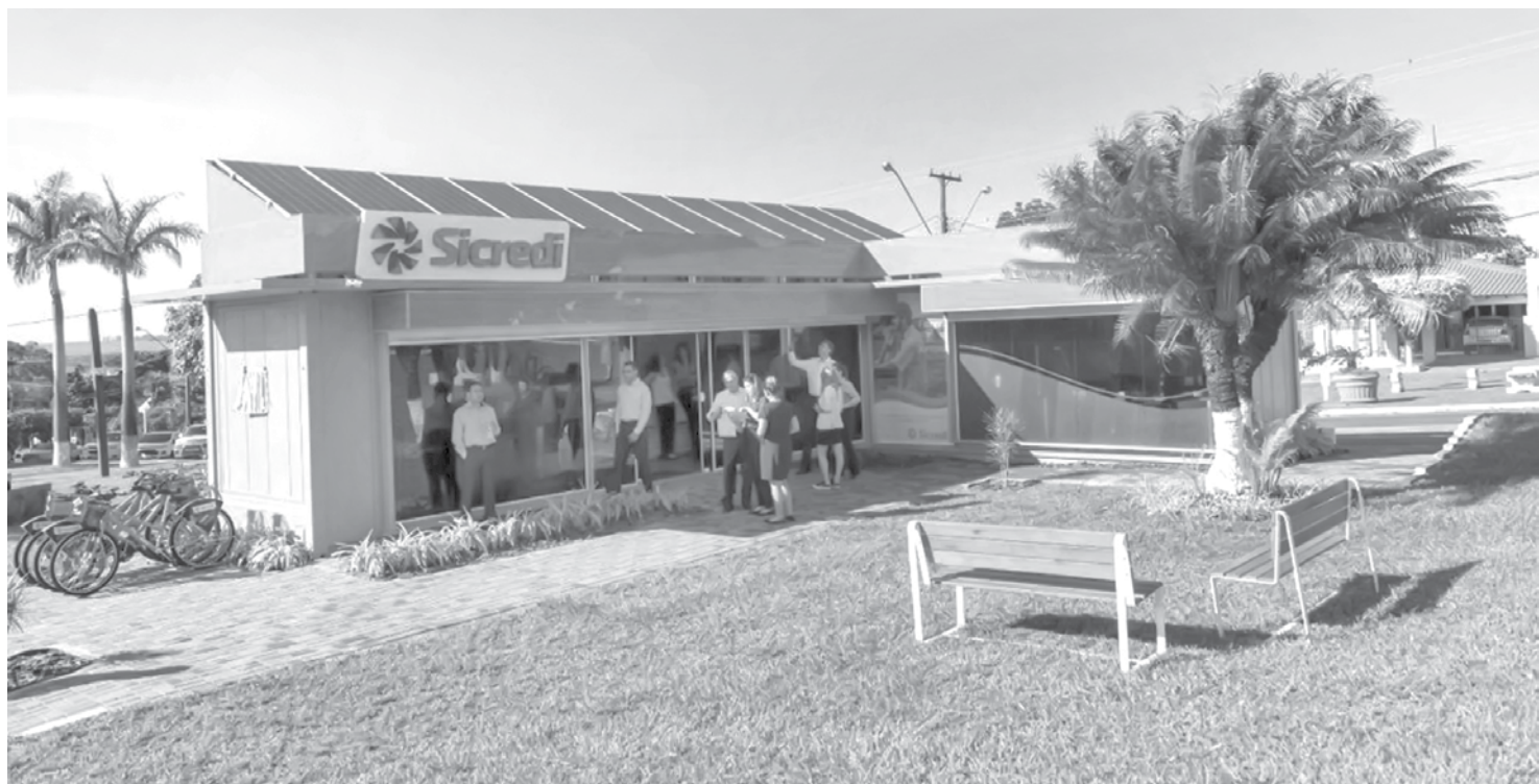
A cidade de Cafeara (PR) foi a primeira a receber o modelo com transações financeiras sem circulação de papel moeda

“Mais do que realizar transações econômicas, lançamos o projeto para fazer uma transformação na vida da comunidade onde atuamos. Com a iniciativa em Cafeara desenvolvemos várias ações que demonstram