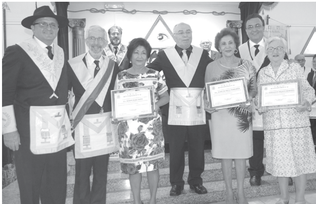
Reunião aberta foi realizada na última semana

Utilize o QR Code para ter acesso a outras matérias relacionadas