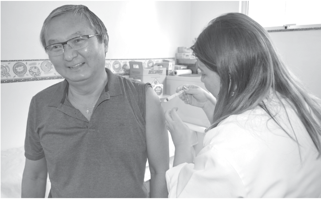
Doses estão disponíveis em todas as unidades de saúde de Fernandópolis e Brasitânia, das 8h até antes das 17h até dia 31 de maio