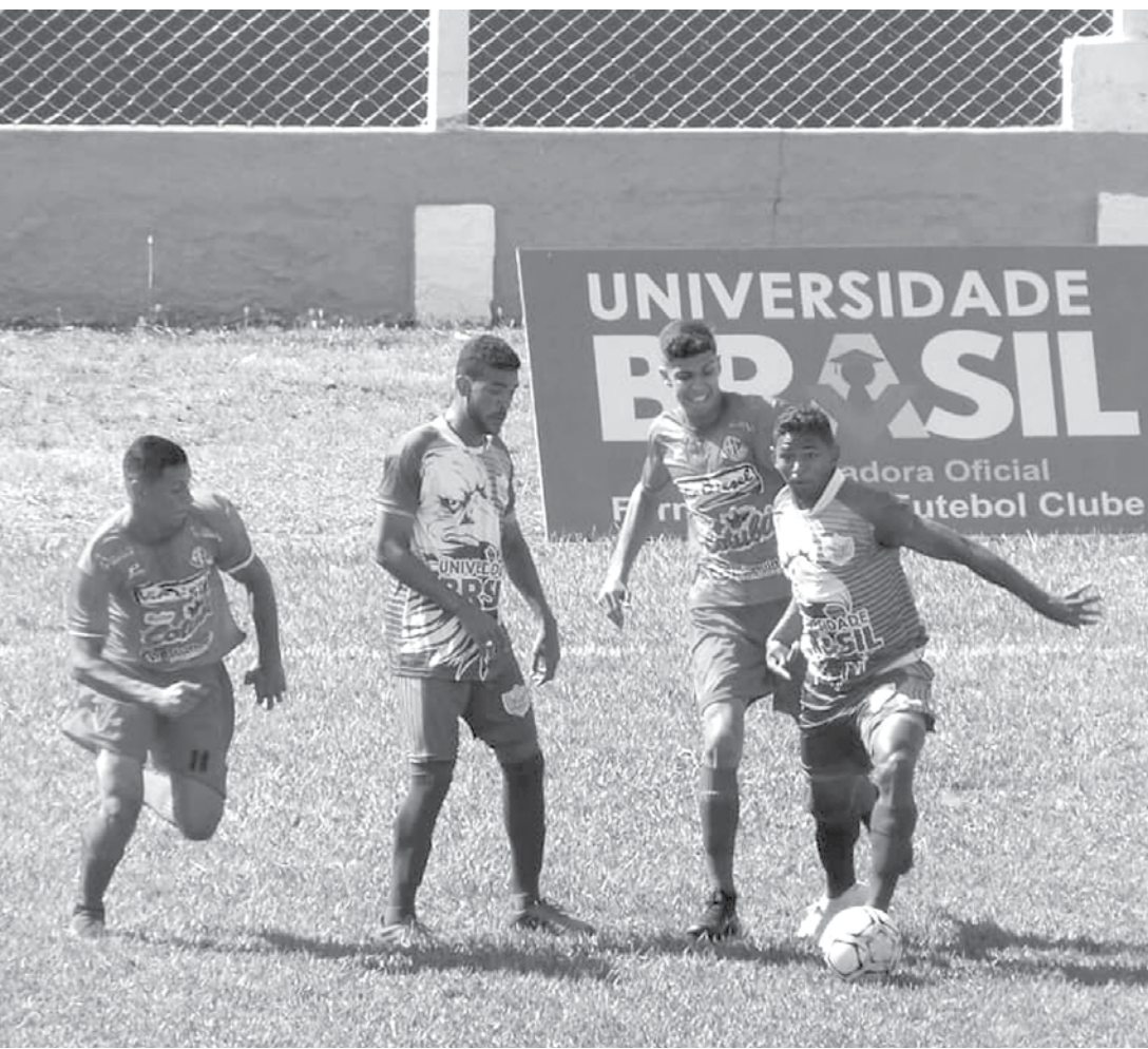
Fefecê venceu o América em partida válida pela terceira rodada do Paulista

Águia tem 3 vitórias em 3 jogos e é líder do Grupo 1, com 9 pontos ganhos