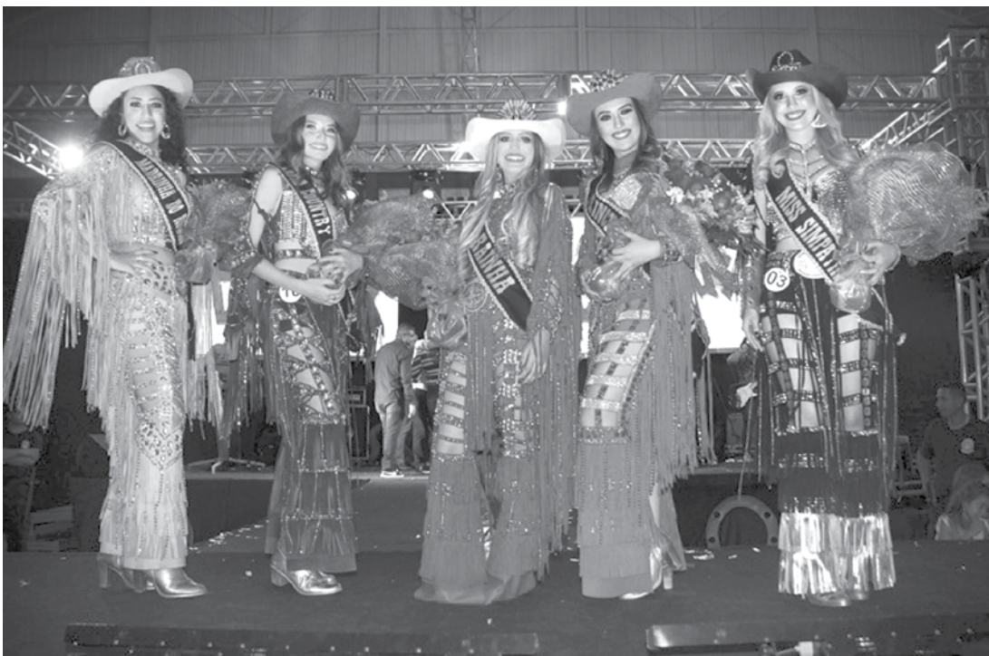
Neste ano, foram utilizados dispositivos eletrônicos (celulares) para os seis jurados atribuírem notas, com o objetivo de agilizar a apuração

No dia 28 de abril, será realizada a Missa em Ação de Graças pelo aniversário da