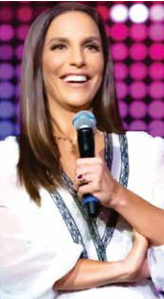
“Ai meu Deus, que coisa linda, meu amor”, disse Ivete sobre a apresentação do filho

Ivete Sangalo foi uma das estrelas do programa “Tamanho Família” deste domingo, 21. Ao lado de Zezé Di Camargo, a cantora também foi às