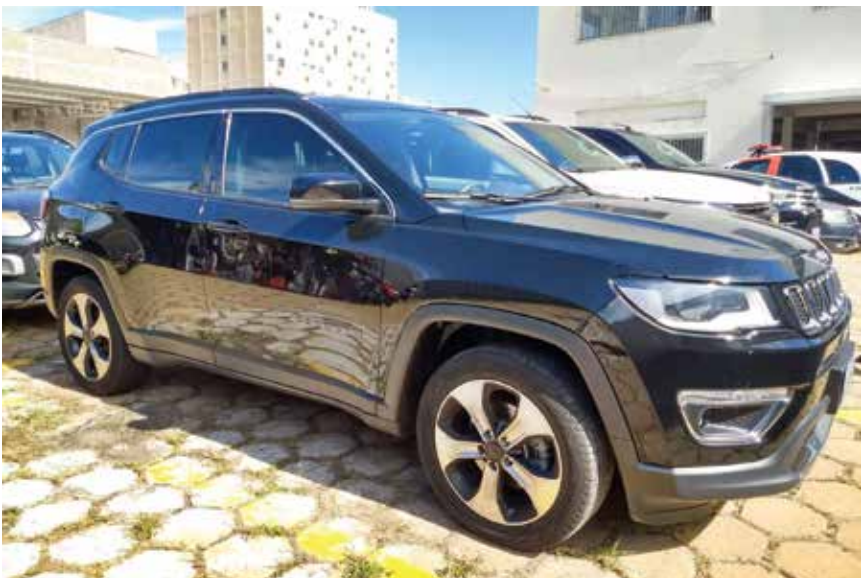
Carro de luxo apreendido pela Polícia Civil durante a operação

As empresas de Fernandópolis e da região estão recebendo boleto bancário tendo como beneficiário o SNCC de São Paulo, para ser pago no presente mês de abril/2019, variando os valores cobrados. Página A2