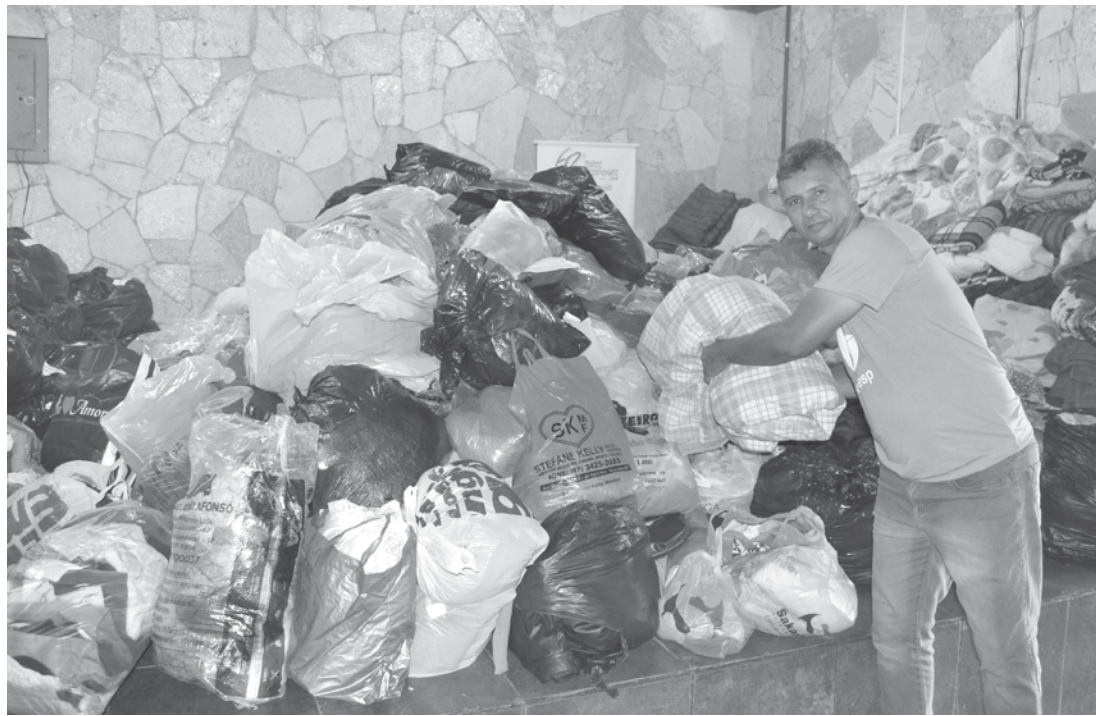
Muitos itens já foram arrecadados e passam por processo de separação

A meta para este ano é arrecadar o maior número possível de roupas e cobertores, superando a campanha do ano passado que angariou 14 toneladas. Todas as doações serão repassadas à população através das entidades, associações de bairros, CRAS (Centro de Referência