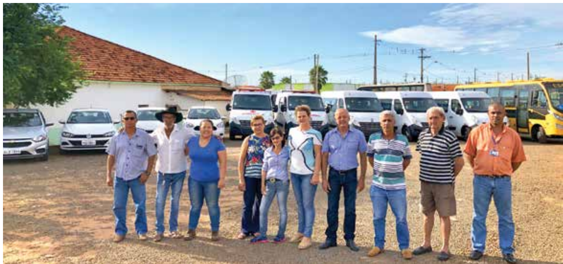
Entrega foi realizada na praça central do município e contou com o show da banda Estrela Supersom