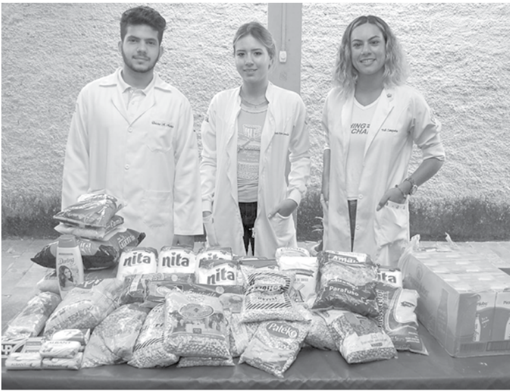
Associação Comunitária Maria João de Deus se mantém com recursos públicos das três esferas governamentais

Utilize o QR Code para ter acesso a outras matérias relacionadas