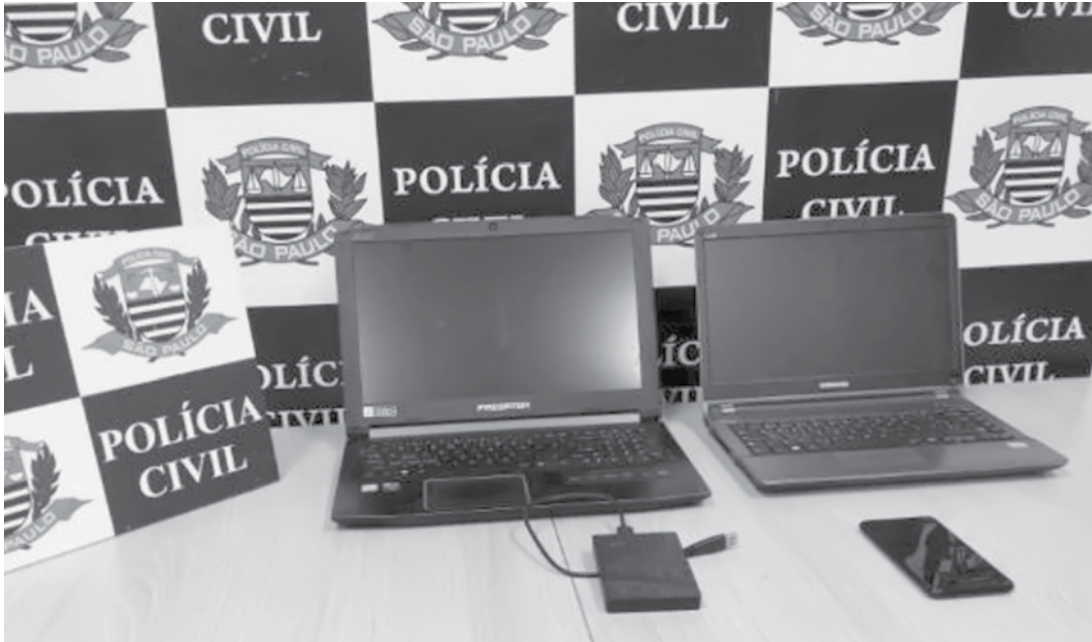
Equipamentos serão submetidos à perícia criminal

Uma equipe do Grupo de Operações Especiais da Polícia Civil de São José do Rio Preto cumpriu um mandado de busca e apreensão na manhã desta quarta-feira, 24, contra a pornografia infantil. Na ação, um rapaz de 26 anos, morador do Jardim das Oliveiras, zona norte de Rio Preto, foi detido. Na casa do rapaz, a polícia também apreendeu dois notebooks, um celular e um hd externo. Segundo o delegado coordenador do GOE, Alexandre Arid Neto, o notebook foi encontrado por meio de uma investigação eletrônica. Após vasculhar o equipamento, os policiais encontraram vídeos contendo pornografia infantil. O rapaz foi conduzido à delegacia para prestar depoimento, mas não ficou preso. Segundo a polícia, ele foi liberado porque não ficou comprovado o compartilhado das imagens armazenadas no computador. Ele