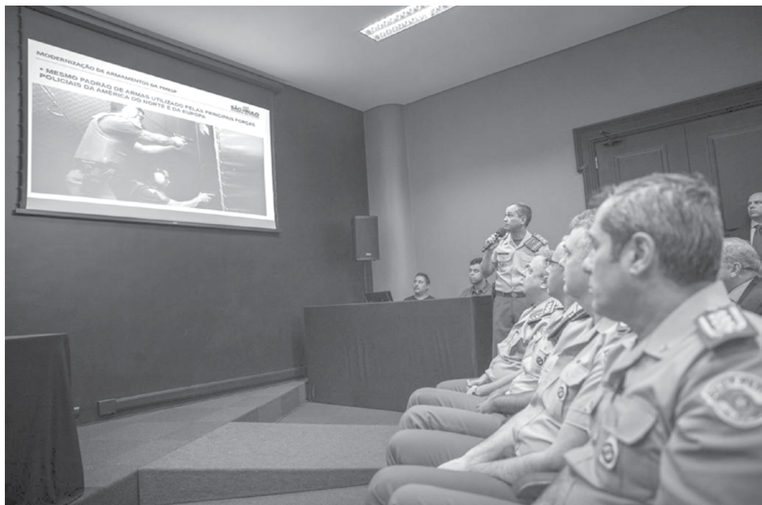
Atualmente, os processos de aquisição de armamentos da PM somam R$ 108,9 milhões

Utilize o QR Code para ter acesso a outras matérias relacionadas