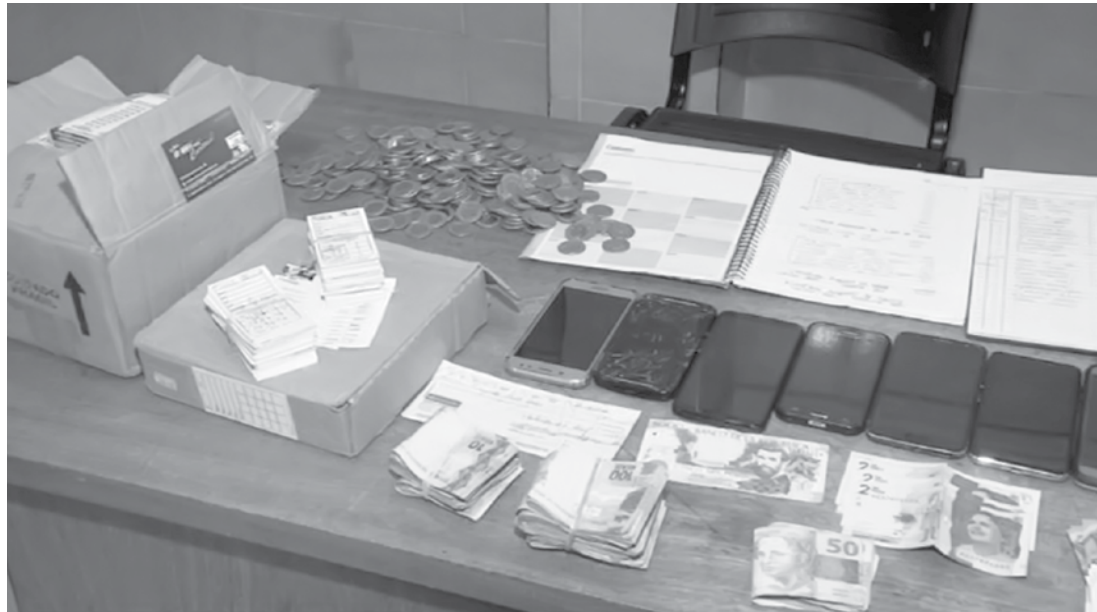
Material apreendido com colombianos em Rio Preto

O caso foi encaminhado para a Polícia Federal e o grupo de colombianos poderão responder por efetuar operação de câmbio não autorizada e usura pecuniária ou real.