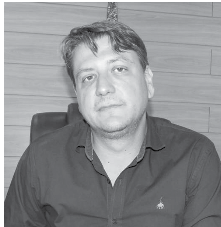
O prefeito Pessuto deve, mais uma vez, anular um Edital de Licitação

Utilize o QR Code para ter acesso a outras matérias relacionadas