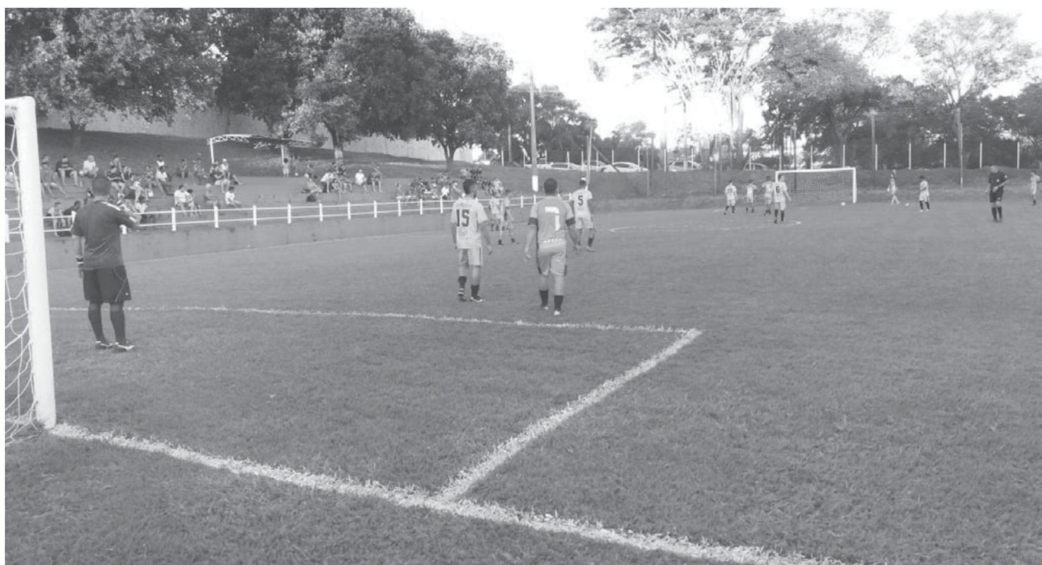
Final acontece na Secretaria Municipal de Esporte & Lazer (SMEL)