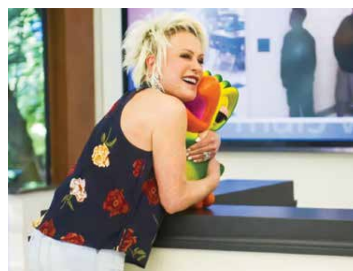
A apresentadora garantiu não ter planos de sair do canal ou de se aposentar.

do se eu vou sair da Globo. Pedeu demissão da Globo? Vai sair da Globo? Não", garantiu. Aproveitando o espaço que tem todas as manhãs na rede da emissora, ela lamentou o ocorrido. "Eu não respondo a um monte de coisa que acontece por aí, mas isso já passou um pouco do limite", afirmou.