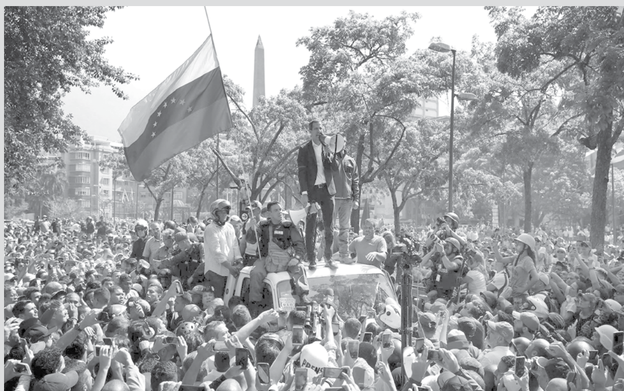
Juan Guaidó fala com megafone a multidão de cima de um carro em Caracas, após convocar o povo às ruas contra Maduro.