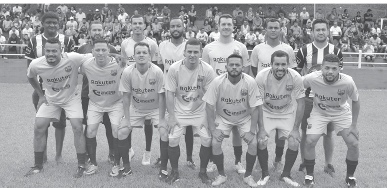
A equipe campeã, Engerb, levou o prêmio de R$1.000,00

Equipe venceu a Santa Casa por 4 a 1 na final da competição