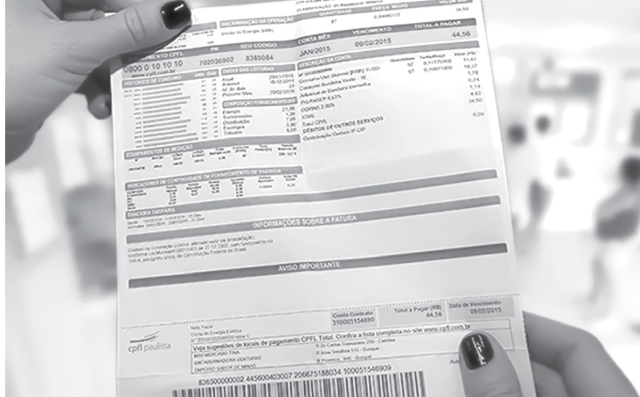
Com a bandeira amarela, cada 100 kWh custará mais R$ 1