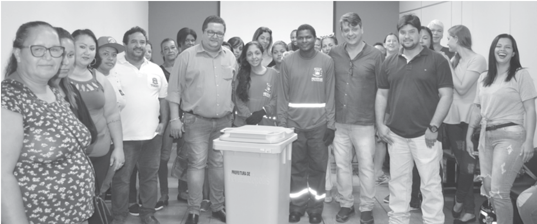
Equipe recebendo os novos uniformes com kit que contém 2 jogos de calça e camiseta, bota, luvas e boné

Também estão obrigadas a declarar as pessoas físicas residentes no Brasil que receberam rendimentos isentos, não tributáveis ou tributados exclusivamente na fonte, cuja soma for superior a R$ 40 mil; que obtiveram, em qualquer mês, ganho de capital na alienação de bens e direitos, sujeito à incidência do imposto ou que realizaram operações em bolsas de valores; que pretendem compensar prejuízos com a atividade rural; que tiveram, em 31 de dezembro de 2018, a posse ou a propriedade de bens e direitos, inclusive terra nua, de valor total superior a R$ 300 mil; que passaram à condição de residentes no Brasil em qualquer mês e assim se encontravam em 31 de dezembro ou que optaram pela isenção do IR incidente sobre o ganho de capital com a venda de imóveis residenciais para a compra de outro imóvel no país, no prazo de 180 dias contados do contrato de venda.