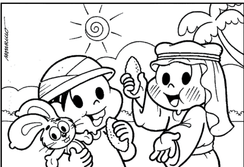
RESPOSTAS: 1- SOL, 2- NUNCA, 3- ESQUERDA, 4- CHAPÉU DA MONICA, 5- COQUEIRO, 6- FAIXA NA CINTURA DO CASCAO, 7- ORELHA DO SANSAO, 8- MANGA DA ROUPA DO CASCAO, 9- ORELHA DO SANSAO.