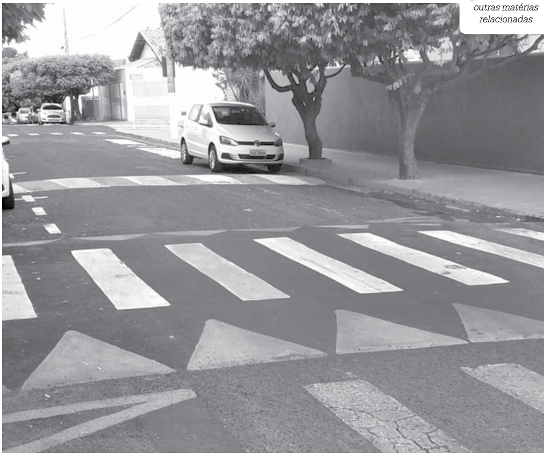
Nas fotos é possível ver as três lombadas; a primeira (foto abaixo), fica a cerca de 50 metros antes das outras duas (foto acima), que estão praticamente juntas

A Secretaria Municipal de Trânsito informou que já está providenciando a retirada de uma das lombadas do local.