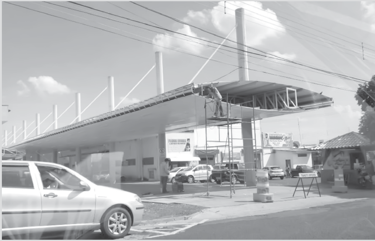
imagem do dia

A cobertura da Feira Livre, que abrange o trecho localizado na Travessa Antônio Barbieri, entre as ruas Rio de Janeiro e Espírito Santo, está passando por reparo. O forro da cobertura está danificado em razão dos ventos e fortes chuvas dos últimos meses em Fernandópolis. O reparo é reivindicação dos fernandopolenses e de muitos feirantes que trabalham no local à atual Administração Municipal.