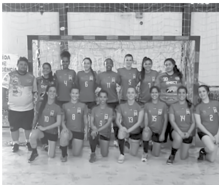
As meninas do handebol jalesense conquistaram acirrada vitória pelo placar de 17 a 16 contra a equipe de Castilho

O próximo compromisso de Jales na Liga será no dia 19 de maio, na cidade de Catanduva (SP).