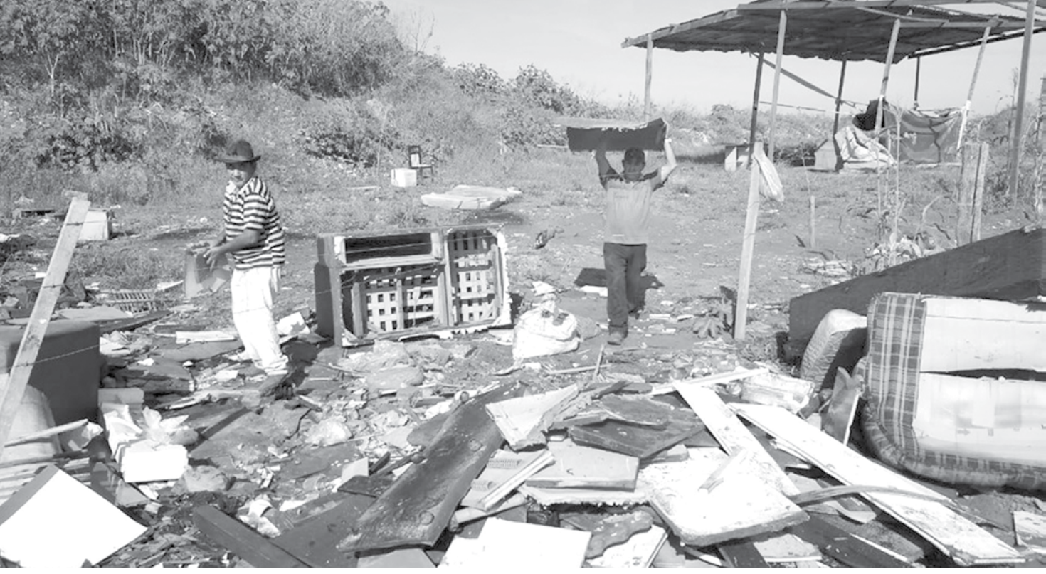
Material descartado irregularmente no local foi retirado nesta quarta-feira

Estrada de terra que liga a Meridiano é um dos locais que mais sofre com este problema