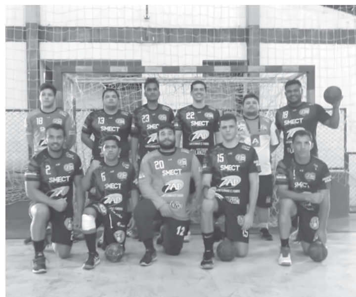
Com alguns desfalques na equipe, a categoria adulto masculino de Jales foi derrotada pelos donos da casa, Pereira Barreto, por 30 a 23