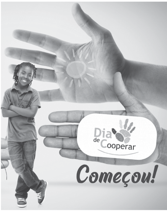
Ação faz parte do Dia C, o Dia de Cooperar, comemorado em 6 de julho

*Com informações da SECOM - Fernandópolis