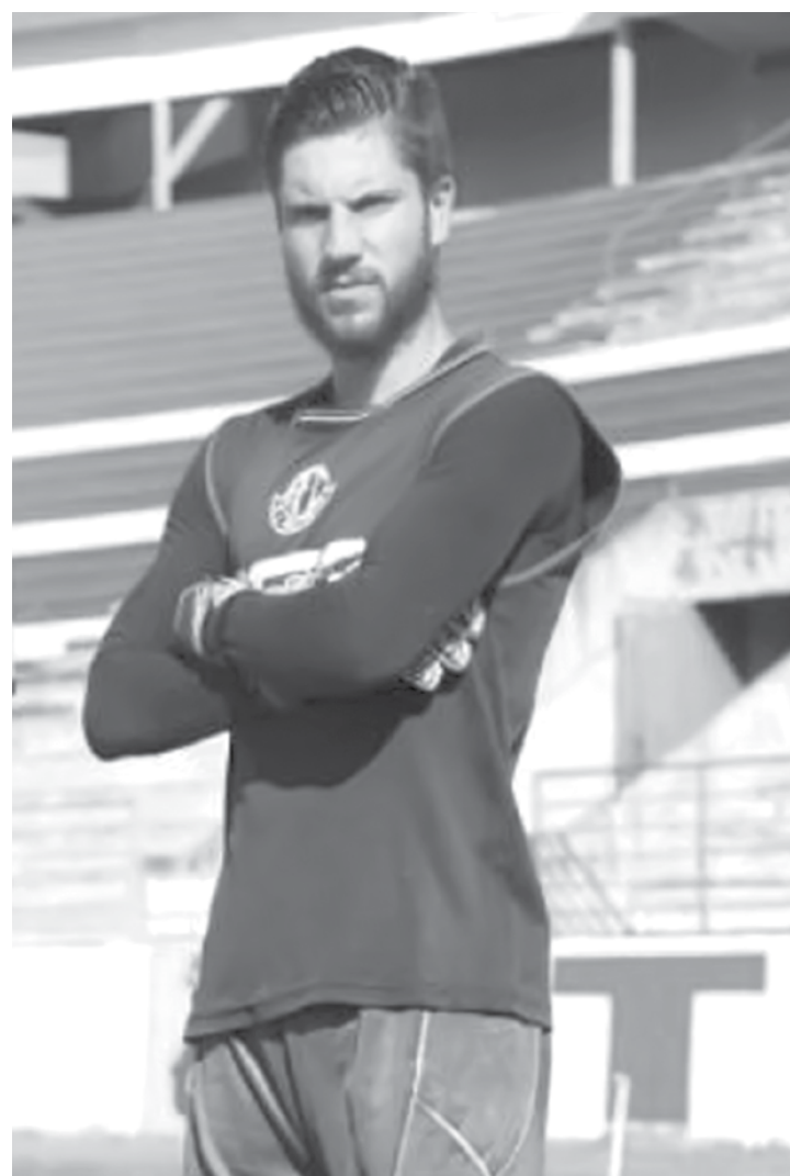
América contrata goleiro que chegou até as semifinais do Paulista A3