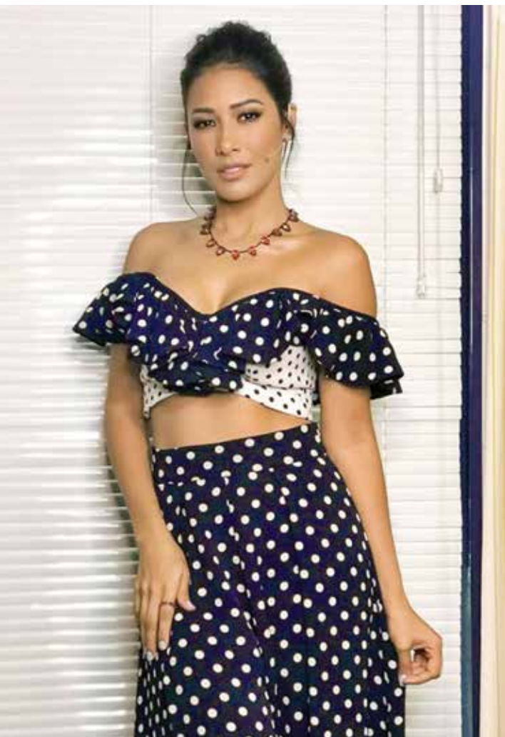
Cantora contou que o marido não é ciumento