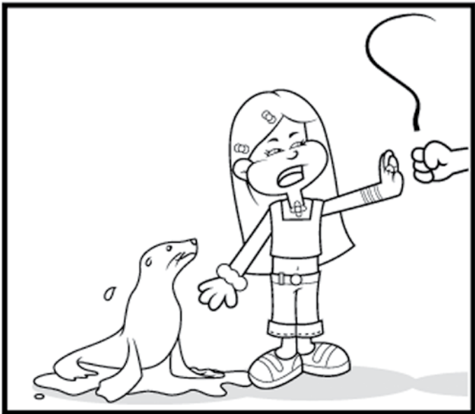
PEEP: 1- GOTA D'ÁGUA; 2- ESTRELA; 3- PRESILHA DO CABELO; 4- CINTO; 5- BIGODE DA FOCA; 6- CABO DO CHICOTE; 7- NADADEIRA DA FOCA.