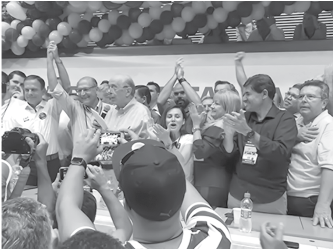
Líderes tucanos participaram da convenção do PSDB-SP