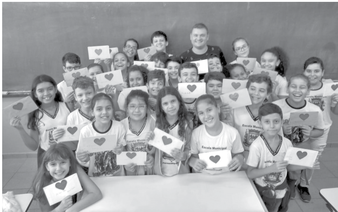
Cartas serão entregues no Dia das Mães, no domingo