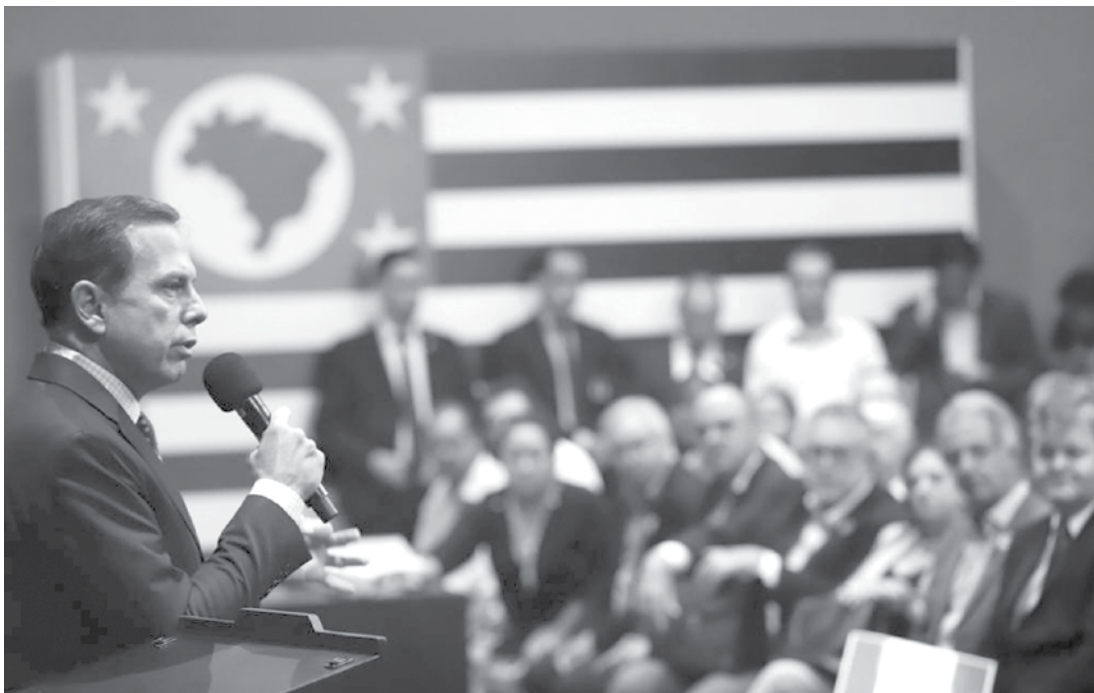
Anúncio de liberação de recursos orçamentários 2019 para 167 municípios do Estado aconteceu no Palácio dos Bandeirantes

faríamos um governo municipalista”, afirmou o Governador. “Todas as pautas municipais são compartilhadas com todos os secretários de Estado. Todos participam, é ação coletiva, é uma nova