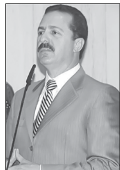
imagem da semana

Proibida desde 1996, dentro e num raio de 200 metros dos estádios no estado, a comercialização e consumo de bebidas alcoólicas está sendo rediscutida. A proposição é de Itamar Borges-MDB, alegando que a liberação não tem relação com a violência nos estádios; que aumenta o número de torcedores e a arrecadação de tributos. Durante a Copa do Mundo de 2014, o consumo foi permitido. Em alguns estados, tais como BA, SC e RJ é liberado.