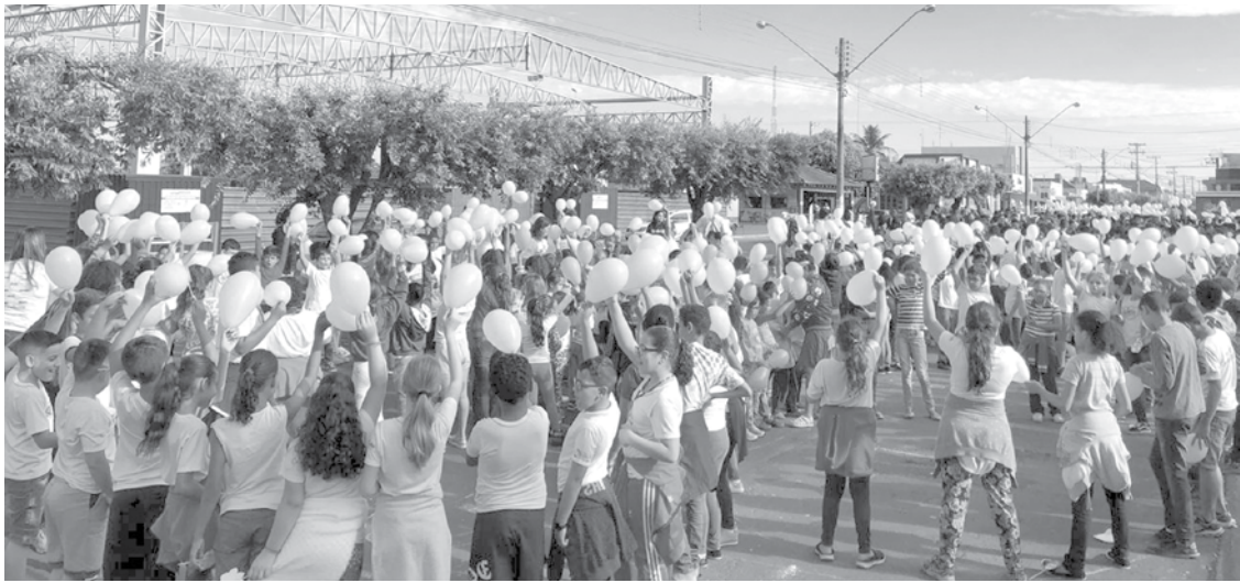
Caminhada foi feita pela principal Avenida de Ouroeste