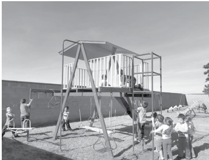
Instalação do playground possui finalidade pedagógica