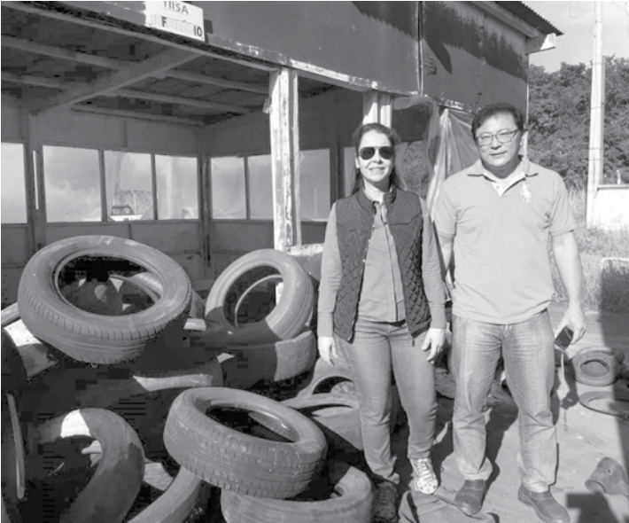
Campanha é destinada aos municípios que não possuem convênio com a Reciclanip