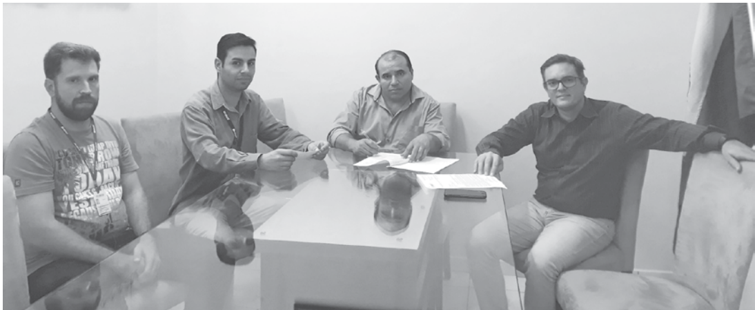
Encontro foi para tratar sobre o estabelecimento de arranjos institucionais e parcerias com relação ao Censo Demográfico 2020

Censo é a única pesquisa que objetiva visitar todos os domicílios do território nacional não apenas para contar a população, mas também para levantar informações sobre as suas características e suas condições de vida.