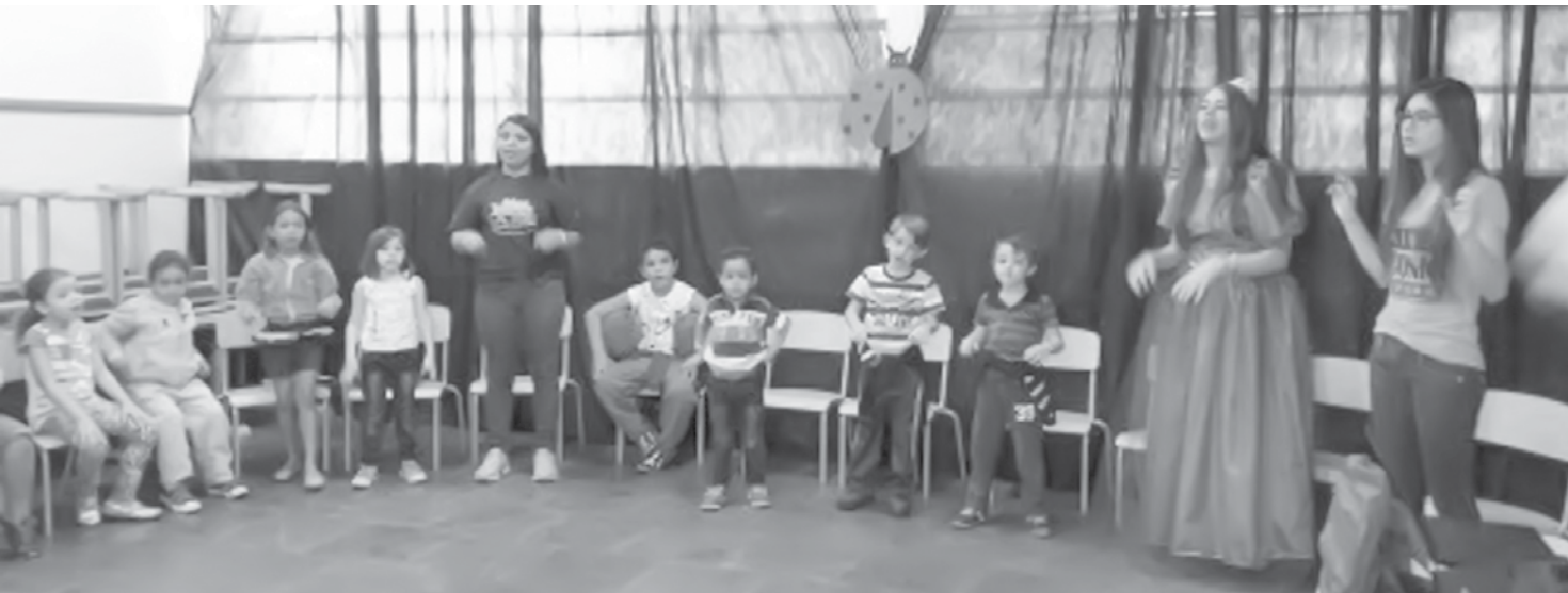
Em 2018, mais de 70 crianças participaram das atividades