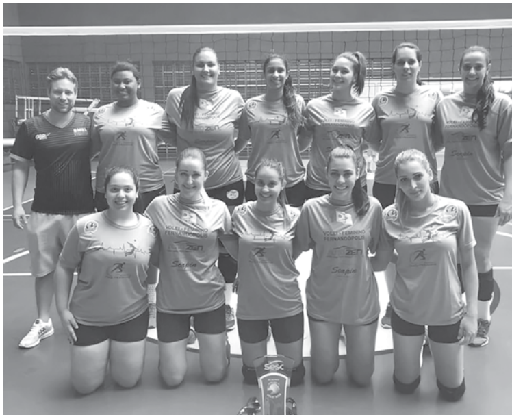
Equipe feminina de Fernandópolis conquistou o segundo lugar do Torneio Aberto de Vôlei Sesc 2019

participação de 16 equipes, e os jogos foram realizados no Sesc em Rio Preto.