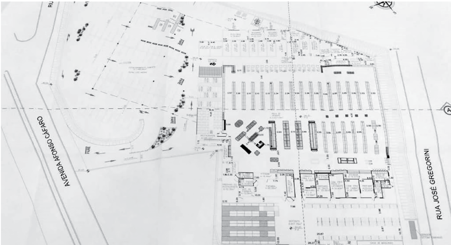
Serão gerados cerca de 140 empregos diretos

Utilize o QR Code para ter acesso a outras matérias relacionadas