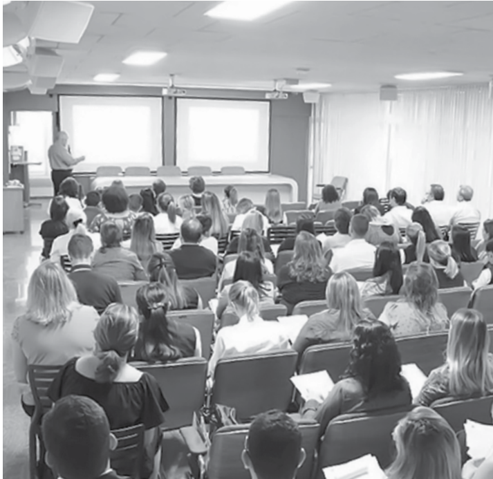
Evento foi realizado no Salão Nobre do Hospital