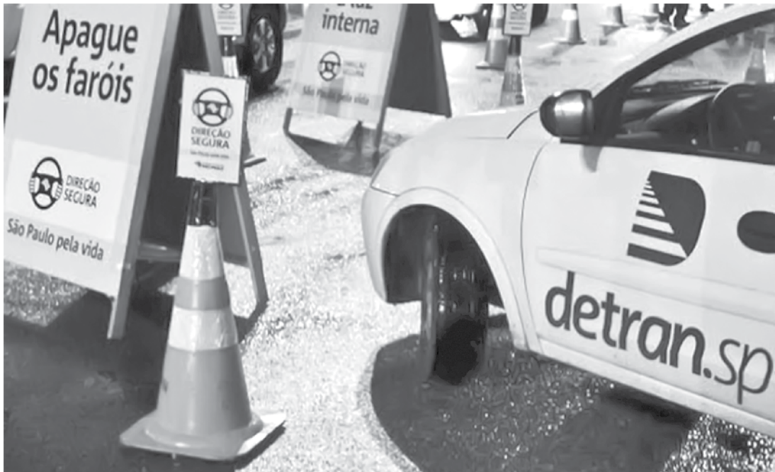
Ao todo, o programa do Detran fiscalizou 288 veículos na Expedicionários Brasileiros

Todos os motoristas flagrados em fiscalizações