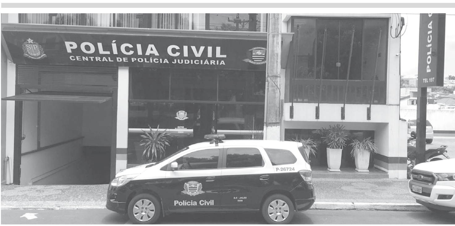
Celular foi devolvido na Polícia Civil de Jales