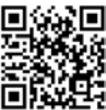
Utilize o QR Code para ter acesso a outras matérias relacionadas