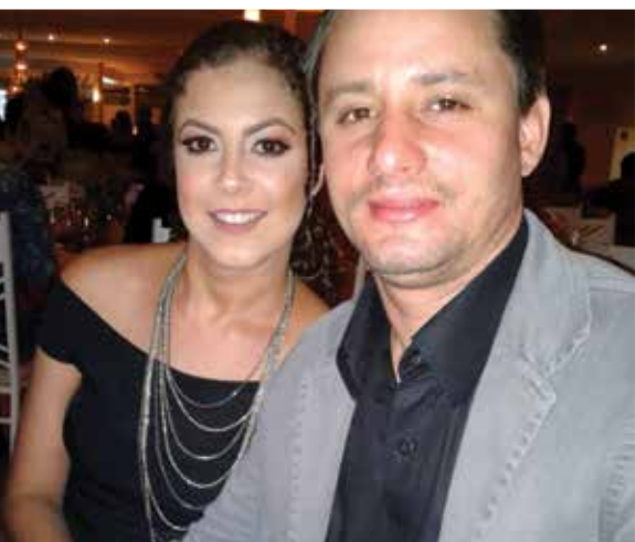
Suelen recebe homenagens de seus familiares, em especial, do maridão.