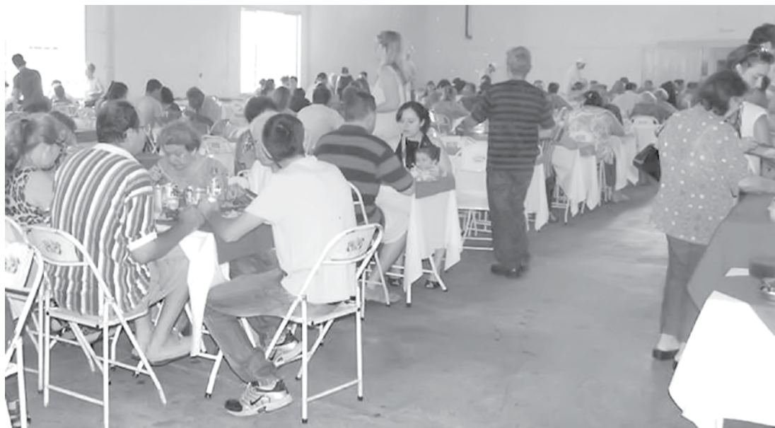
Verba para manter em funcionamento todo conjunto de projetos vem das ações promovidas pela “Associação Pátria do Evangelho”

Utilize o QR Code para ter acesso a outras matérias relacionadas