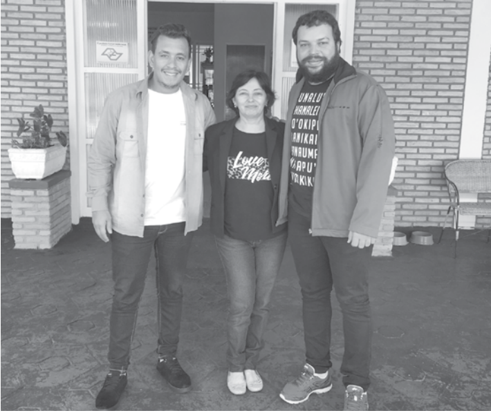
Principal proposta do grupo é desenvolver projetos específicos por meio de uma nova concepção em fazer o turismo

breve mais detalhes do evento serão divulgados. REGIÃO TURÍSTICA Formada a partir do desmembramento da Região Turística dos Grandes Lagos, com o objetivo de dinamizar as estratégias, com um número reduzido de cidades, a Região Turística Maravilhas do Rio Grande é composta hoje por 14 cidades: Cardoso, Fernandópolis, Guarani D'Oeste, Indaiaporã, Macedônia, Meridiano, Mira Estrela, Ouroeste, Paulo de Faria, Pedranópolis, Populina, Riolândia, Valentim Gentil e Votuporanga. A principal proposta do grupo é desenvolver projetos específicos por meio de uma nova concepção em fazer o turismo, buscando parcerias, estimulando investimentos, incentivando e integrando os diversos setores envolvidos no processo, utilizando de estratégias.