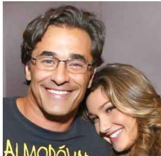
Luciano ao lado da filha Sasha Meneghel

causar polêmica, mas já escutei isso de pessoas que participaram. Você fica longe de qualquer notícia, longe dos pais. Como é que no quinto dia você está chorando por falta da família?", questionou. O programa está com lançamento previsto para o segundo semestre.