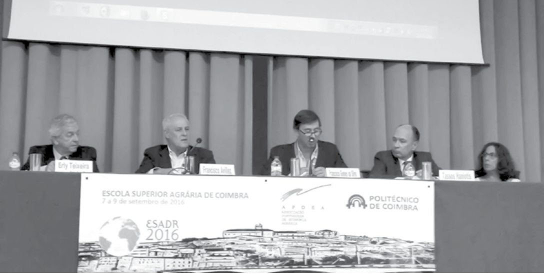
O tema dessa edição é "A Agricultura e os desafios sociais para o período 2020 a 2030"