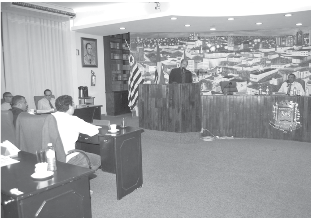
Votação recebeu 10 votos favoráveis e 2 contrários