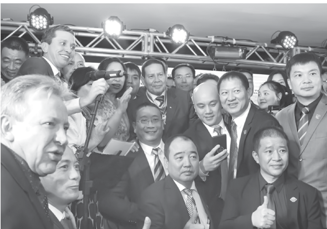
Autoridades brasileiras junto a representantes do governo chinês e grupos empresariais