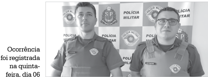
Ocorrência foi registrada na quinta-feira, dia 06