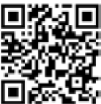
Utilize o QR Code para ter acesso a outras matérias relacionadas