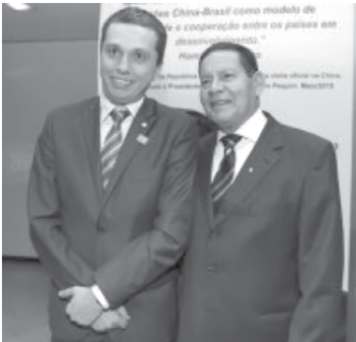
Pinato com o vice-presidente Hamilton Mourão

Utilize o QR Code para ter acesso a outras matérias relacionadas