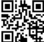
Utilize o QR Code para ter acesso a mais artigos da nossa equipe de articulistas

Basta apenas que os modelos sejam seguidos pelos demais, tanto mais, melhor, quanto mais, maior o ritmo da caminhada. Basta sermos menos mesquinhos, menos individualistas, menos juizes para sermos mais humanos, mais comunitários e mais altruístas. É preciso, seguindo àqueles exemplos de vida, ser pouco eu e ser tão Fernandópolis.