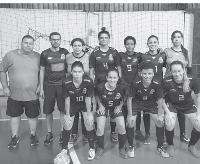
Equipe fernandopolense está na final da Copa Record