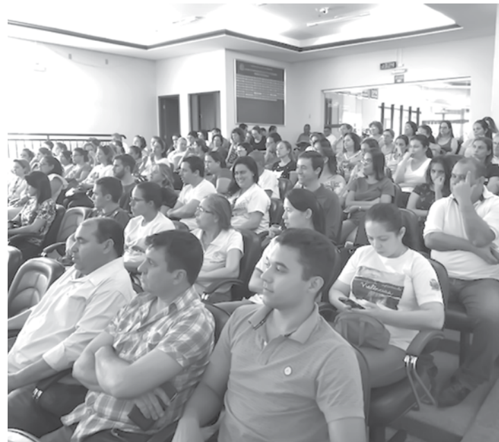
Dados apresentados foram referentes aos meses de Janeiro a Abril de 2019

Utilize o QR Code para ter acesso a outras matérias relacionadas