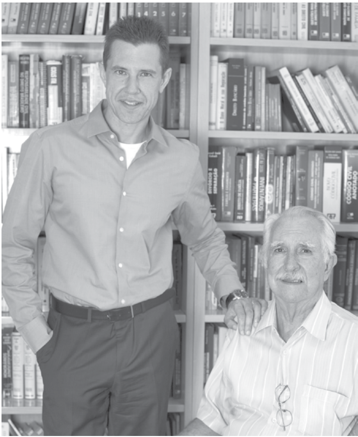
O advogado e escritor (em pé) fará palestra a convite da Pastoral da Sobriedade

Utilize o QR Code para ter acesso a outras matérias relacionadas