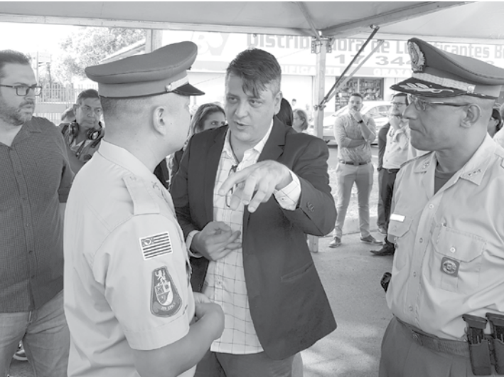
Prefeito André Pessuto em conversa com os policiais militares durante inauguração da nova rodoviária