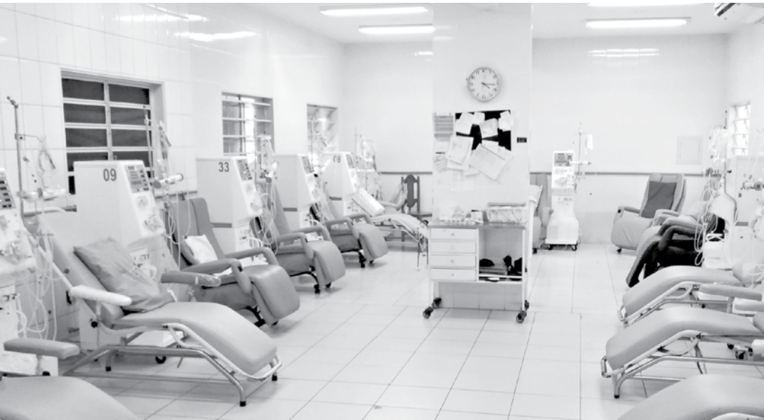
Objetivo do curso será de desenvolver a equipe de colaboradores do Instituto de Nefrologia