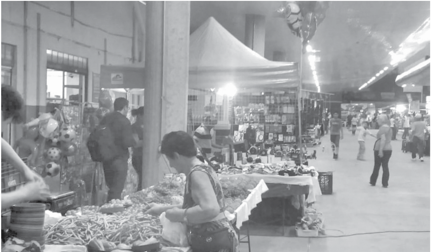
Fernandópolis agora tem feira nas noites de terça