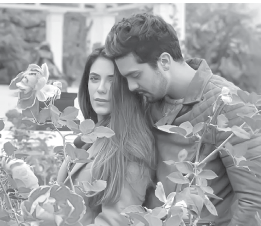
Os dois estão passando alguns dias em Buenos Aires, Argentina