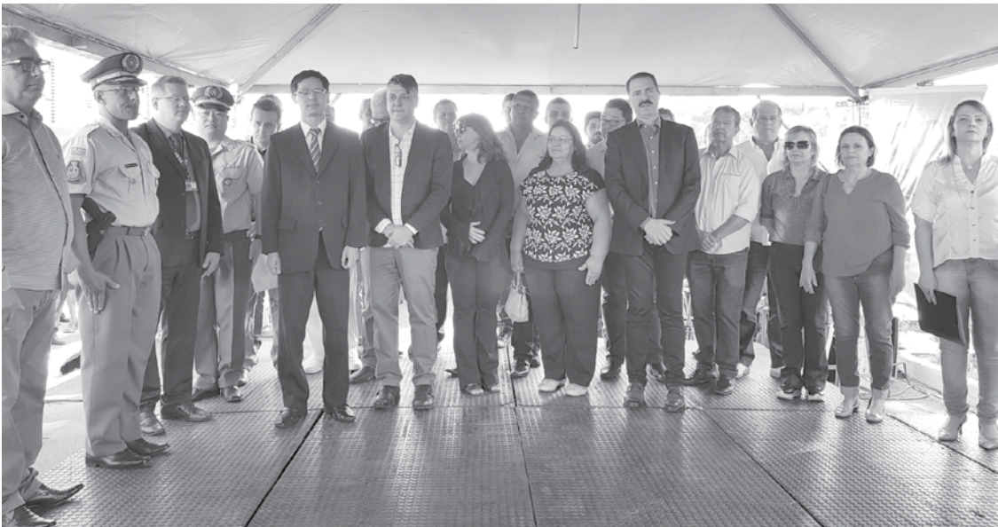
Inauguração aconteceu na manhã de ontem, dia 13