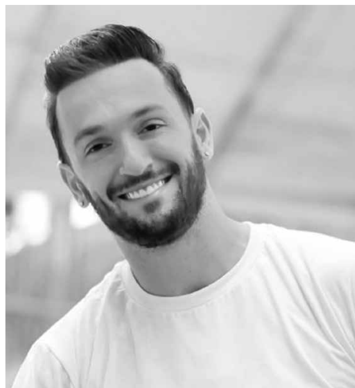
O atleta assumiu publicamente sua homossexualidade

O atleta também relembra o período de dificuldade financeira da família. “Eu me lembro de ir treinar sem ter o que comer, lembro do desespero da minha mãe. O Flamengo ficava meses sem pagar, a gente não tinha condição nenhuma de nada. Não pagavam o aluguel, não pagavam a minha irmã (Daniele Hypólito). Não tínhamos dinheiro para nada”, recorda.