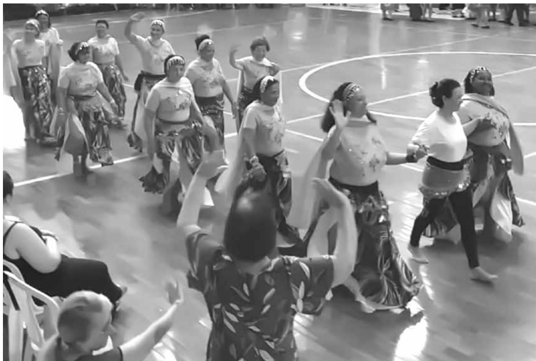
Evento aconteceu na cidade de Santa Fé do Sul

Utilize o QR Code para ter acesso a outras matérias relacionadas