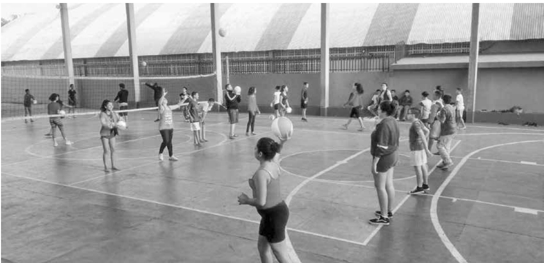
Há previsão da criação de turmas para crianças entre 07 e 11 anos

ça e do Adolescente - FMDCA. Há a previsão da criação de turmas para crianças entre 07 e 11 anos, em breve. Os in-