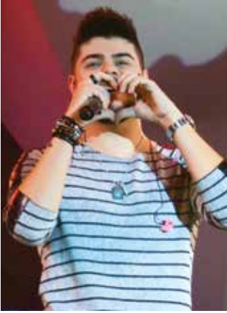
Desabafo do cantor teve grande repercussão