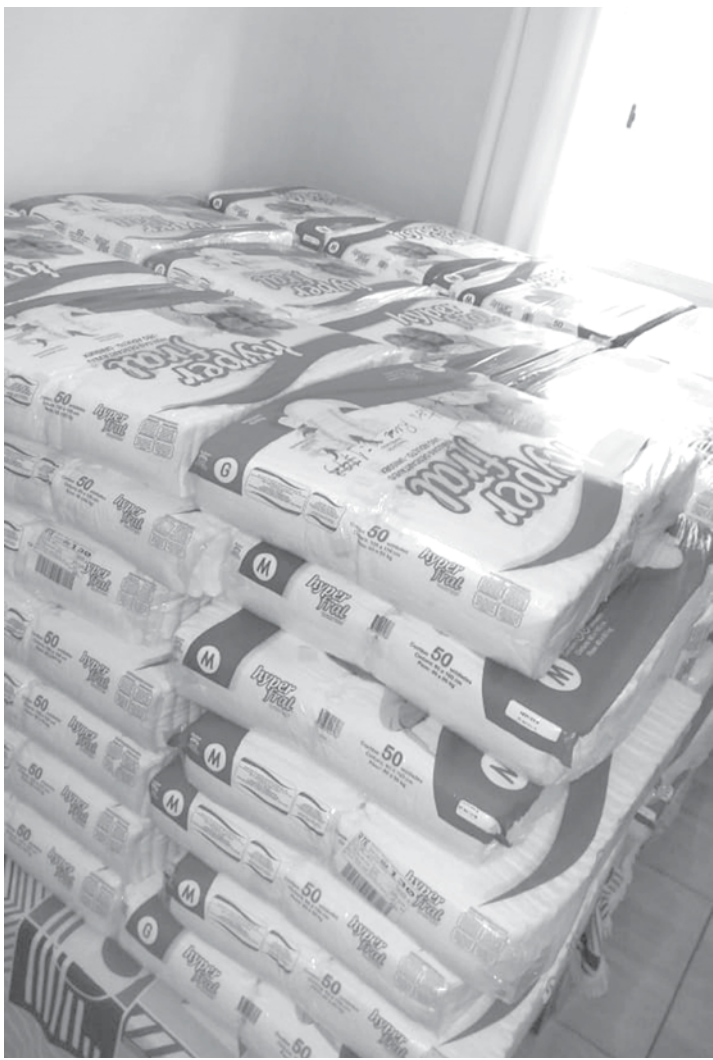
Mais de 5 mil fraldas foram arrecadadas até o momento

tório, Amigos e Solidariedade” e o ponto de coleta é a sede do próprio Cartório. “ Para a 2ª edição da campanha, já obtive sucesso em arrecadar considerada quantidade de fraldas geriátricas (5mil), que serão entregues ao abrigo juntamente com os demais donativos. Entendo que podemos e devemos transformar a sociedade em que vivemos e a vida das pes-