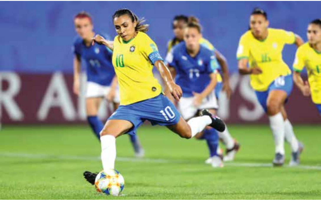
Ela foi a responsável pelo gol de pênalti do Brasil