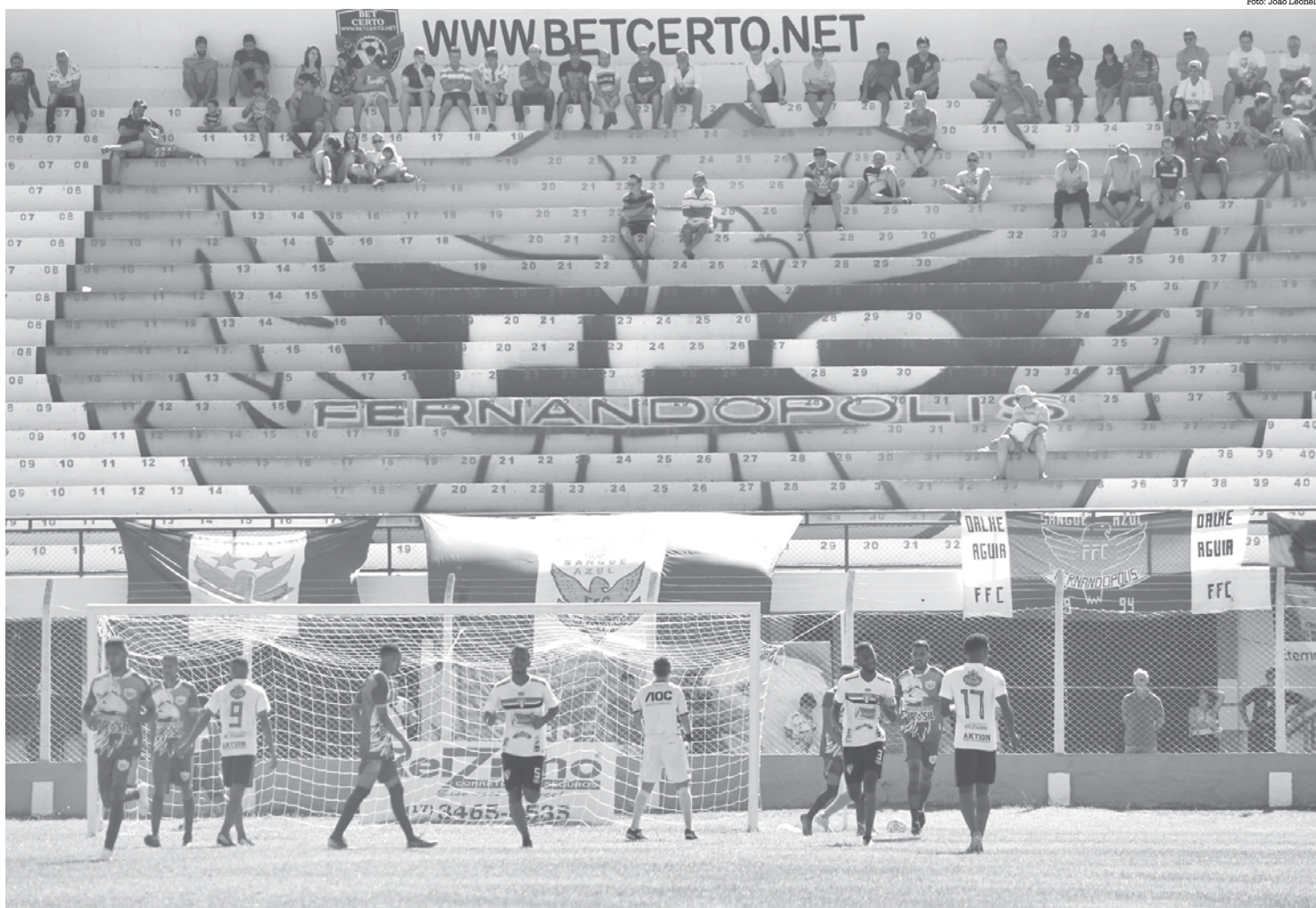
Partida entre Fefecê e Tupã aconteceu no estádio Cláudio Rodante, em Fernandópolis

Na última rodada da fase de classificação da Segundona, o Fernandópolis visita o Bandeirante, no domingo, às 10h, no estádio Pedro Marín Berbel, em Birigui. O Tupã encerrou a participação na primeira fase e folga na rodada.