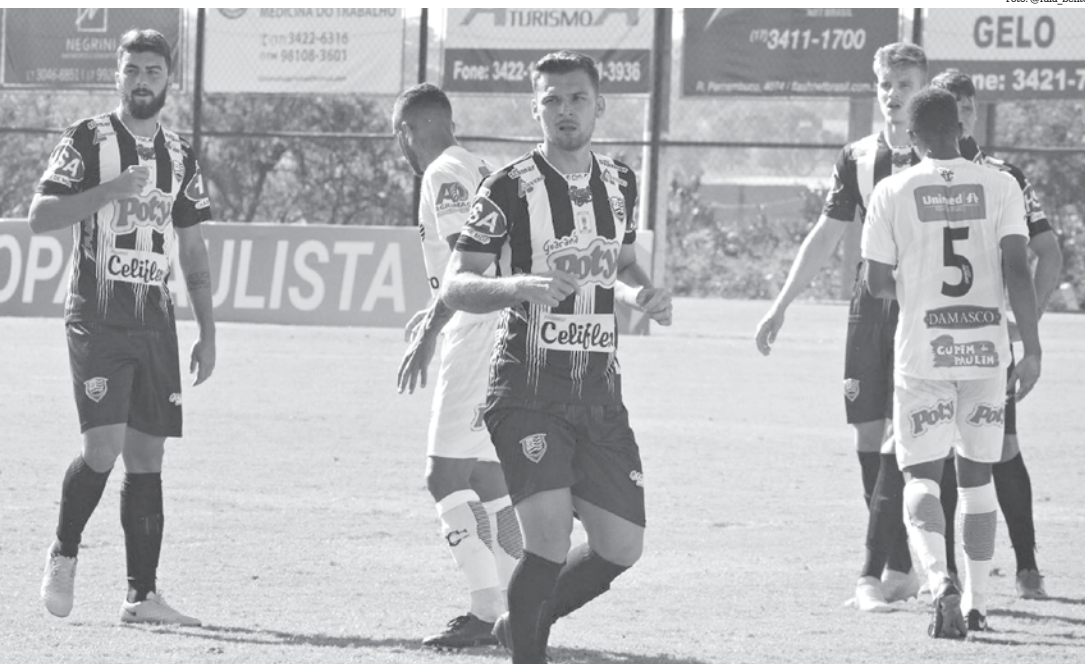
Votuporanguense x Comercial pela Copa Paulista 2019