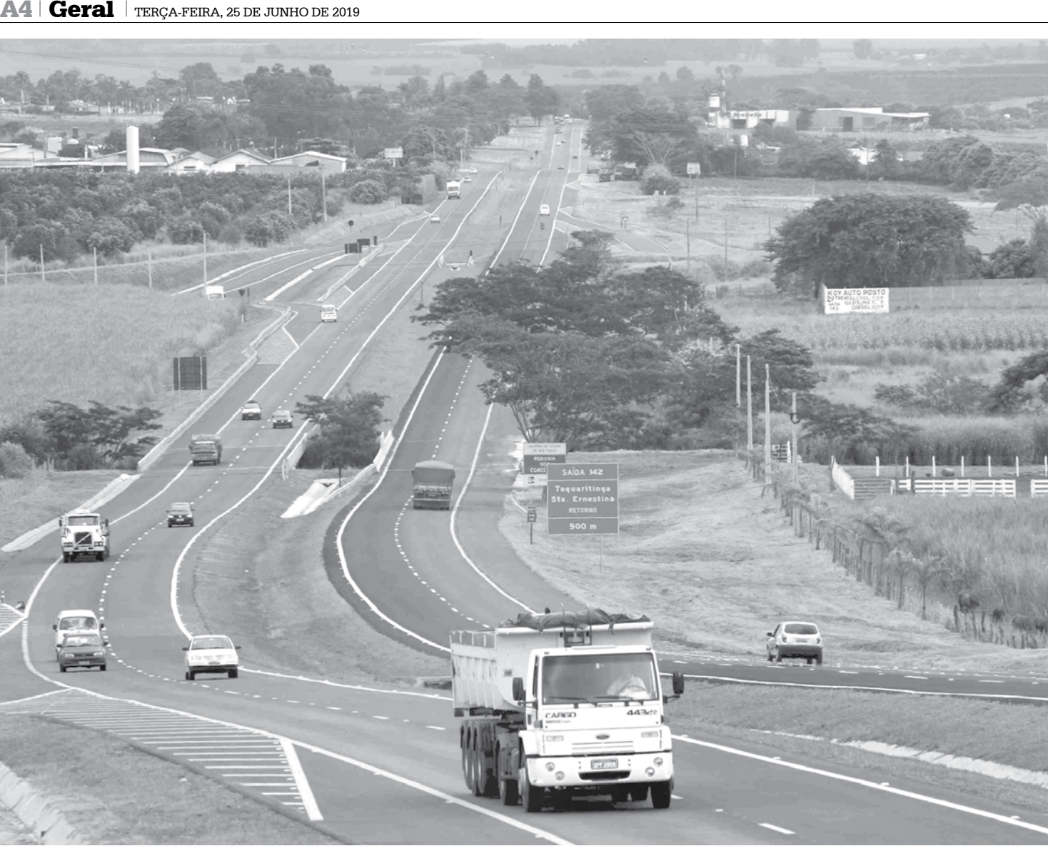
Número de vítimas leves, no entanto, cresceu 29,8%. Foram 355 em 2019 contra 265 em 2018