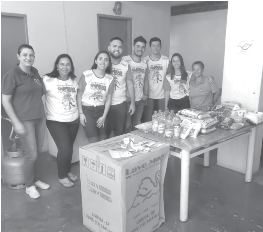
Entrega da arrecadação dos alimentos e de um tanquinho da festa junina de 2018