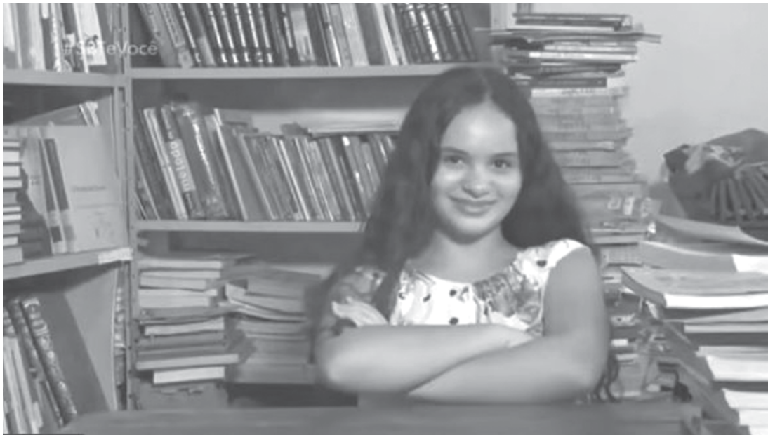
Jovem mora em Monte Aprazível

tro era feito em um papel. Quando um dos livros não é devolvido no dia marcado ela vai de bicicleta até a casa da pessoa para buscar a edição.