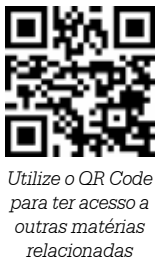
Utilize o QR Code para ter acesso a outras matérias relacionadas

Fernandópolis lamenta profundamente a fatalidade ocorrida e expressa seu pesar e solidariedade aos familiares. “Apesar dos esforços de nossa equipe de assistência à saúde, que promoveu todo o suporte médico e hospitalar necessário, não foi possível reversão de tal caso. Ao ser informada sobre o caso, a provedoria do Hospital está instaurando uma sindicância interna para o esclarecimento dos fatos”, diz nota.