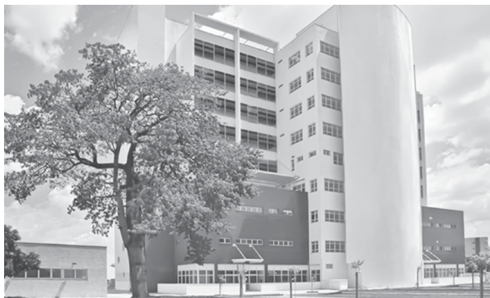
Após o parto, gêmeos foram levados para o Hospital da Criança e Maternidade de Rio Preto

gêmeas nasceram no HCM, morrendo no dia 30 de março. CASO RARO O nascimento de bebês com um único corpo e duas cabeças é fato raríssimo na literatura médica. De acordo com o médico Julio Leite, coordenador do Programa de Monitoramento de Defeitos Congênitos do Hospital de Clínicas da Universidade Federal do Rio Grande do Sul (UFRGS), casos como este podem ser chamado de gemelaridade imperfeita, quando há problemas na divisão das células durante o período de formação do embrião. “No Brasil o registro desse ti-