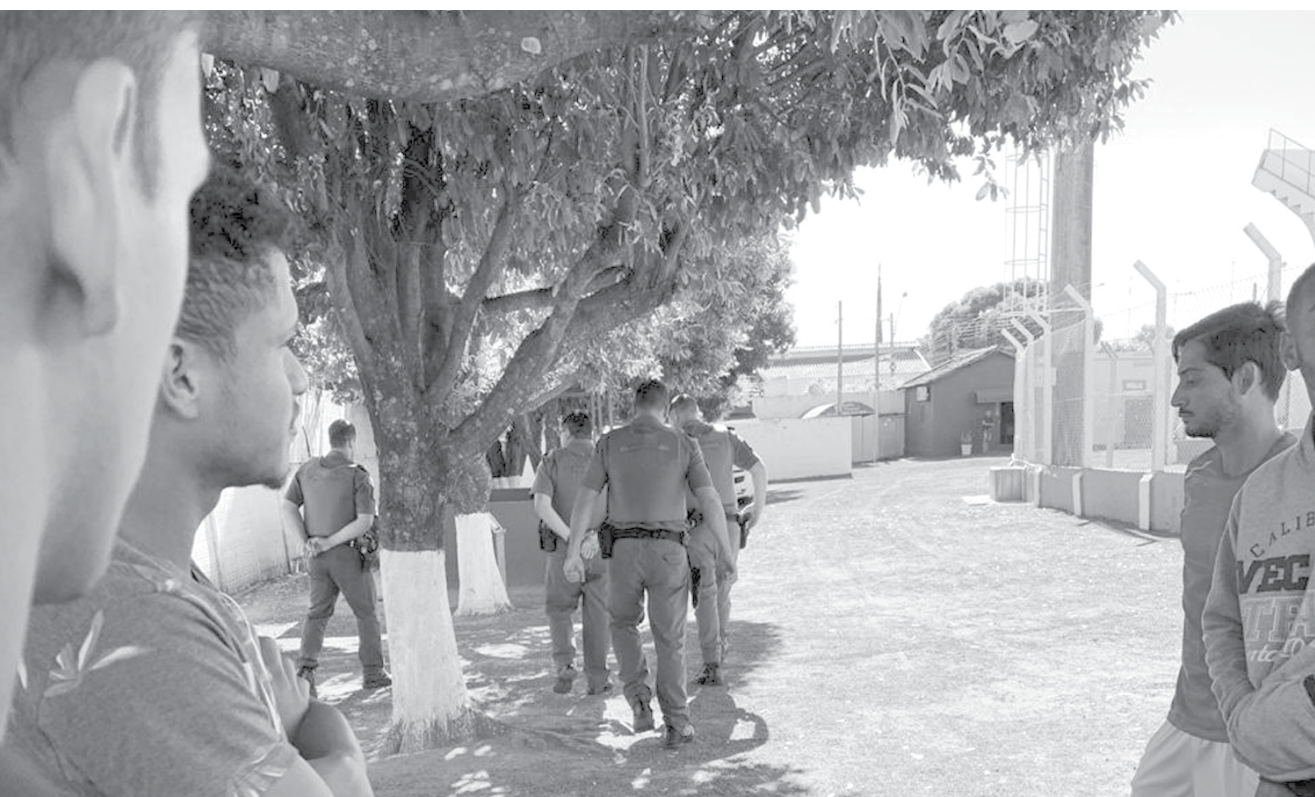
Polícia Militar compareceu ao estádio Cláudio Rodante para averiguar denúncia feita por atletas

No domingo, 30, a equipe encara o Bandeirante, no estádio Pedrão, em Birigui, pela última rodada da primeira fase. O Fefecê é líder do grupo e já está garantido na próxima fase.