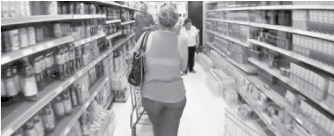
Esse foi o primeiro resultado positivo em 2019