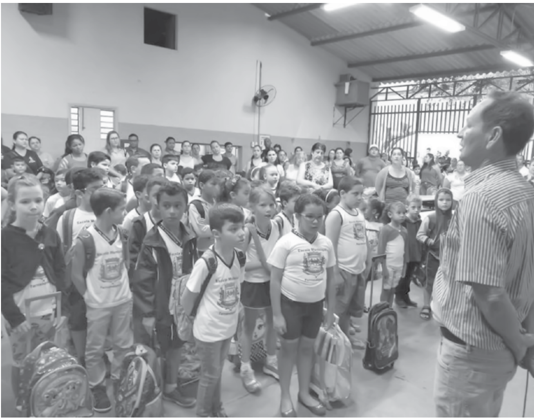
Aulas do segundo semestre começarão em 31 de julho

→ SECOM Prefeitura de Fernandópolis Finalizando o primeiro semestre de 2019 é chegado o momento de descanso para a garotada da rede municipal de Fernandópolis. A partir desta sexta-feira, 28, mais de seis mil alunos matriculados nas CEMEIS, EMEIS, EMEFIS e EMEFAs entram de férias escolares. Nessa época do ano muitas famílias aproveitam para viagens, passeios ou para o lazer das crianças que têm a pausa de um mês na rotina escolar. Mesmo durante o recesso, as unidades que oferecem atendimento em tempo integral permanecerão abertas normalmente para recepcionar as crianças que os pais trabalham, sendo elas: CEMEI Albertina Roza; CEMEI Maria Teresa Nicoletti; CEMEI Angelo Finoto; CEMEI Dayse Malavazzi; CEMEI Clivia P. M. Rosário; CEMEI João P. Zequinha; CEMEI Irma de Castro; CEMEI Aurea Baioni; CEMEI Miguel Risk; CEMEI Wilson Ferraz; CEMEI José Cardoso Tavares; CEMEI Américo Borin (Brasitania); CEMEI Benedicto Cunha; CEMEI Jose Zantedeschi; CEMEI Leontina Sardinha; CEMEI Sebastião Stroppa; CEMEI Antonio Mauricio.