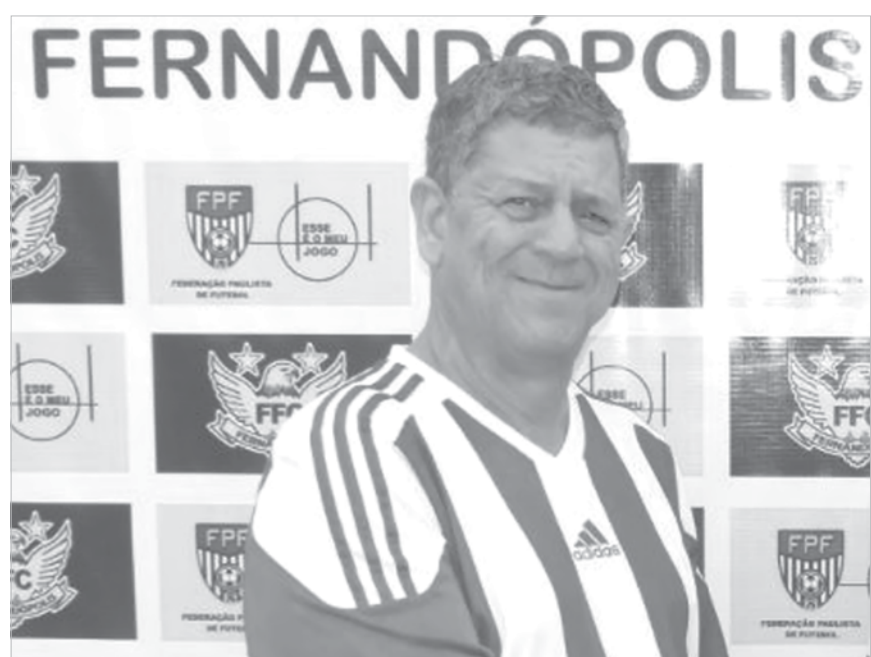
Presidente permanecerá, juntamente com toda a atual diretoria, no comando do time

Dentre outros pontos acordados estão o acerto dos salários atrasados (cerca de dois meses) de forma parcelada. Pelos lados dos jogadores, com a promessa da di-