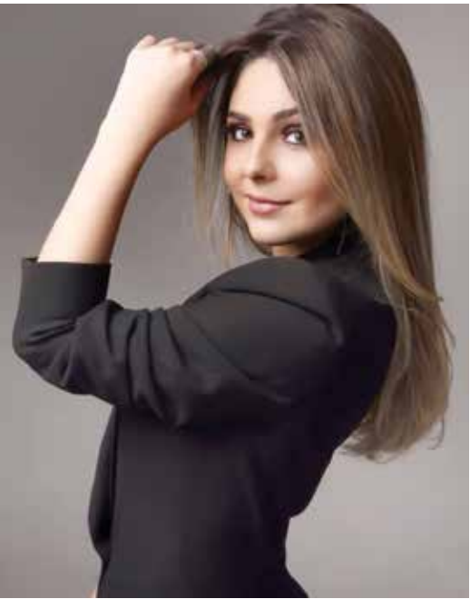
Atriz conheceu o namorado por meio de amigos em comum