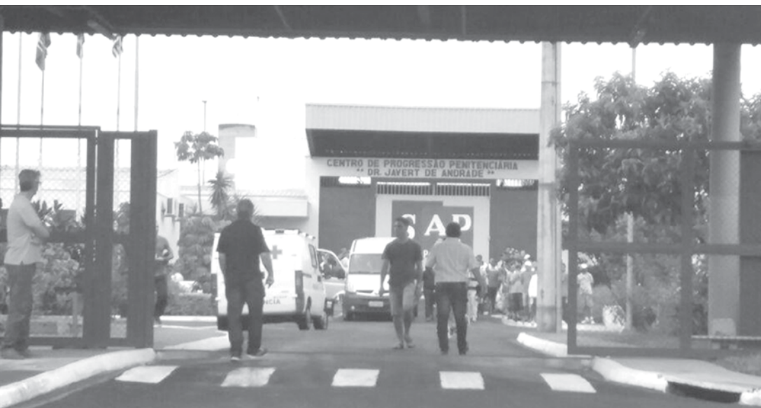
Eles terão até as 16h do próximo dia 3 para poder curtir as festas juninas