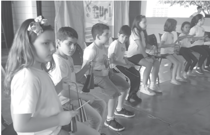
Projeto Guri é mantido pela Secretaria de Cultura e Economia Criativa do Estado de São Paulo em parceria com a Prefeitura

O projeto Guri é mantido pela Secretaria de Cultura e Economia Criativa do Estado de São Paulo em parceria com a Prefeitura de Fernandópolis. Nas aulas são trabalhados os mais variados gêneros musicais, desde canções populares e músicas folclóricas a composições eruditas. Além de apresentar aos alunos novos estilos de música e manifestações culturais, a variedade de repertório trabalhada nos polos mantém viva as raízes culturais da própria comunidade.