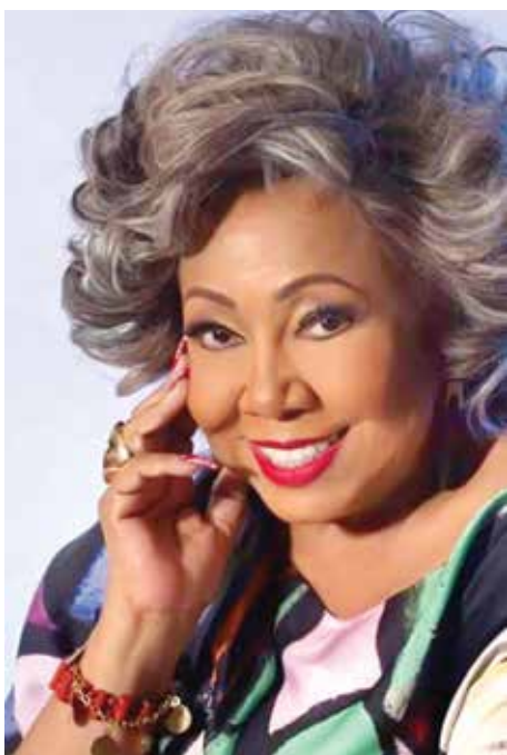
“Meu pai me ensinou a ser dona do meu próprio nariz”, conta ela

A cantora deu entrevista ao programa Band Mulher, sob o comando de Gardênia Cavalcanti e o assunto discorreu sobre a violência contra a mulher e os consequentes feminicídios no Brasil. “Nós vamos pedir a esse governo do Brasil e a todas as autoridades do país que socorram as mulheres que estão sendo espancadas, agredidas e mortas, e eu não estou vendo ninguém fazer nada”, dispara.