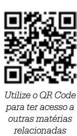
Utilize o QR Code para ter acesso a outras matérias relacionadas

que os impossibilite de comparecer pessoalmente ao Poupatempo devem apresentar atestado médico e requerimento específico solicitando o comparecimento do servidor público no local. DOCUMENTOS OBRIGATORIOS: • RG (Original) • CPF • COMPROVANTE DE RESIDÊNCIA (com menos de 60 dias)