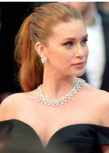
Marina teve sua conta invadida durante a madrugada de terça-feira