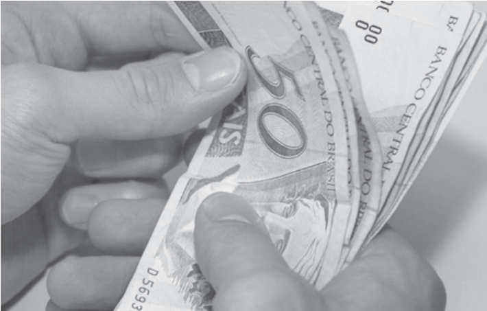
CNDL espera que a decisão do governo federal de liberar aos trabalhadores os saques de contas ativas e inativas do FGTS aqueça o setor de comércio e serviço

TS, anunciados nesta quarta (24), serão de até R$ 500 por conta. A expectativa é que 28 bilhões de reais estejam à disposição dos brasileiros a partir de setembro deste ano.