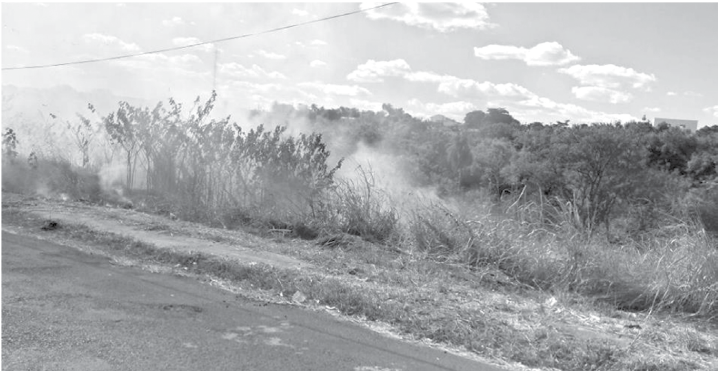
As multas para quem causa incêndio são graduadas de acordo com a gravidade do ato

O período de maior ocorrência de incêndios em vegetação fica entre os meses de junho e outubro, por conta do clima seco e os ventos frios. Por isso, é importante não queimar lixos, porque qualquer descuido pode ocasionar grandes queimadas. De acordo com o artigo 274