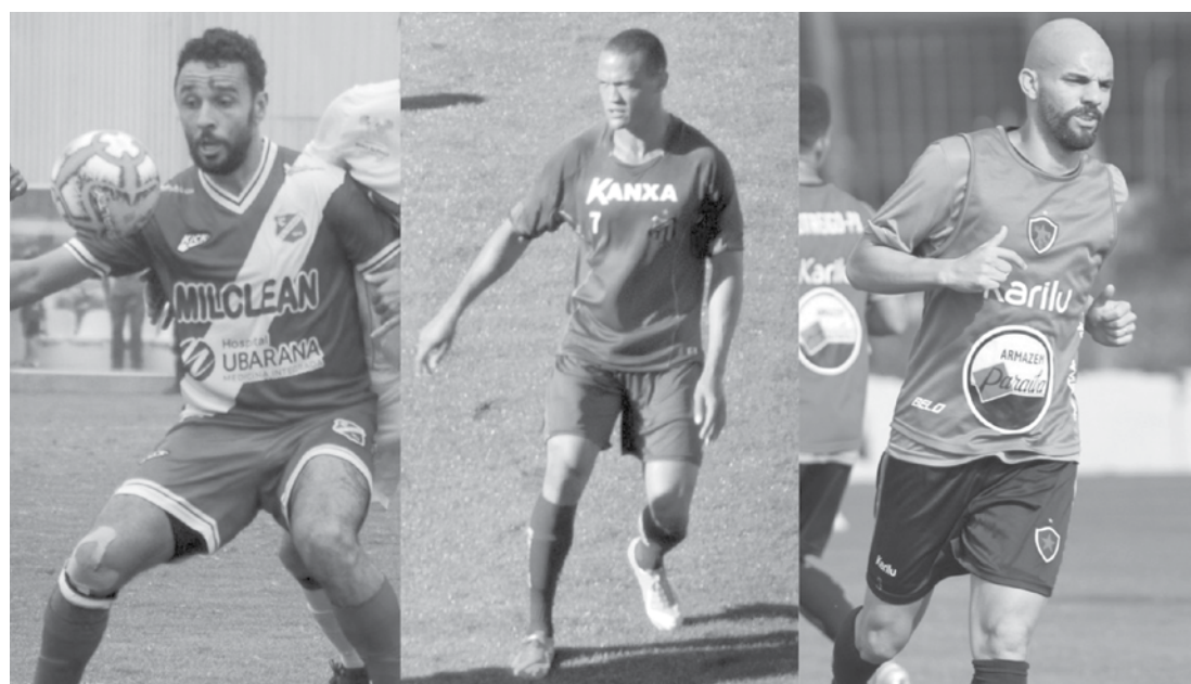
Jogadores reforçarão o CAV na Copa Paulista

O CAV está na quinta posição do Grupo 1, com apenas dois pontos conquistados em cinco jogos. A equipe ainda não venceu na competição, soma dois empates e três derrotas.