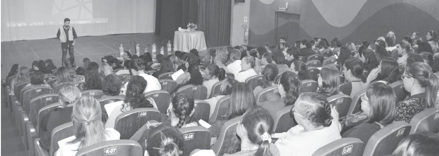
Evento sobre brigada de incêndio no Teatro Municipal

Utilize o QR Code para ter acesso a outras matérias relacionadas