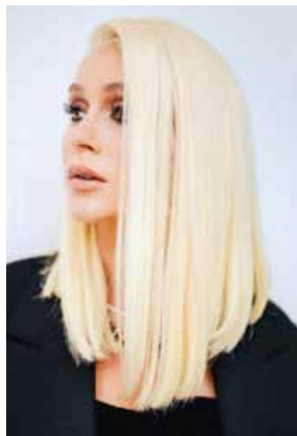
“Nunca tinha me visto loira platinada e gostei muito do resultado”, afirmou a artista

“Finalmente loira! Lembra que já tinha comentado com vocês minha vontade de platinar? Finally blonde”, escreveu a artista.