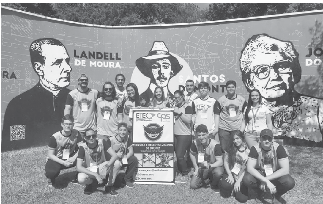
Competição aconteceu na Universidade Federal de Itajubá/MG