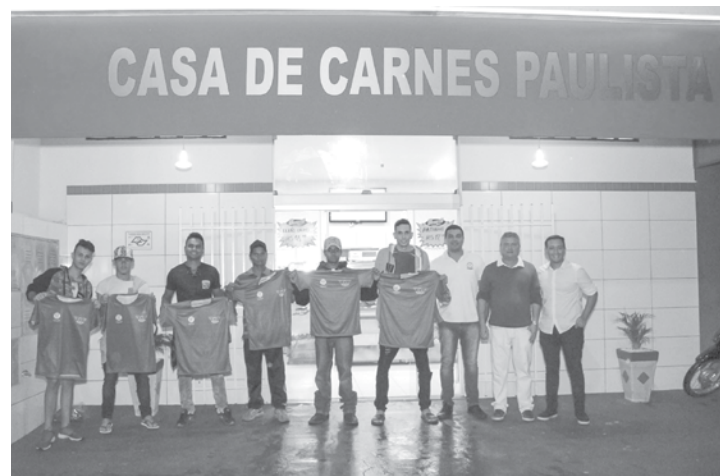
A entrega oficial dos uniformes aconteceu na Casa de Carnes Paulista