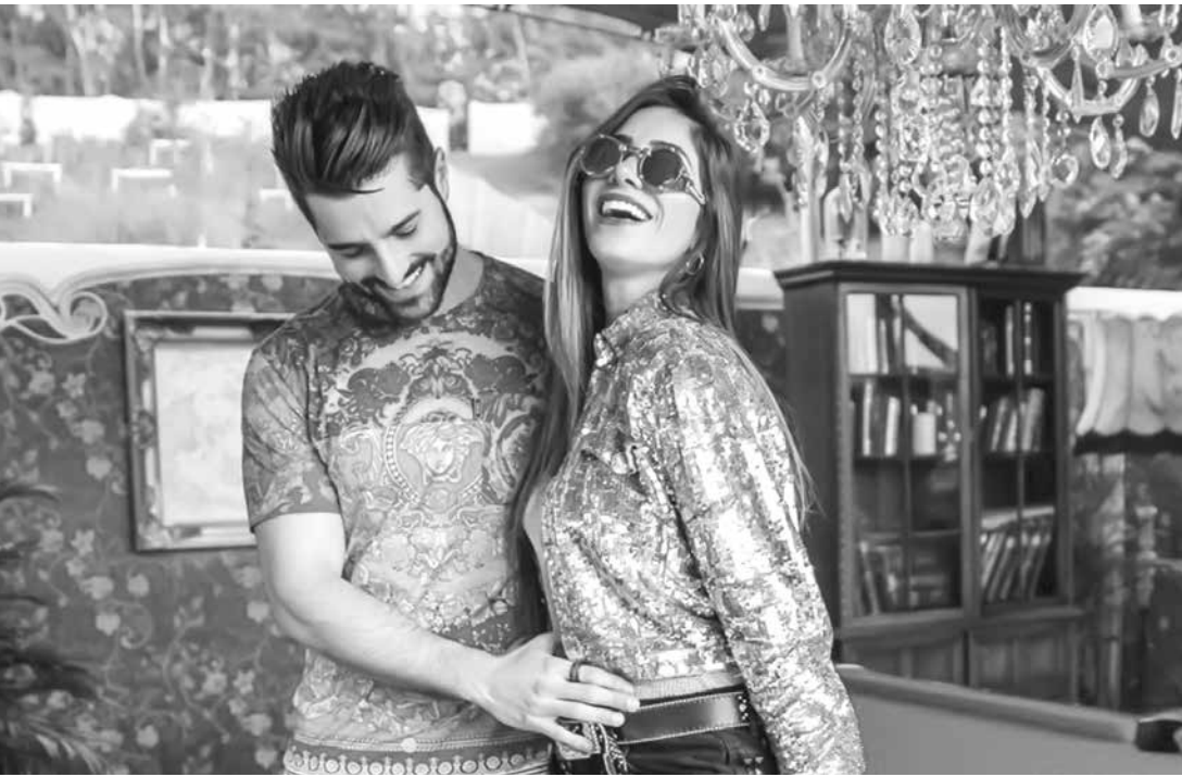
Eles serão papais de um menino