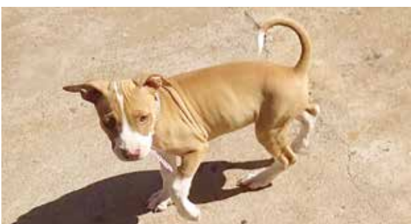
Meg foi pega de surpresa em um click pela mamãe Beatriz Cezarino