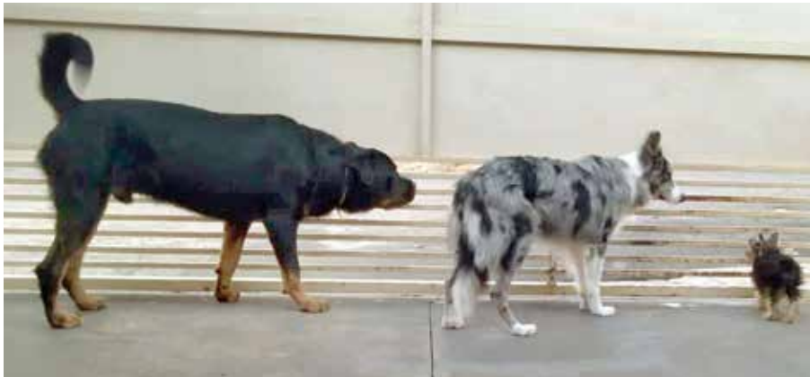
Logan, Dylan e Hulk observando o movimento da rua