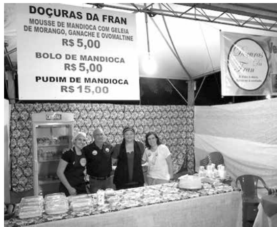
Evento aconteceu nos dias 09 e 10 de agosto