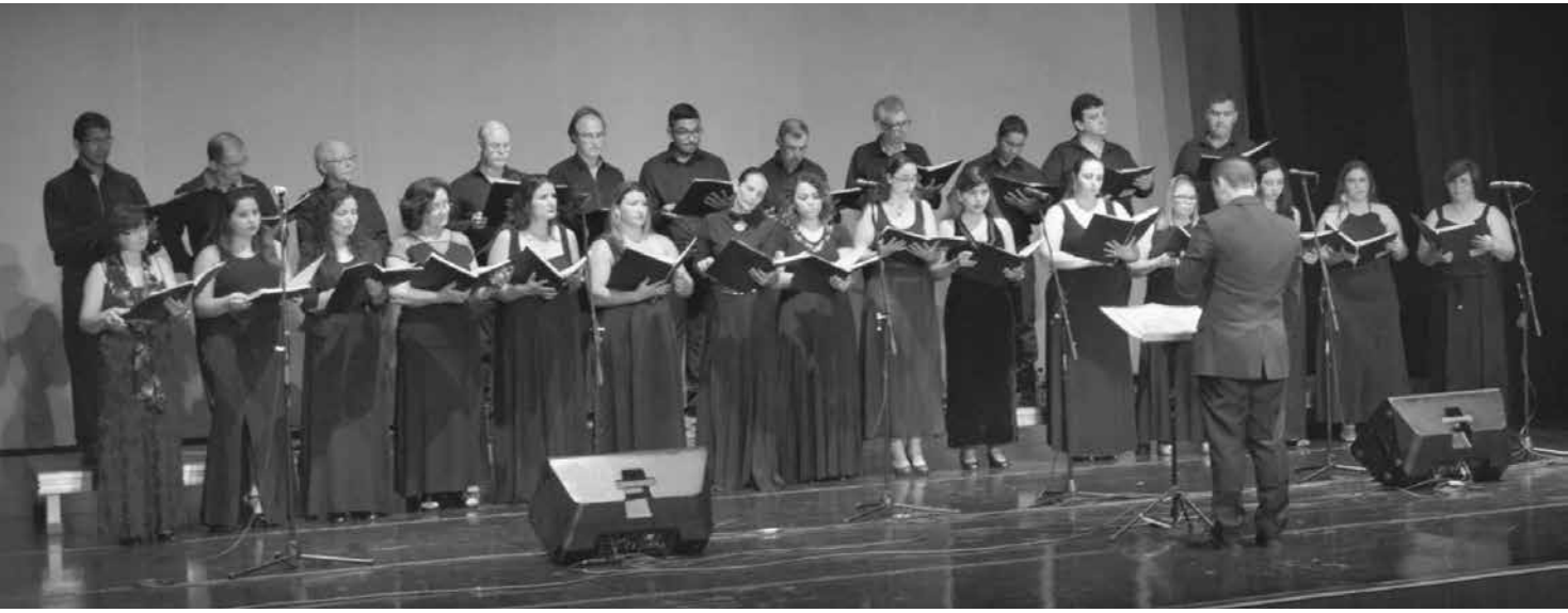
Coro Municipal de Fernandópolis