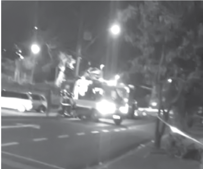
Incêndio em casa de repouso mobilizou Corpo de Bombeiros

Ele foi levado para delegacia onde permanece preso por homicídio tentado. A mulher foi transferida para o Hospital de Base da cidade, onde permanece internada. O quadro de saúde dela é estável.