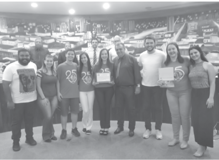
A aprovação do Projeto foi acompanhada por membros do Clube