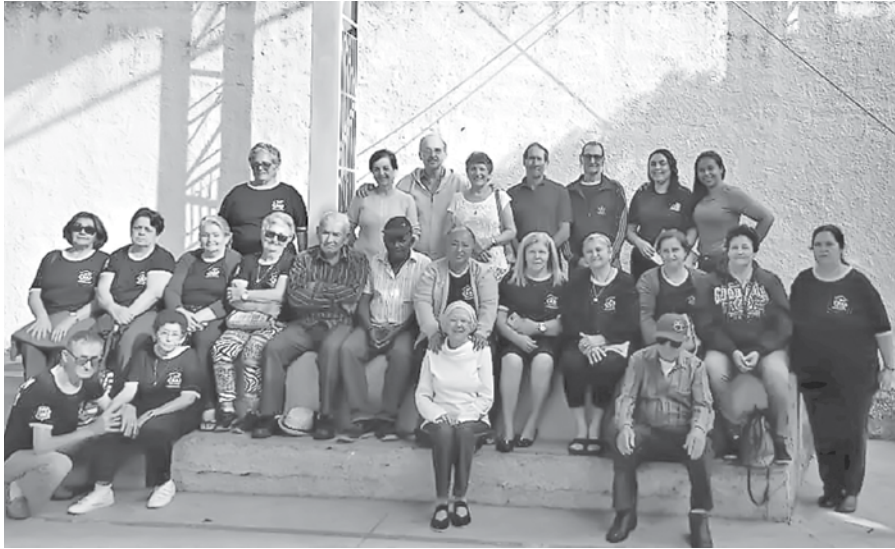
Visitantes do CRAS 'BEM VIVER'