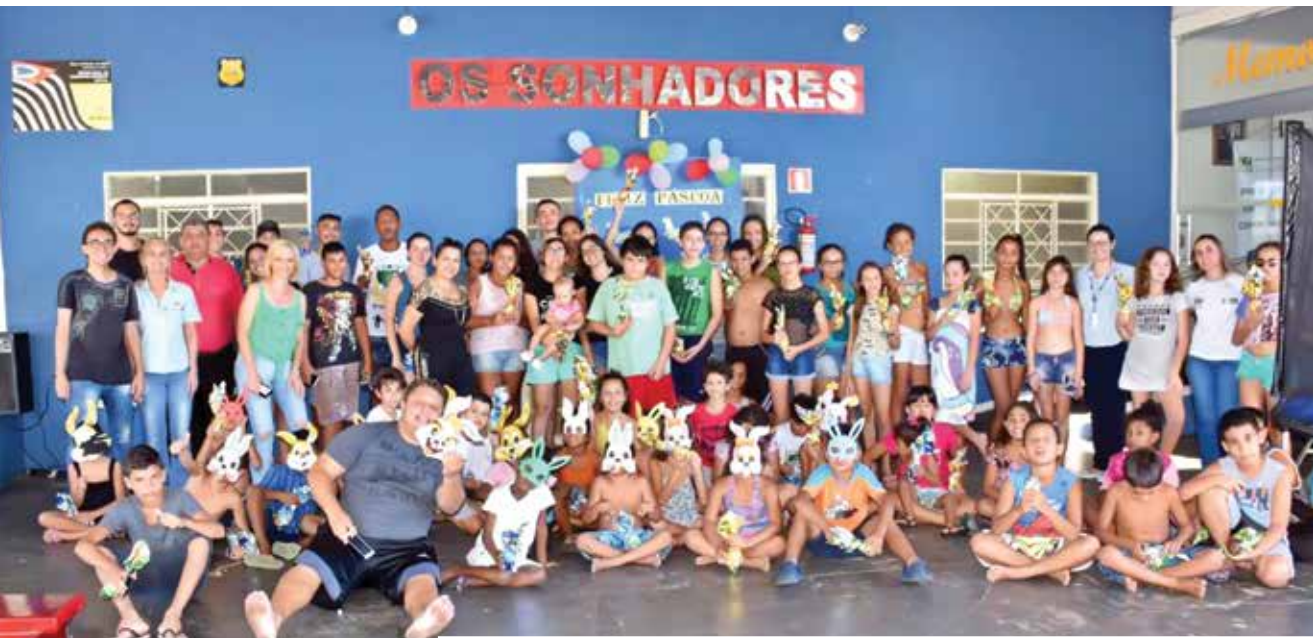
Nesta sexta-feira, dia 23, o Instituto de Desenvolvimento Pessoal e Social “OS SONHADORES” completa 18 anos. Parabéns!