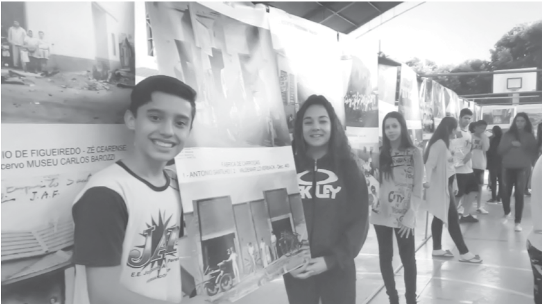
Alunos e professores do JAP observando a exposição

Utilize o QR Code para ter acesso a outras matérias relacionadas