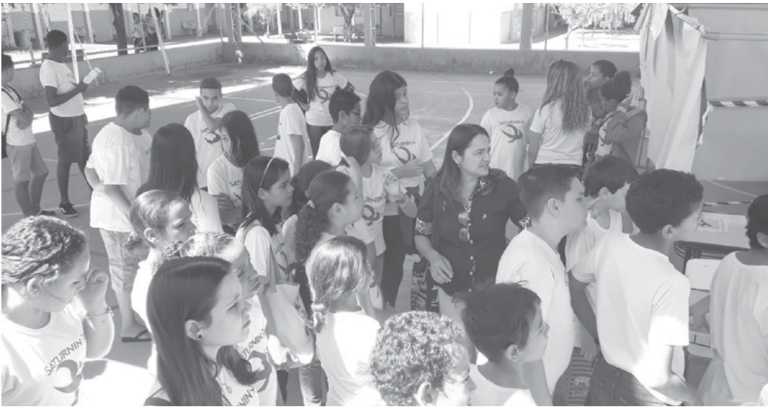
Visita de alunos e coordenadoras da escola Saturnino