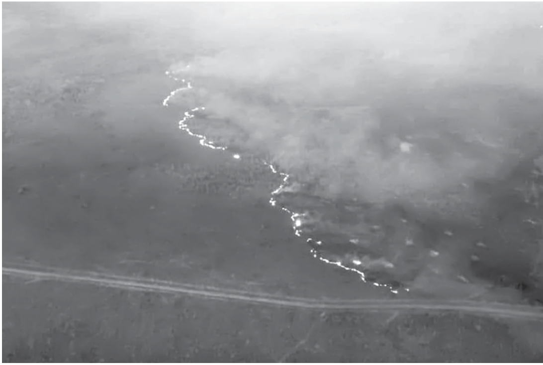
Incêndio em área de floresta em Rondônia

criminosos nessa área? E é criminoso, mas você não vai pegar quem está tacando fogo lá, só se for em flagrante”, disse. “É um indício fortíssimo de que são ONGs. Não se tem prova disso, se vocês não pegar em flagrante quem está queimando e buscar quem mandou”, acrescentou.