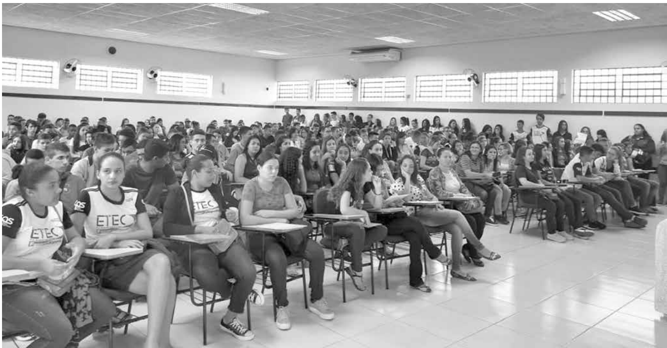
Mais de 400 adolescentes compareceram ao evento

evento, dentre eles, cerca de 50 adolescentes do município de Ouroeste, que foram sensibilizados, incentivados e acompanhados por representantes do CMDCA de Ouroeste, da Secretaria de Promoção