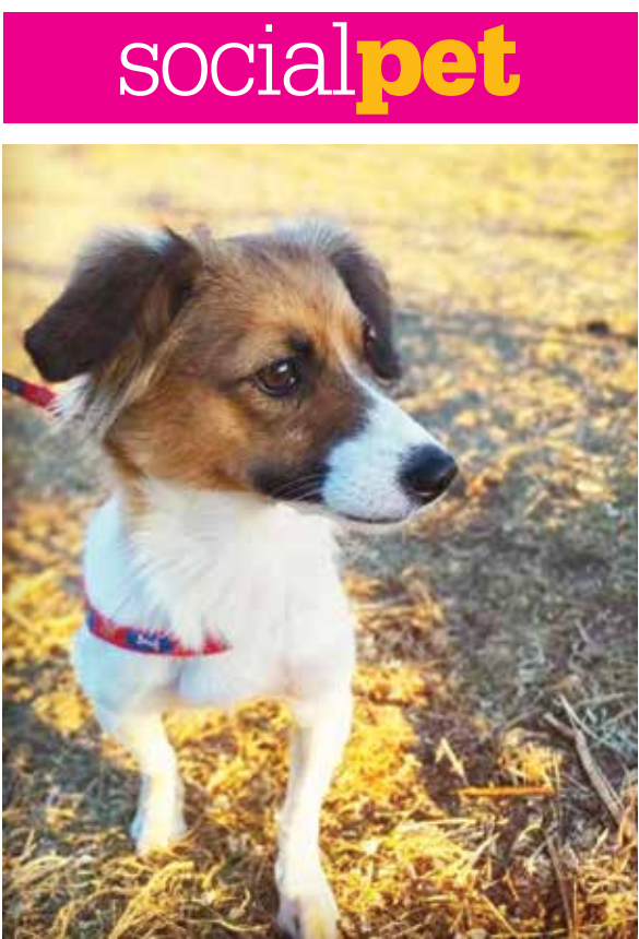
Amora em clima de descontração durante a tarde de passeio.