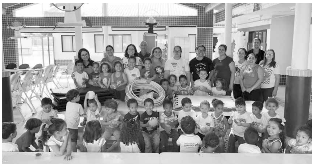
Ao todo, seis escolas da rede municipal de ensino receberam um kit de material esportivo