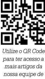
Utilize o QR Code para ter acesso a mais artigos da nossa equipe de articulistas

continua tendo vinte e quatro horas, uma hora sessenta minutos e um minuto ainda tem sessenta segundos. É o que eles dizem, porém não é o que sentimos. Há muito mais coisas entre o ser e o sentir do que pode imaginar nossa vã teoria. Sem qualquer drama ou liturgia, há muito menos horas entre o viver e o imaginar do que pode idealizar nossa vã alegoria. A crônica de nosso tempo é de uma crônica insuficiência de tempo, de uma falta que não dá para descrever, de uma crônica sem tempo para escrever, mas, se a leu até esta última linha, teve seu tempo e, quem sabe, sua vida não esteja assim tão crônica. PS – Por falta de tempo, repriso o texto. No pouco tempo não piso, nem tenho pretexto. Para alguns será original, para outros, tempo fatal. Inevitável, mas não letal. Ler ou reler, sempre será adicional.