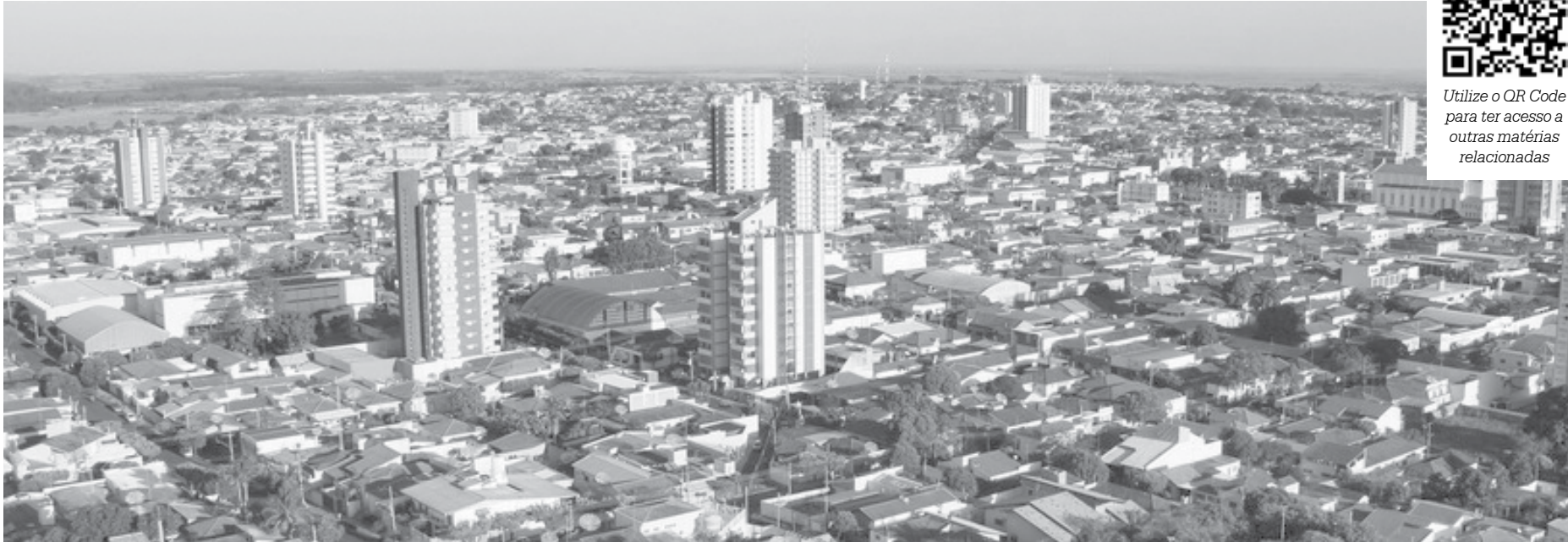
O município de Fernandópolis saltou de 68.120 para 69.116 habitantes

Os dados são do Instituto Brasileiro de Geografia e Estatística (IBGE). No grupo das cidades que encolheram, a que mais recuou em número absoluto foi Monte Azul Paulista. De 2017 para 2019, o município perdeu 226 habitantes e está com uma população estimada de 19.009 moradores. Em seguida aparece Palmeira D'Oeste. A cidade perdeu de 213 habitantes e fechou 2019 com 9.283.