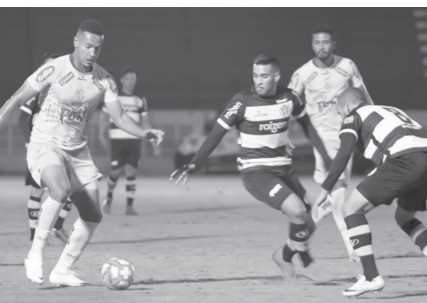
Partida foi realizada na noite deste domingo, em Mirassol

Leão Araraquarense recebeu o XV de Piracicaba, na noite deste domingo, e venceu por 2 a 0, assumindo a liderança do Grupo 6