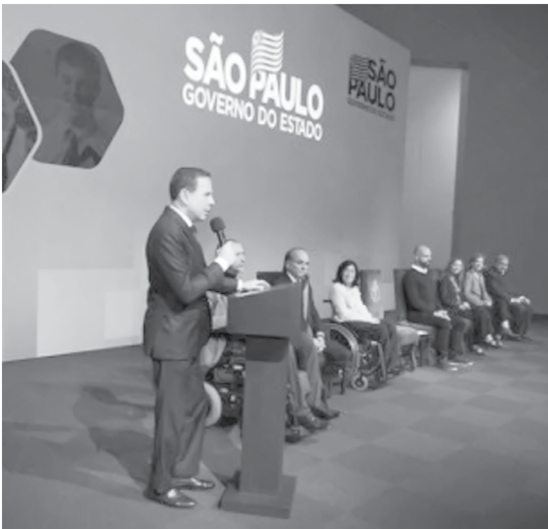
Programa “Meu Emprego - Trabalho Inclusivo”, foi lançado nesta segunda-feira

→ ASSESSORIA DE IMPRENSA Governo do Estado de São Paulo O Governador João Doria lançou nesta segunda-feira, 02, o programa “Meu Emprego - Trabalho Inclusivo”, que tem como objetivo promover o desenvolvimento profissional, a inclusão e permanência de pessoas com deficiência no mercado de trabalho, além de oferecer cursos de qualificação técnica e empreendedora. Por meio do Centro Paula Souza, da Secretaria de Desenvolvimento Econômico, serão oferecidas 17 mil vagas em 61 modalidades de cursos de qualificação profissional gratuitos para a pessoa com deficiência em todo Estado, em 2019. “O Estado de São Paulo tem 9 milhões de pessoas com deficiência. Então é nossa obrigação estabelecer um programa vigoroso para ampliar a empregabilidade delas. Este é um programa inédito no Estado de São Paulo e o seu objetivo é, melhorando a qualificação, viabilizar uma empregabilidade de qualidade”, disse Doria. Além de qualificação, a iniciativa possibilita mapeamento do perfil e habilidades funcionais, identificação de oportunidades de trabalho, compatibilização de vagas e laudo médico. O programa também apoia os empregadores na busca ativa na captação de candi-