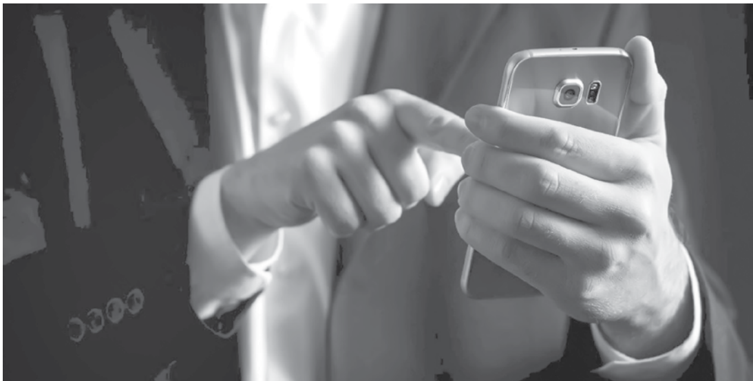
Nem todos os pré-pagos estão desatualizados

Nem todos os pré-pagos estão desatualizados. As operadoras avisarão quem precisa realizar o proces-