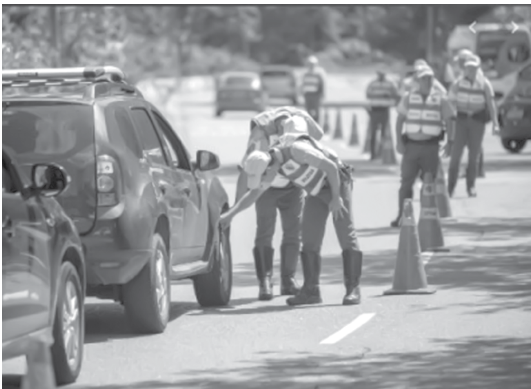
A operação contou com a mobilização de 19.326 policiais militares

A operação contou com a mobilização de 19.326 policiais militares, além do emprego de 8.179 viaturas e dez helicópteros, distribuídos em 1.685 pontos. As equipes ficaram em locais estratégicos, apontados pelo serviço de inteligência da PM, para sufocar possíveis ações de criminosos.