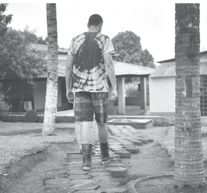
Atualmente, a iniciativa tem uma abrangência de 650 mil beneficiários

O 3º Levantamento Nacional sobre o Uso de Drogas pela População Brasileira, elaborado por pesquisadores da Fundação Oswaldo Cruz (Fiocruz), indicou que 7,7% dos brasileiros de 12 a 65 anos já consumiram maconha ao menos uma vez na vida e 3,1% experimentaram cocaína. Além disso, a pesquisa, que ouviu cerca de 17 mil pessoas, revelou que 0,9% da população brasileira já fez uso de crack e similares.