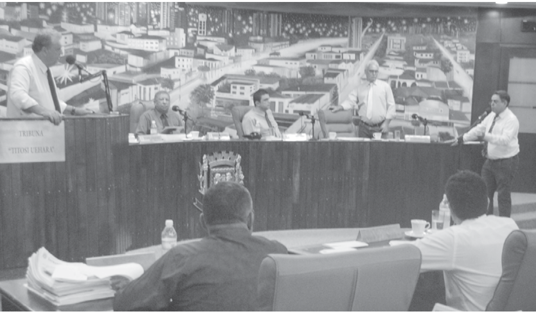
Sessão foi realizada na terça-feira, 3