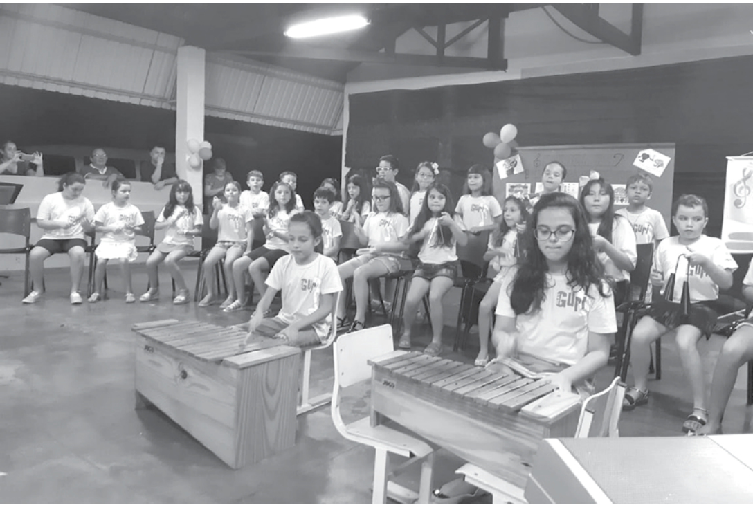
O Projeto Guri é considerado o maior programa sociocultural brasileiro

sendo reconhecido com a conquista de diversos prêmios ao redor do mundo. Desenvolve nas crianças a excelência matemática e habilidades para resolver problemas através de interações divertidas e lúdicas. Recomendado por professores e diretores ao redor do mundo, o Matific é considerado um aplicativo de excelência no desenvolvimento da intuição científica e matemática no ensino fundamental das crianças.