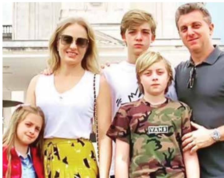
Acidente aconteceu em maio de 2015