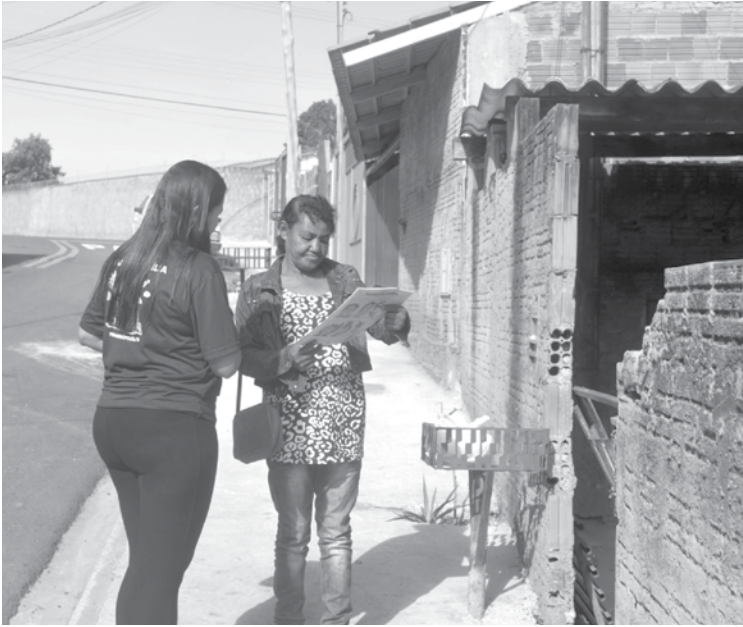
Objetivo foi o de promover ações que valorizem as famílias em sua função protetiva

O CRAS IV - Nova Era, por meio da Secretaria Municipal de Assistência Social e Cidadania realizou na última semana a campanha ‘Semana da Família’ em Fernandópolis. O objetivo foi o de promover ações que valorizem as famílias em sua função protetiva, através de atividades de integração e mobilização no território. As ações tiveram início no dia 26, com uma roda de conversa sobre “Os desafios do convívio familiar” e uma gincana interativa entre adultos e crianças. Foram distribuídos brinquedos, pipoca e algodão doce. No dia 27 houve mobilização no bairro Ipanema para divulgação de serviços e direitos, e sensibiliza-