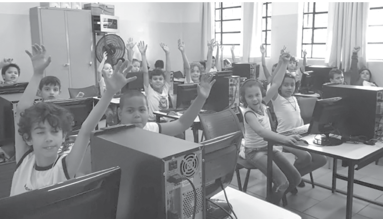
Alunos do Coronel participando da MATIFIC

Escola Municipal de Fernandópolis conquistou a melhor pontuação do Brasil e receberá a maior premiação da olimpíada