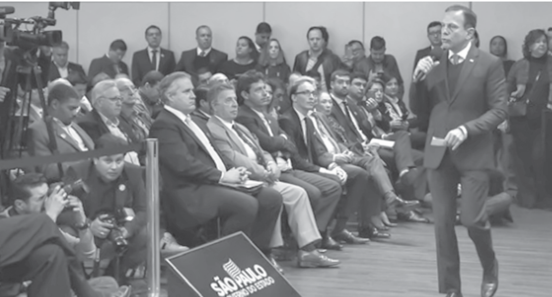
Doria discursa durante o evento: R$ 120 milhões para o turismo