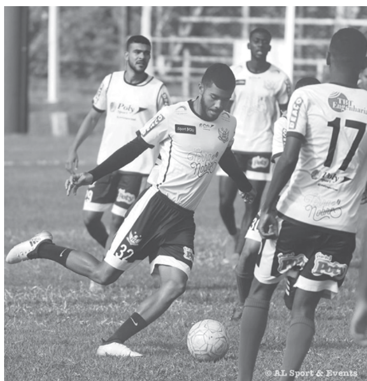
Jogadores do Fefecê durante treinamento no estádio Cláudio Rodante

Mesmo com todos os problemas extracampo que aconteceram durante a semana com os mandatários da