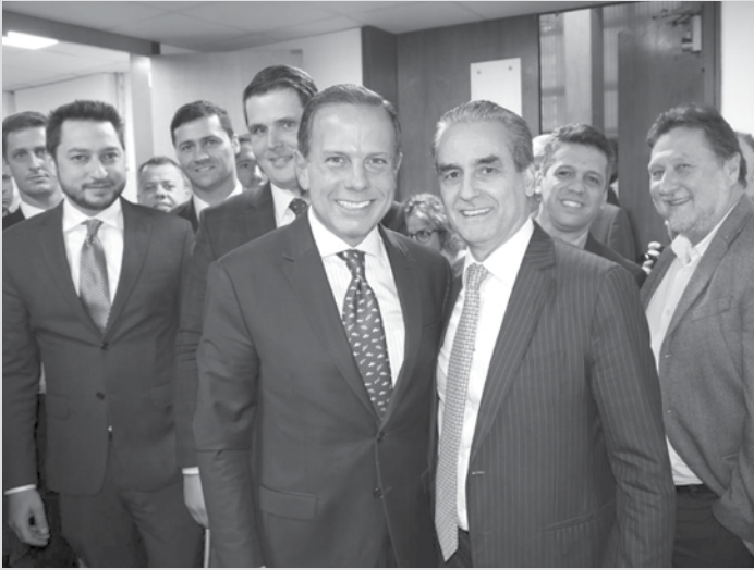
Gimenes com Doria e a cúpula do governo estadual

Após ficar de fora de várias distribuições de recursos para a região, Fernandópolis está inclusa nesse rol recebendo R$ 594 mil para a construção de um novo palco na praça central. Ele vai permitir a apresentação de corais, orquestras e outros artistas, transformando o local em um ponto turístico da cidade. Fernandópolis é considerado Município de Interesse Turístico-MIT graças ao Projeto de Lei 398/17, encampado pelo então deputado estadual Gilmar Gimenes-PSDB, aprovado na Assembleia Legislativa do Estado. A classificação como MIT possibilita que a cidade receba, inicialmente, cerca de R$ 550 mil todos os anos do governo do Estado para investir em infraestrutura tu-