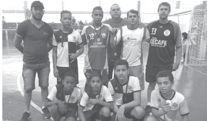
Na Sub-14 e Sub-16 houve dobradinha com as equipes de Guarani