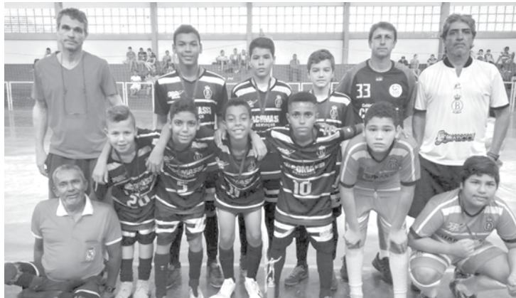
Na categoria Sub-12, a equipe Real Bagi sagrou-se campeã