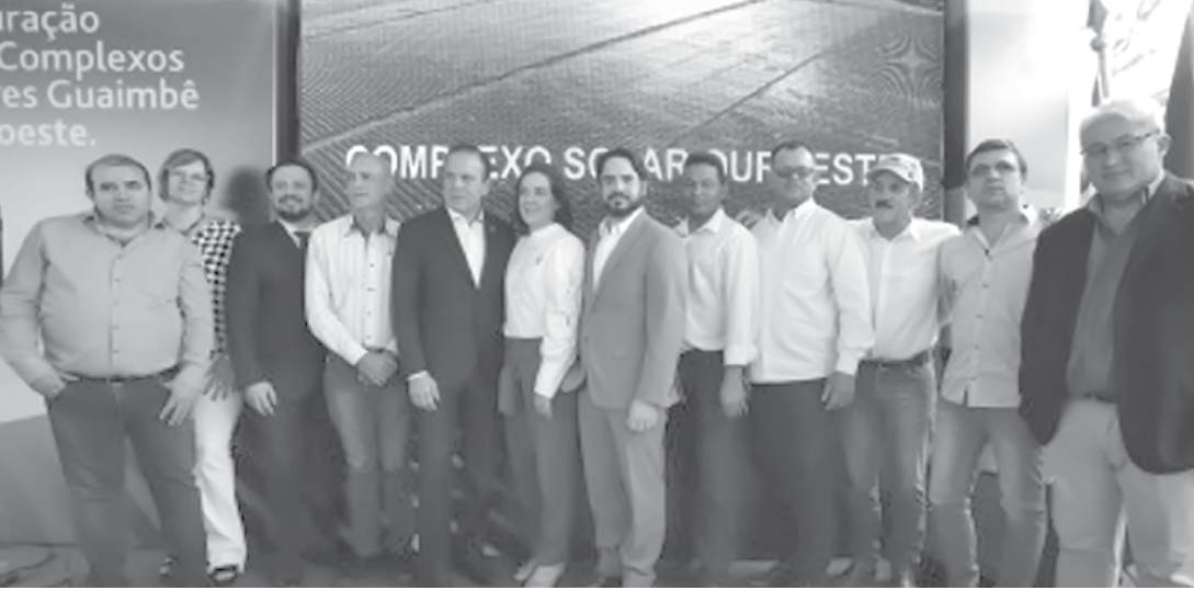
Políticos ouroestense junto ao governador Doria em recente inauguração em Bauru

nalização Vertical – Informática e Turística; Paulo de Faria R$ 594 mil para reforma e ampliação da Praia Artificial Municipal Luiz Ribeiro de Castro; Sales R$ 103 mil para valorização Turística e Revitalização da Praça Matriz – Etapa II; Ubarana R$ 594 mil para revitalização do Centro de Lazer “Gentil Moreira” – Prainha Municipal; Sud Mennucci R$ 267 mil para revitalização e modernização da Avenida São Paulo; Novo Horizonte R$ 191 mil para adequação e Buritama R$ 550 mil para revitalização de um Portal.