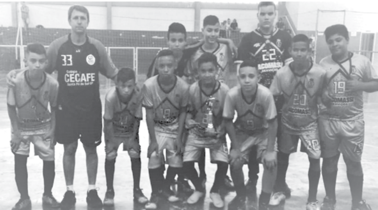
Na categoria Sub-10, a equipe Meninos de Ouro venceu o quadrangular