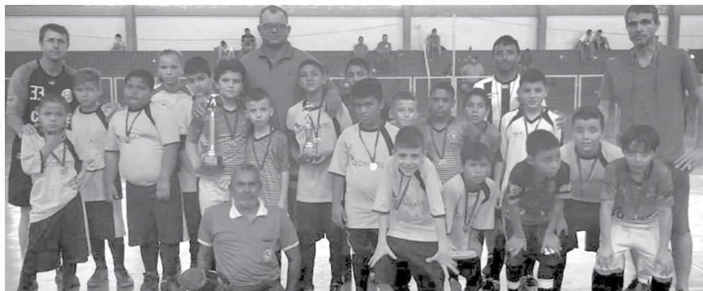
Na categoria Sub-8 a equipe de Arabá conquistou o título

Desta vez promoveu o I Quadrangular de Futsal Regional em Arabá, que reuniu a participação de quatro equipes da região: Guarani D'Oeste, Real Bagi, Meninos de Ouro e Arabá, contando com 5 categorias: Sub-8, Sub-10, Sub-12, Sub-14 e Sub-16. O campeonato movimentou a Quadra Poliesportiva Maria Aparecida Mota em Arabá.