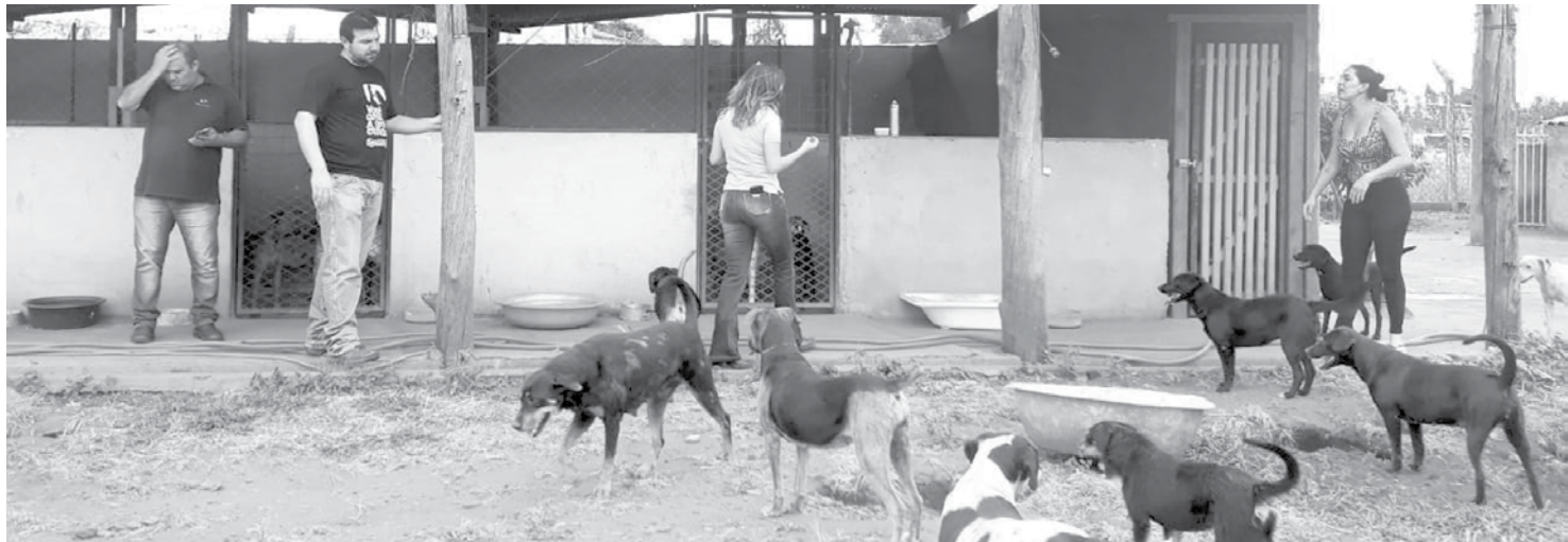
As cirurgias são realizadas na própria Unidade de Controle de Zoonoses

É necessário desmitificar os mitos das castrações de que os animais ganham pe-