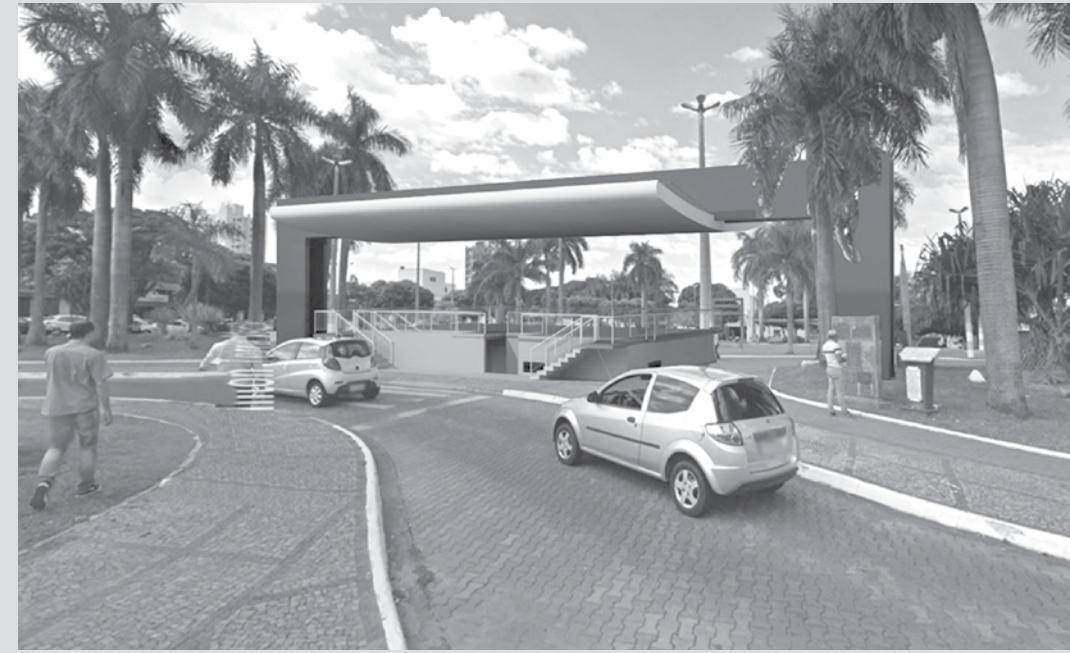
Projeção do novo palco na praça central

prolongamento da marginal da Avenida Luís Brambati, saindo da cervejaria, passando pela empresa do Orati e Elektro, chegando à rodovia Percy Waldir Semeghini, que também foi recuperada por sua indicação, numa obra de R$ 29 milhões, dentre outros recursos.