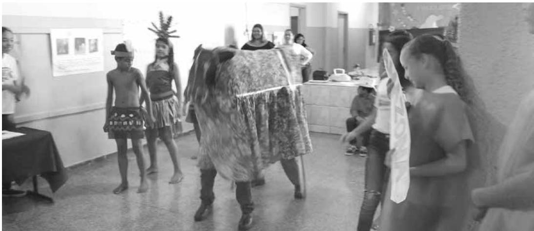
Os alunos desenvolveram algumas apresentações durante a semana

funcionários e alunos se envolveram no projeto com muito carinho e dedicação, contando também com a participação da senhora Nilzete Castro que preparou a tapioca para toda escola. Foram servidos lanches e comidas típicas de diversas regiões brasileiras para que os alu-