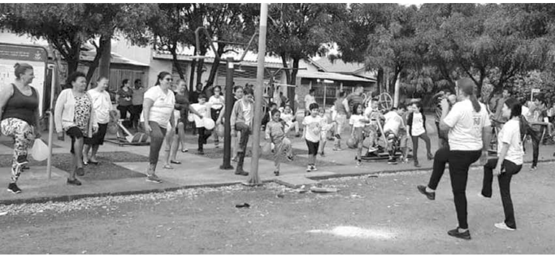
Esses grupos são uma estratégia da atenção básica para tornar a população mais ativa