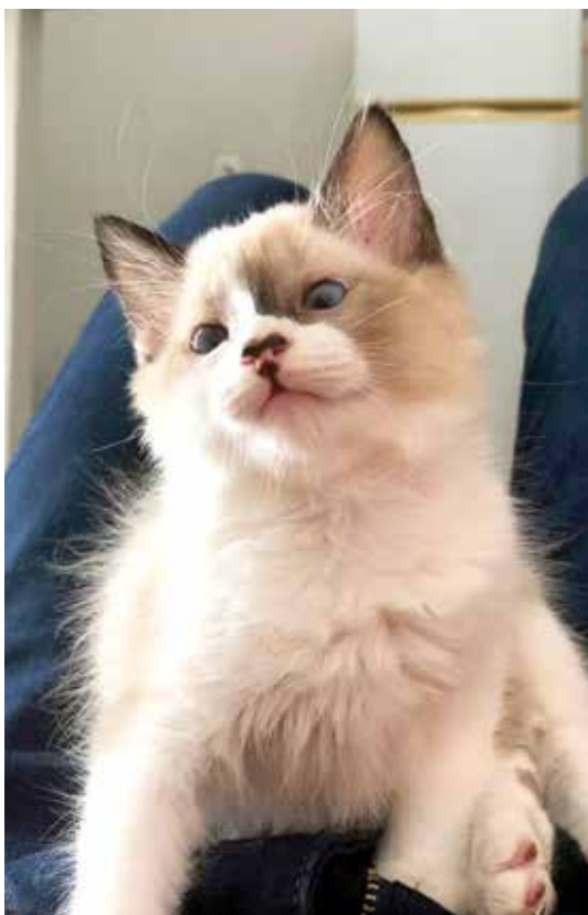
Ohana fazendo pose fofa para a foto.