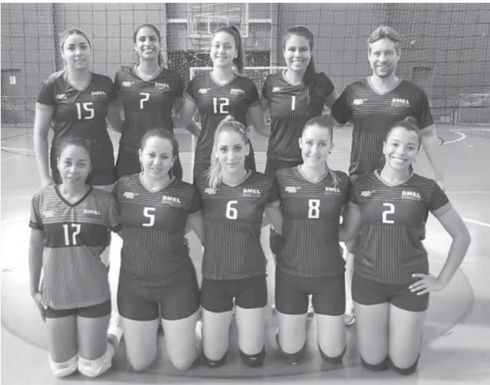
Equipe de vôlei feminino segue na liderança

de Fernandópolis se deu bem. Jogando fora de casa pela Copa Regional, promo-