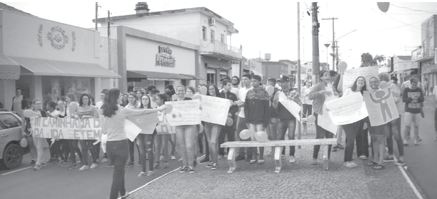
As atividades iniciaram com uma caminhada com os alunos da escola estadual “Cícero Usberti” e profissionais da saúde