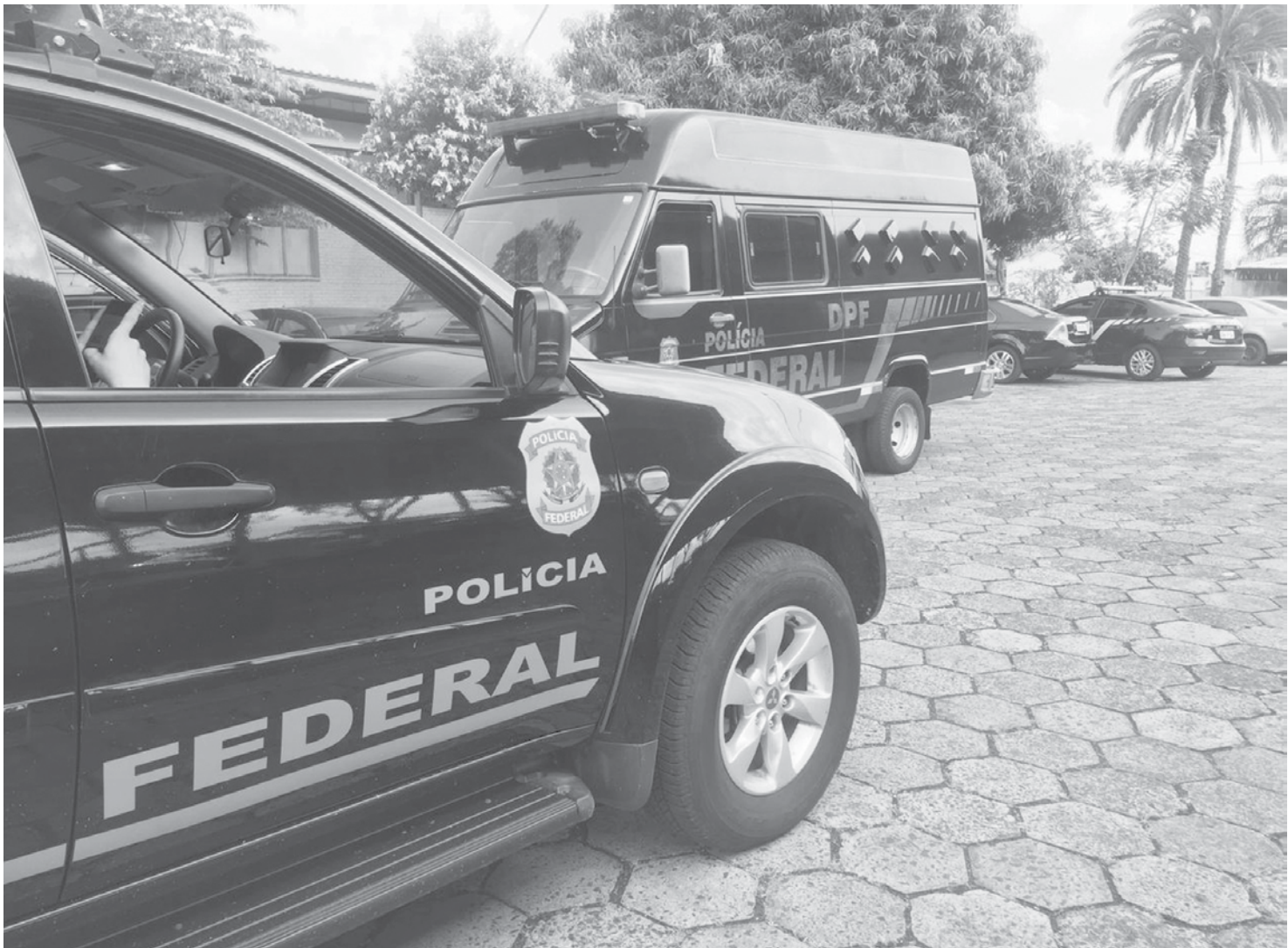
PF deflagra operação contra desvio de verba do Fies e Prouni em Fernandópolis

→ Da REDAÇÃO contato@oextra.net A Justiça Federal prorrogou por mais 5 dias a prisão de 11 suspeitos envolvidos em fraude contra programas federais de bolsas de estudo Fies e Prouni durante a Operação Vagatomia, realizada na última terça-feira, 3, pela Polícia Federal de Jales. A operação também investiga suspeitos de participarem de um esquema de fraude na comercialização de vagas e transferências de alunos do exterior, principalmente Paraguai e Bolívia, para o curso de Medicina em Fernandópolis. Outras 11 pessoas continuam com as prisões preventivas decretadas. Dois investigados seguem foragidos. Na última sexta-feira, 6, um dos cofres apreendidos na residência de um dos investigados foi aberto e relógios de luxo, joias e dólares foram localizados e apreendidos. Estimativas da Polícia Federal indicam que, nos últimos cinco anos, aproximadamente R$ 500 milhões do Fies e Prouni foram concedidos fraudulentamente. De acordo com a PF, o dono da Universidade Brasil, José Fernando Pinto Costa, de 63 anos, e o filho dele, também usavam o dinheiro desviado