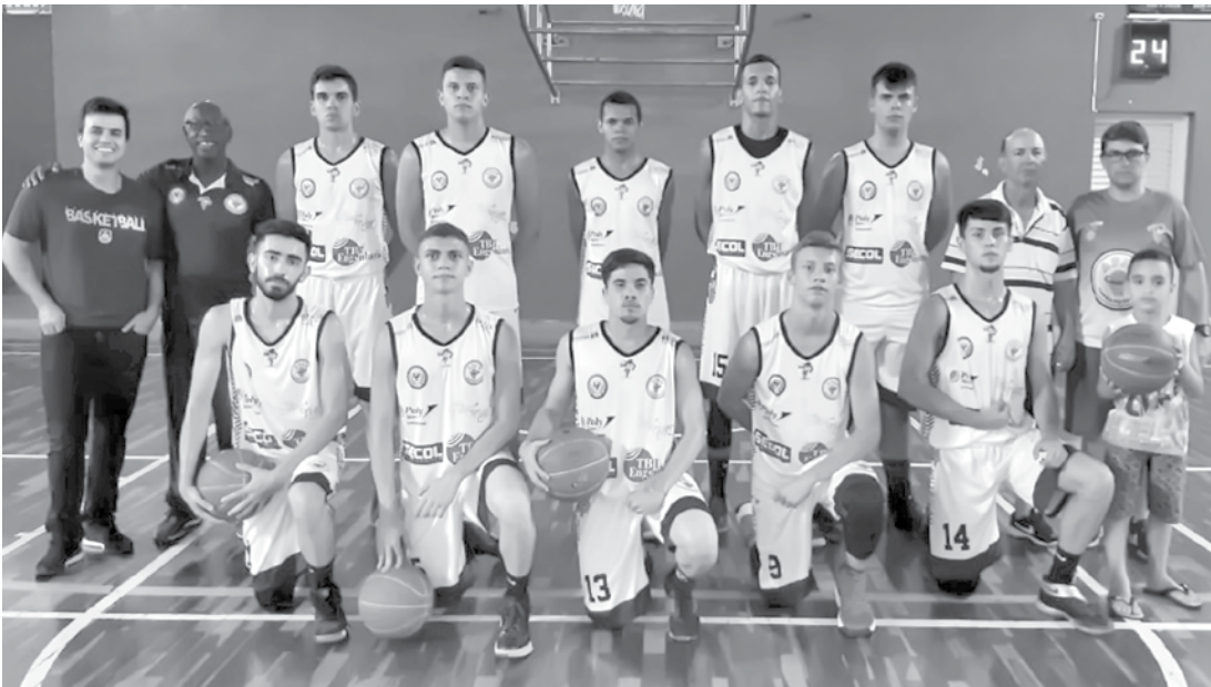
A equipe de basquete segue invicta com 9 jogos e 9 vitórias

te Líbano na cidade de Rio Preto contra a equipe Candanduva.