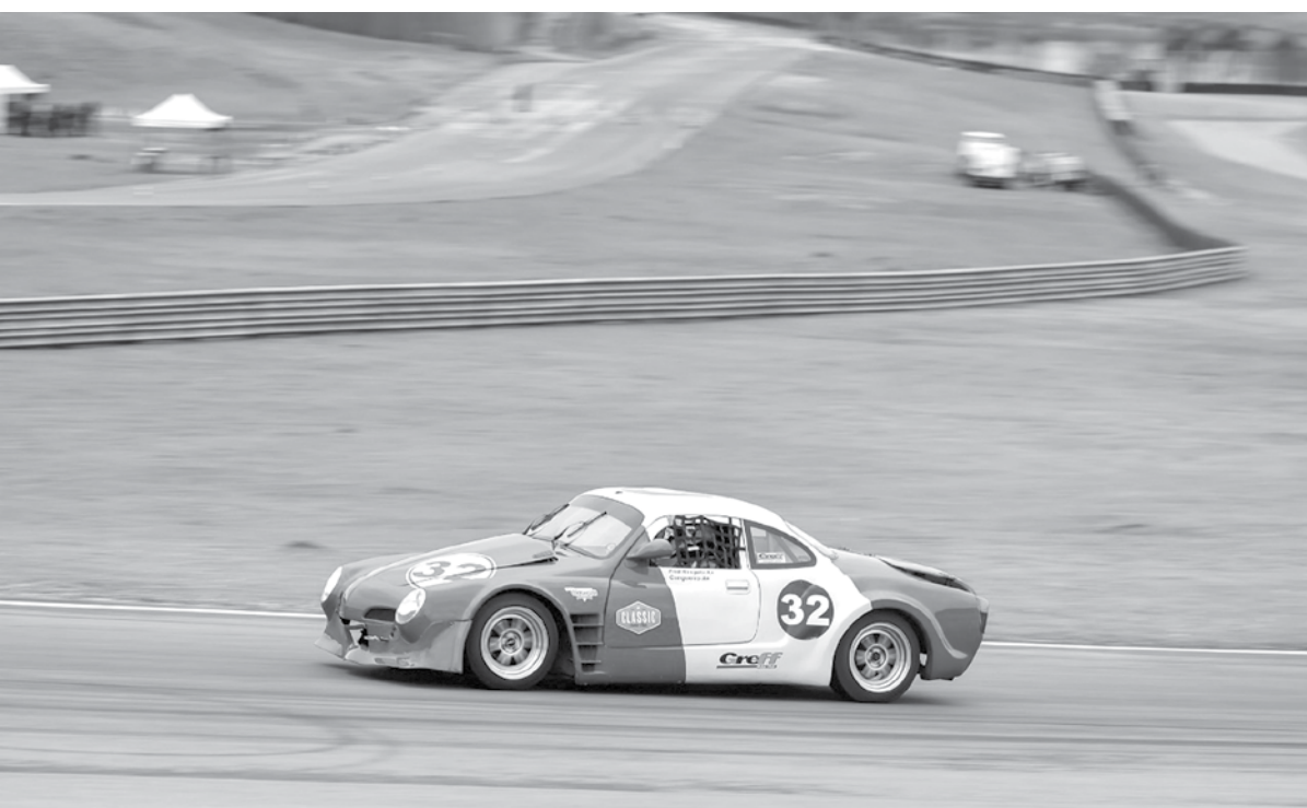
Durante a prova a dupla chegou a ficar em P1 na pista

A próxima corrida da dupla será, em Cascavel/PR, dia 03 de novembro