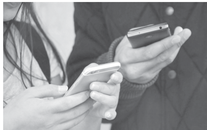
O prazo começou a contar a partir de segunda-feira, 9

derá usar essas informações apenas para formulação, implementação, execução, avaliação e monitoramento de políticas públicas. O sigilo dos dados pessoais deve ser garantido sempre que possível. O estudante com idade igual ou superior a 18 anos e o responsável legal pelo aluno menor de idade responderão pelas informações autodeclaradas e estarão sujeitos às sanções administrativas, cíveis e penais previstas em lei na hipótese de fraude. De acordo com a MP, a carteirinha digital poderá ser emitida pelo MEC; pela Associação Nacional de Pós-Graduandos; pela União Nacional dos Estudantes (UNE); pela União Brasileira dos Estudantes Secundaristas (Ubess); por entidades estudantis estaduais, municipais e distritais; dire-