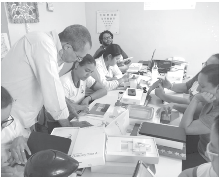
O dispositivo móvel vai contribuir para agilizar atendimentos