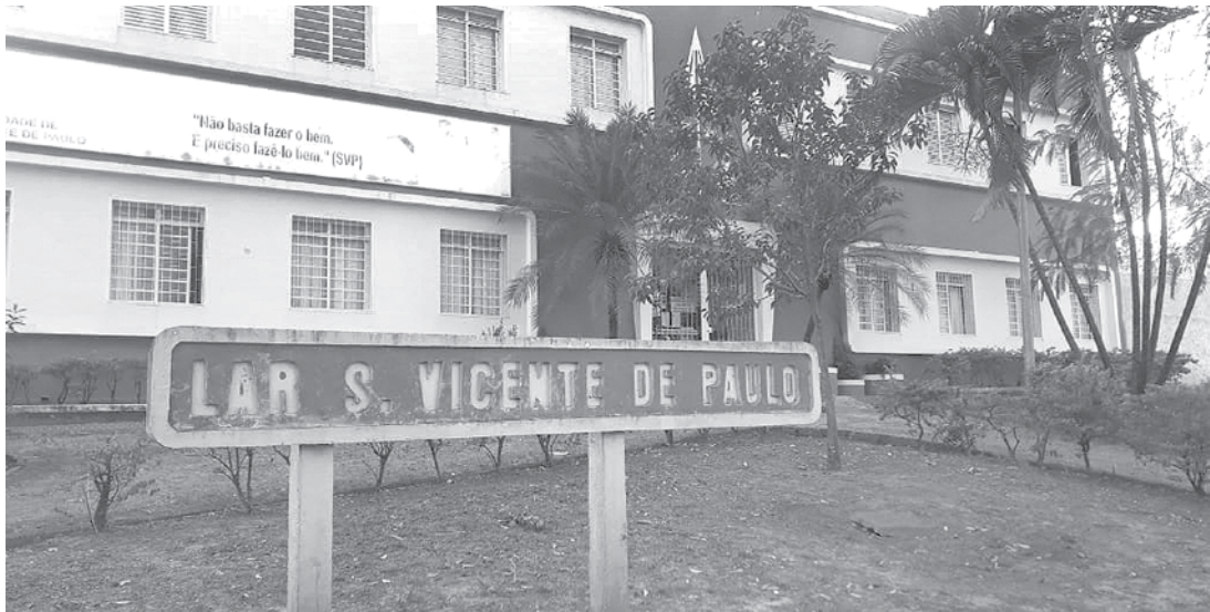
O caso aconteceu no Lar São Vicente de Paulo de São José do Rio Preto