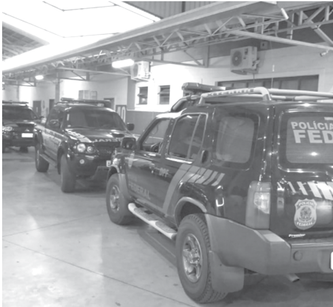
Polícia Federal no campus da Universidade Brasil, em Fernandópolis