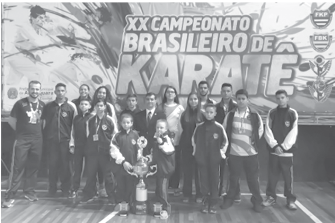
A delegação paulista contou com a participação de 120 atletas