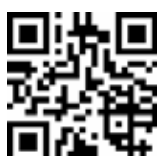
Utilize o QR Code para ter acesso a mais artigos da nossa equipe de articulistas

O suicídio traz dor e sofrimento para os mais próximos daquele que teve a coragem de tirar o seu bem mais valioso: a sua própria vida.