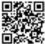
Utilize o QR Code para ter acesso a outras matérias relacionadas

Confira no box ao lado os valores e municípios dos principais ganhadores: