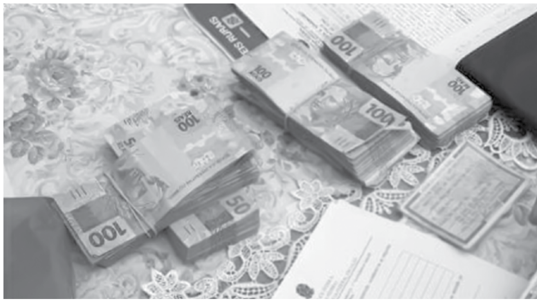
Dinheiro encontrado com a médica presa em Rio Preto