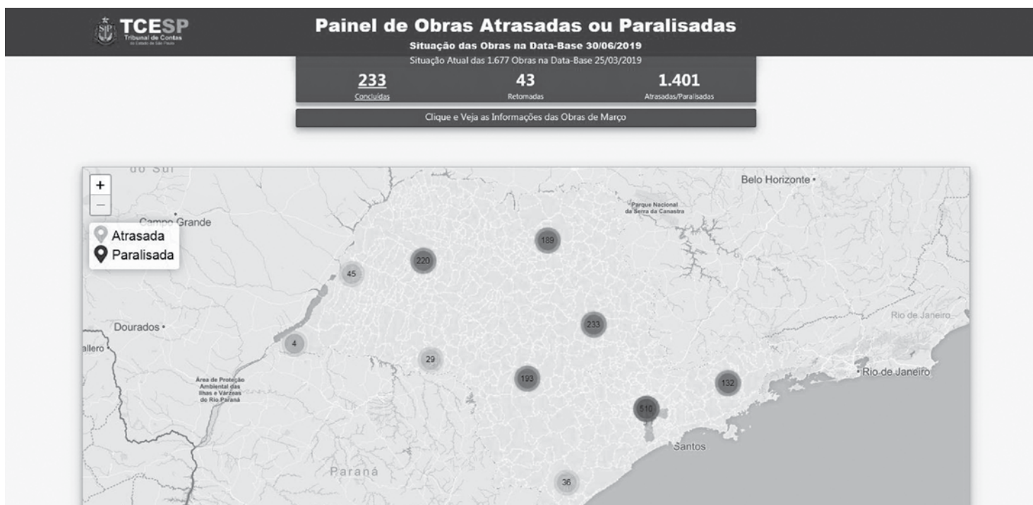
O infosite 'Mapa Virtual de Obras' dá a opção para o internauta "navegar" por meio de um mapa do Estado, e localizar, de forma interativa, as obras que se encontram com problemas de execução contratual

A principal fonte de recursos para a realização das obras advém de convênios firmados com a União com um percentual de 53,6% do montante total. Quase um terço dos recursos para os empreendimentos – 28,6% – é fru-