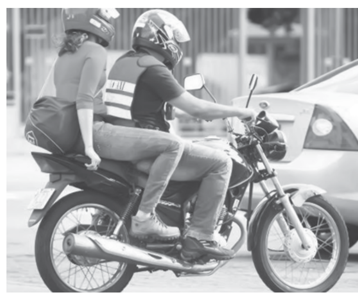
A decisão beneficia a Picap, startup que ajuda a conectar, por meio de um app, motociclistas e usuários que desejam se locomover de maneira mais rápida e barata

No Brasil, iniciou suas operações ainda este ano e atua nas cidades de São Paulo, Rio de Janeiro e Recife. Além de promover a "fuga" dos grandes congestionamentos aos usuários, o aplicativo também é uma oportunidade para os motociclistas. Com um sistema de economia colaborativa, a Picap fornece aos condutores uma fonte de renda complementar e a possibilidade de empreender, sendo eles responsáveis pelos seus horários e locais de trabalho. O aplicativo ainda não cobra comissão do condutor, que fica com 100% do valor da corrida.