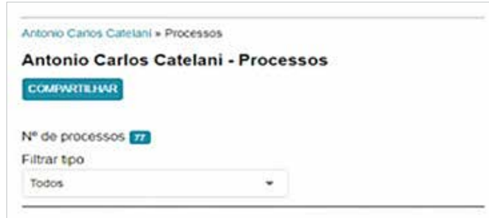
Pesquisa mostra que o empresário aparece no polo passivo (maioria) ou ativo de 77 processos