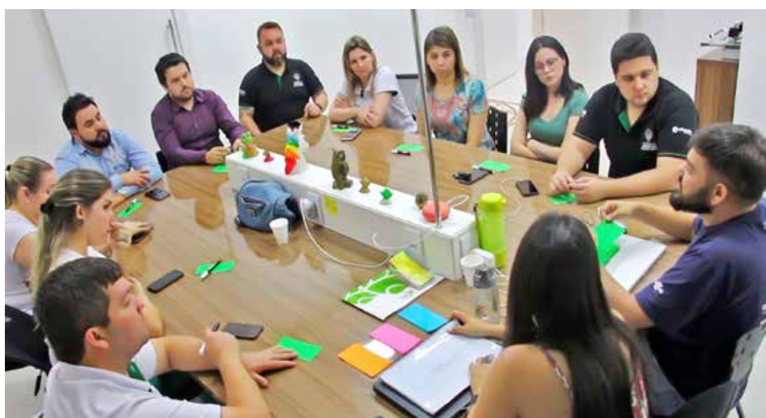
Com a equipe de voluntários foi organizado o 1º Encontro Coonectados

Para disseminar o assunto na cooperativa, durante a Convenção Anual de Colaboradores, realizada em julho, palestrou Arthur Igreja, referência nacional no tema inovação, momento também em que todos os colaboradores foram convidados para fazer parte de um grupo responsável por estimular o debate sobre o assunto, identificando as diversas formas de como podemos inovar no ambiente profissional.