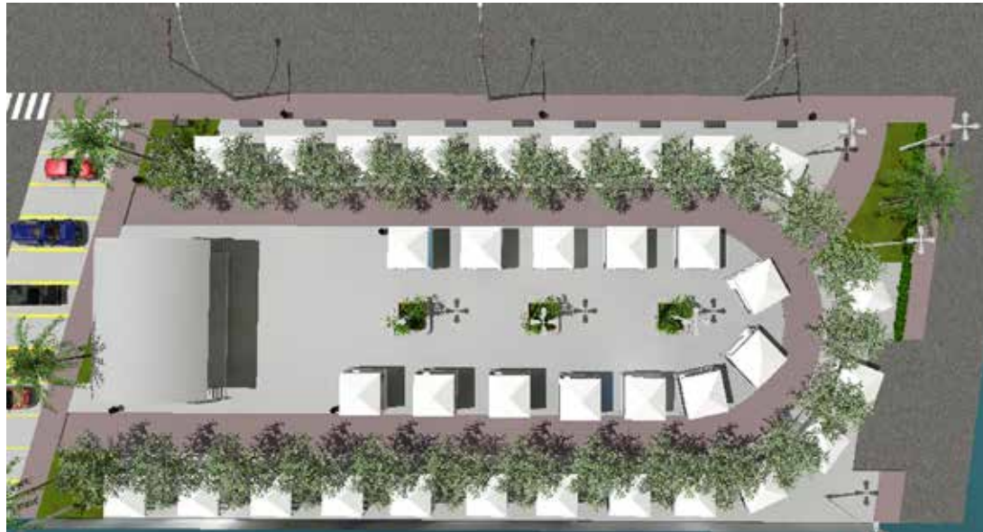
Projeto contempla palco, banheiros, camarins e estacionamento

Além disso, a Secretaria Municipal de Meio Ambiente realizará, nos próximos dias, o plantio de cerca de