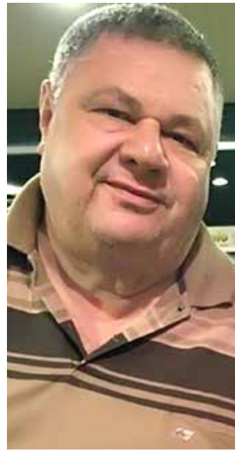
O empresário fernandopolense já atuou na Plastic Tac, Água Viva e WTW

Utilize o QR Code para ter acesso a outras matérias relacionadas