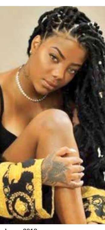
A socialite foi condenada em 2018 a pagar R$ 10 mil à artista por danos morais