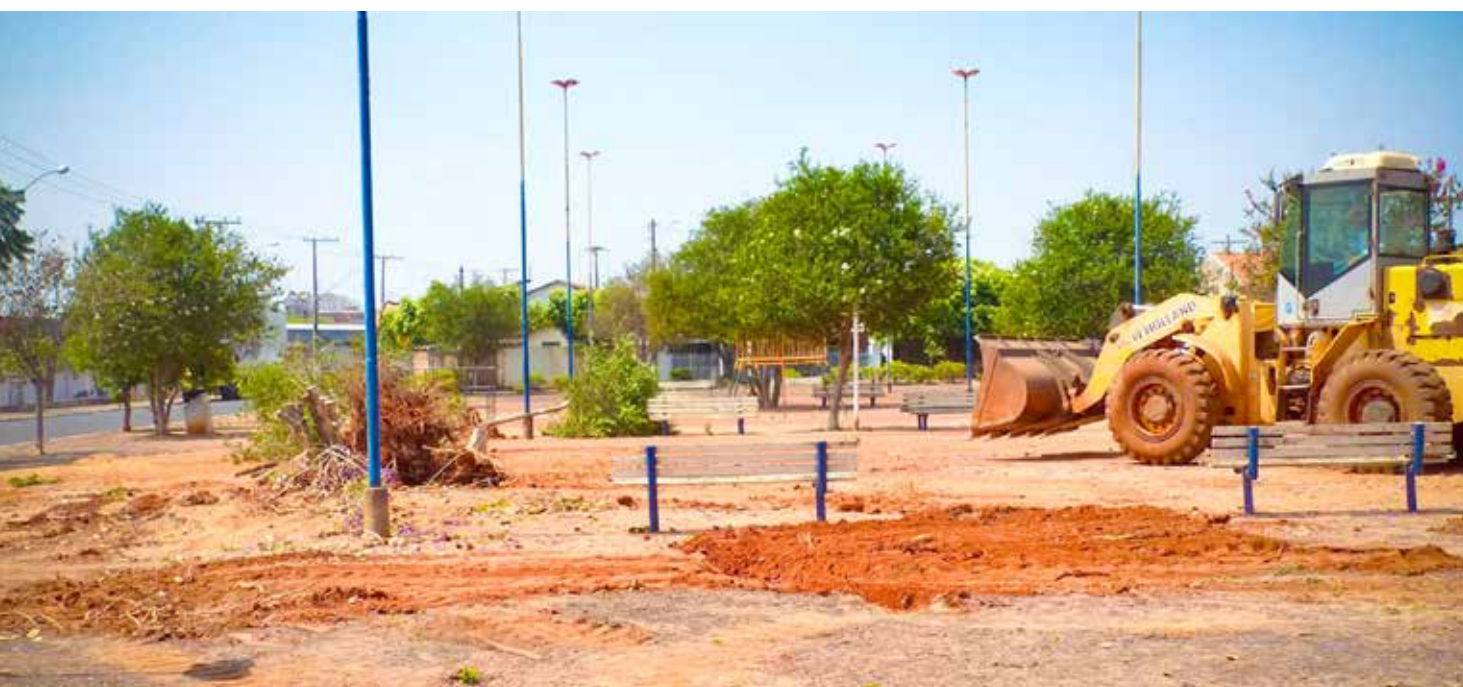
A previsão é que as obras sejam entregues em até 6 meses