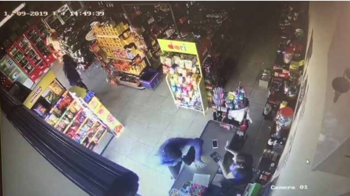
Câmera flagra ladrões durante roubo à mercearia. Suspeitos ainda não foram localizados

dores públicos, políticos, empresários e amigos do dono da universidade, todos com alto poder aquisitivo, que mesmo sem perfil de beneficiário do FIES, mediante fraude, tiveram acesso aos recursos do Governo Federal. Com a sistemática atual de inclusão de dados e aprovação do Fies pelas próprias universidades privadas (beneficiárias dos recursos que aprovam) a PF estima que milhares de alunos carentes por todo o Brasil podem ter sido prejudicados em razão destas fraudes.