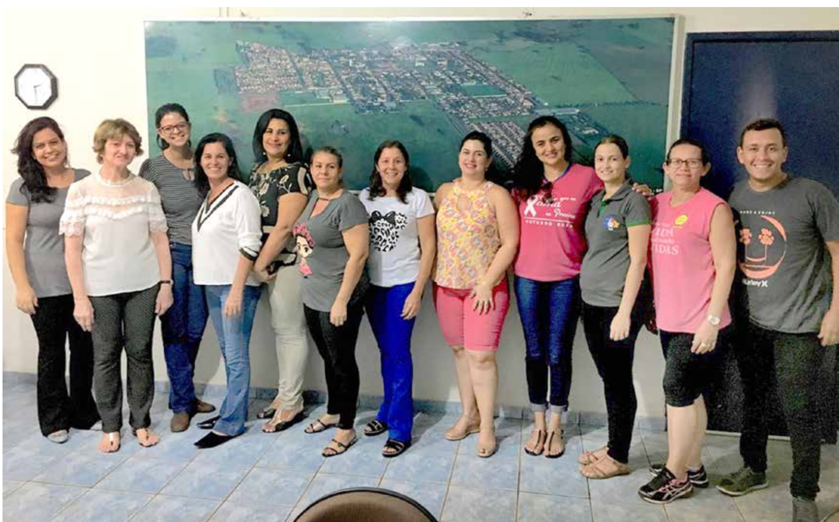
Os setores de Meio Ambiente, Saúde, Educação, Social, Esporte e Turismo se reuniram para iniciar a mobilização do lançamento da campanha municipal

O lançamento está marcado para o dia 10 de outubro em uma grande ação envolvendo todos os setores do município. O início da campanha se dará após o lançamento.