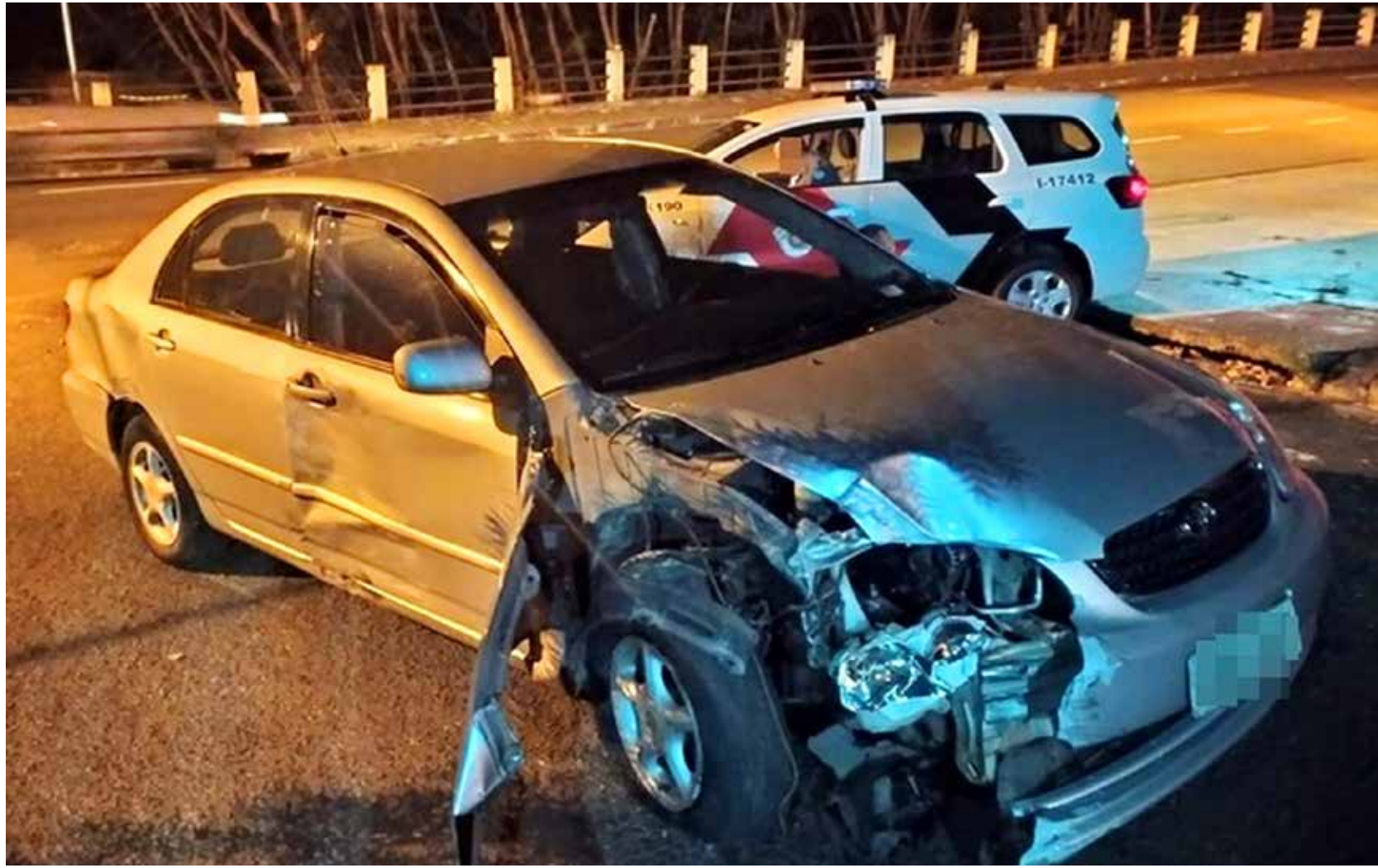
Dupla usou carro de vítima para fugir da Polícia

Dois assaltantes foram presos após tentarem fugir da polícia na noite desta quarta-feira, dia 18. Eles tinham acabado de assaltar um idoso de 84 anos no bairro Villa Ercília, em São José do Rio Preto. Segundo o boletim de ocorrência, a Polícia Militar foi chamada para atender um roubo na casa do idoso, que foi ameaçado de morte e amarrado durante a ação dos criminosos. Eles fugiram do local com o carro da vítima. Ainda segundo o boletim de ocorrência, os policiais encontraram o carro do aposentado próximo a Avenida Philadelpho Gouveia Neto, com duas pessoas dentro. Quando eles perceberam a presença dos policiais, saíram em alta velocidade pela avenida. Durante a fuga, o passageiro do carro, um adolescente de 16 anos, disparou três vezes contra a viatura policial e logo em seguida bateu em outro carro. Após a batida, os criminosos continuaram fugindo, mas o carro parou por mau funcionamento.