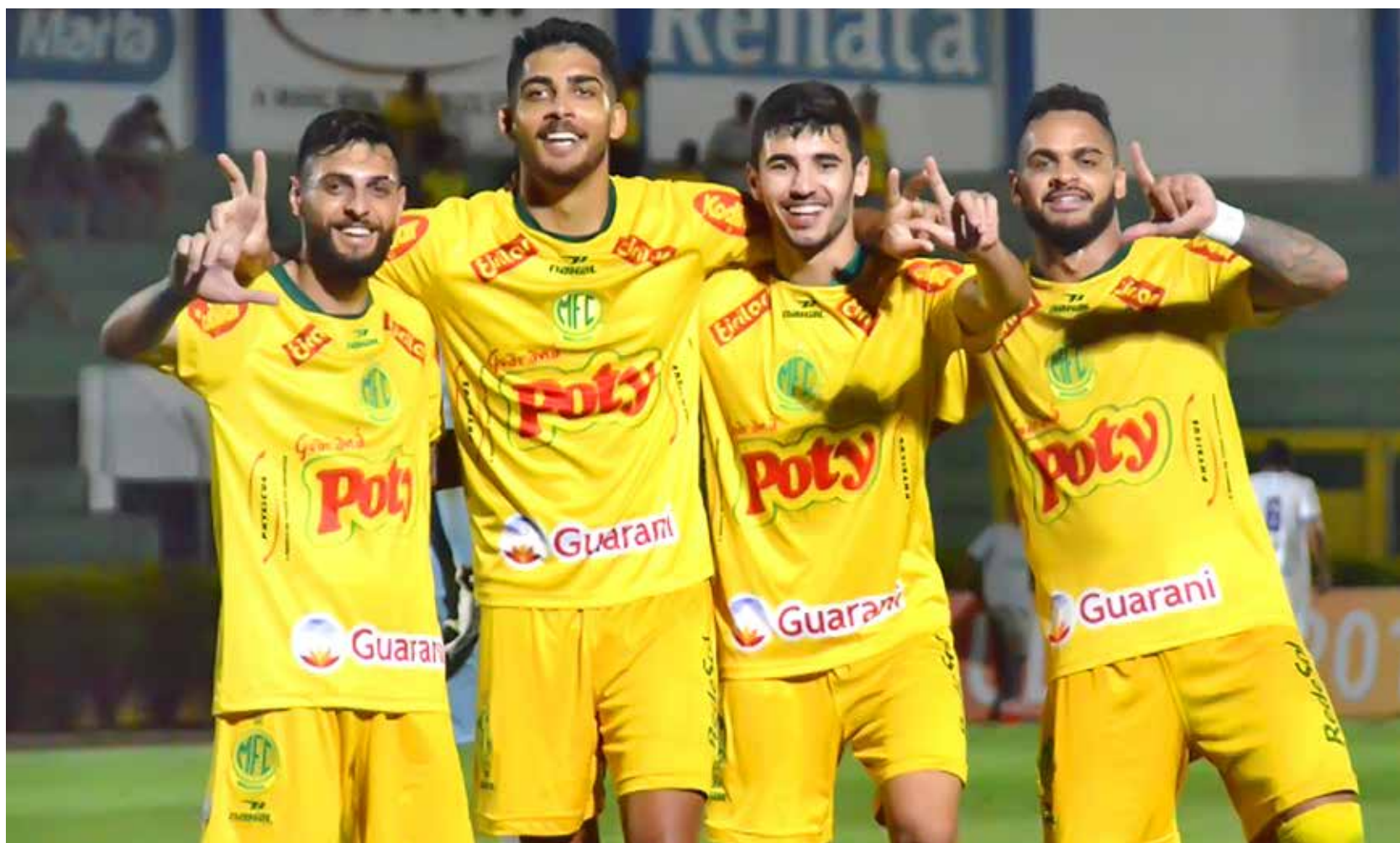
Equipe já garantiu o primeiro lugar com uma rodada de antecedência