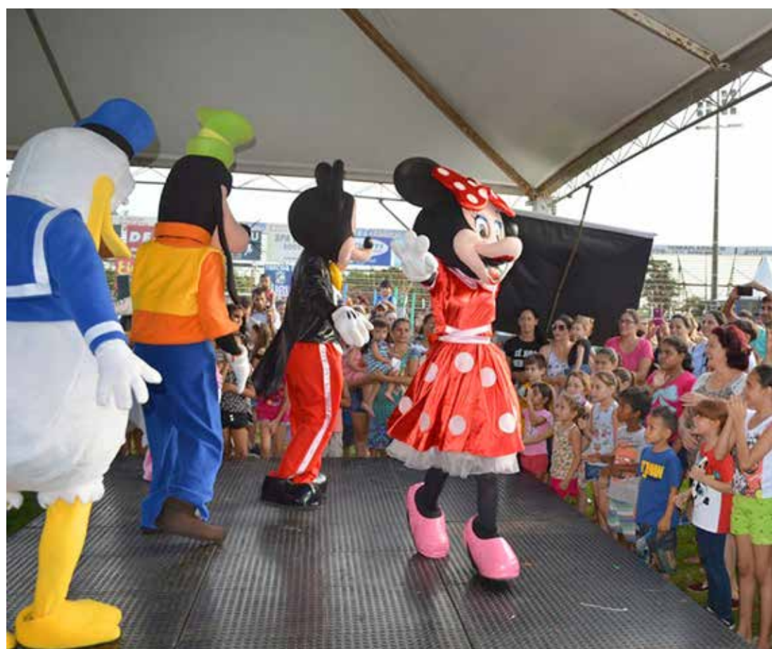
Edição 2018 foi de muita diversão

Para garantir a animação das crianças, muitas brincadeiras estão sendo preparadas com a participação especial de 'personagens vivos', entre eles, super-heróis e as mais famosas personalidades infantis. A criançada também vai poder se divertir nas camas elásticas e com os demais atra-