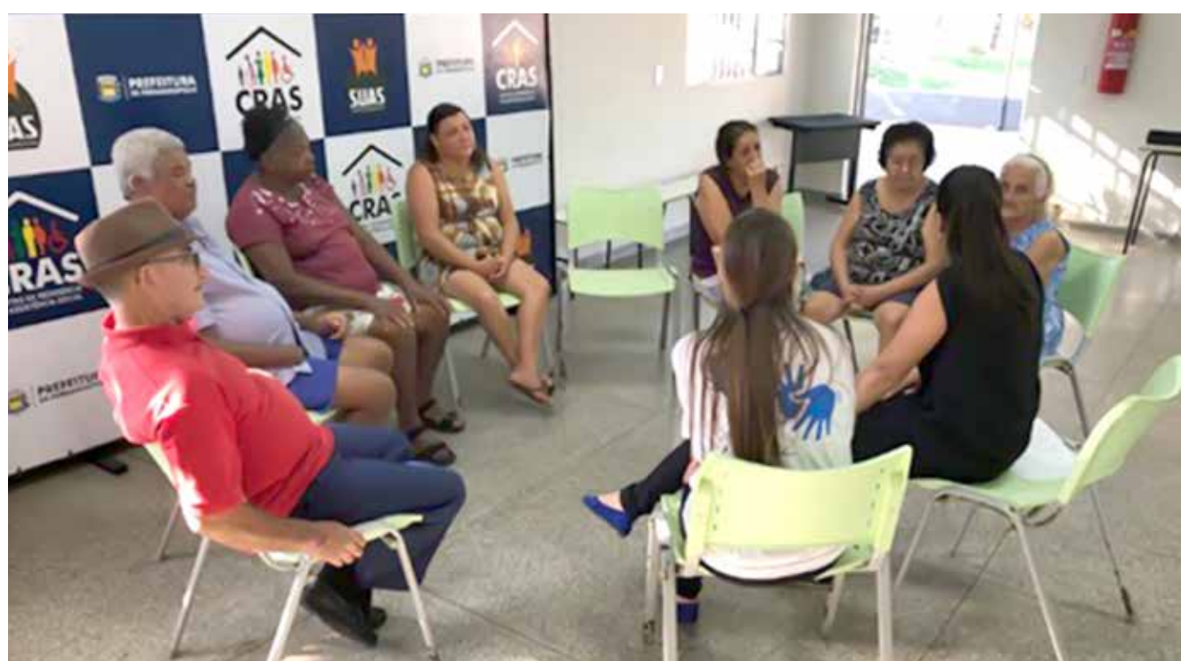
O objetivo é prevenir agravos que possam desencadear rompimento de vínculos familiares e sociais

Já no mês de julho foi desenvolvida uma Atividade Integrativa entre todos os usuários da APADAF, apresentando as diversidades culturais do Brasil. Em agosto, a parceria proporcionou a realização de uma Atividade de Integração em parceria com a UNATI-Universidade Aberta à Terceira Idade, onde os usuários puderam se divertir e emocionar-se em uma roda de violão, cantando sucessos que marcaram sua infância.