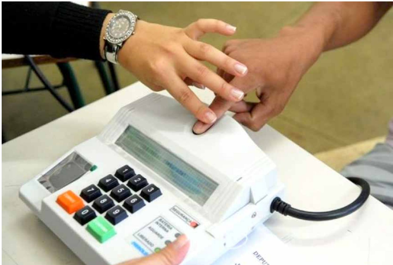
Ação tem o objetivo de incrementar o número de eleitores com biometria

No momento do atendimento, o eleitor deve levar documento oficial de identificação e comprovante de residência. Se tiver o título, deve apresentá-lo também. O documento oficial de identificação precisa ser original, com foto, como RG, cartei-