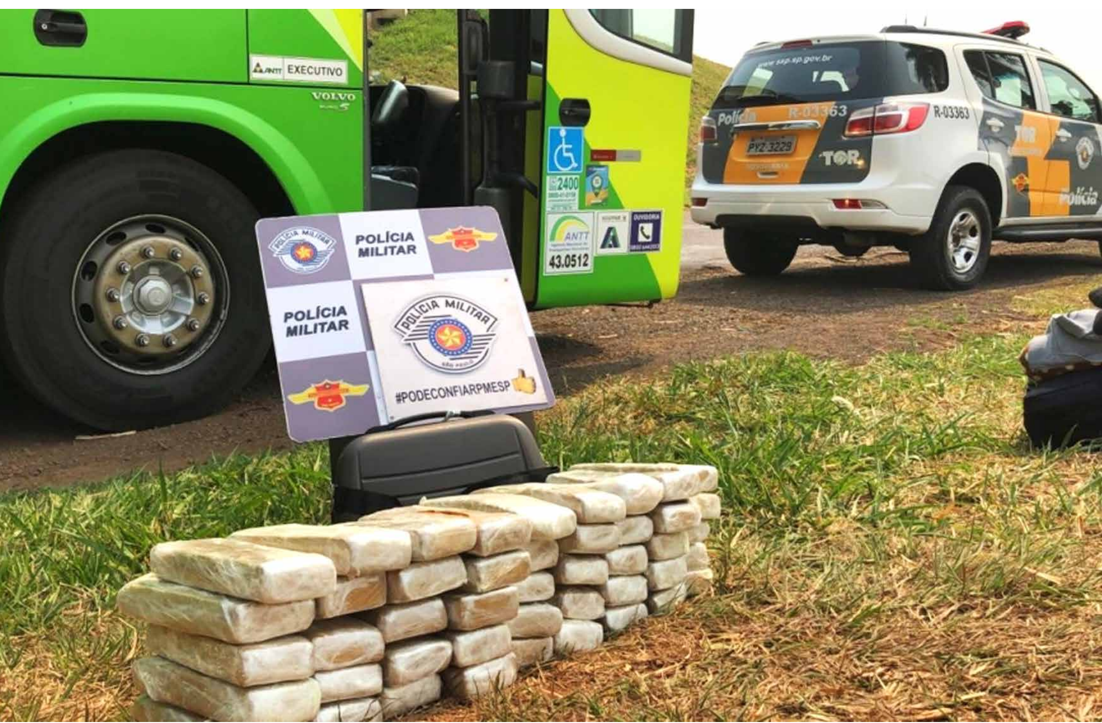
45 tijolos de maconha apreendidos em operação conjunta entre as polícias rodoviárias Federal e Estadual

As abordagens foram feitas em rodovias federal e estadual