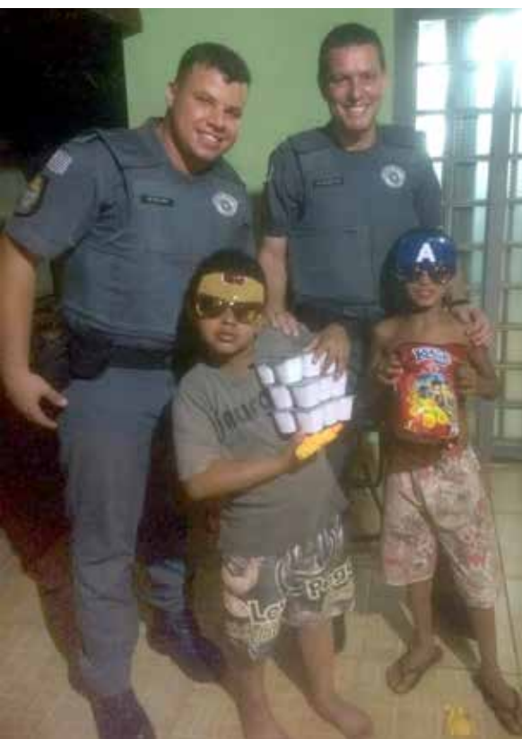
Policiais proporcionaram alegria às crianças

Utilize o QR Code para ter acesso a outras matérias relacionadas