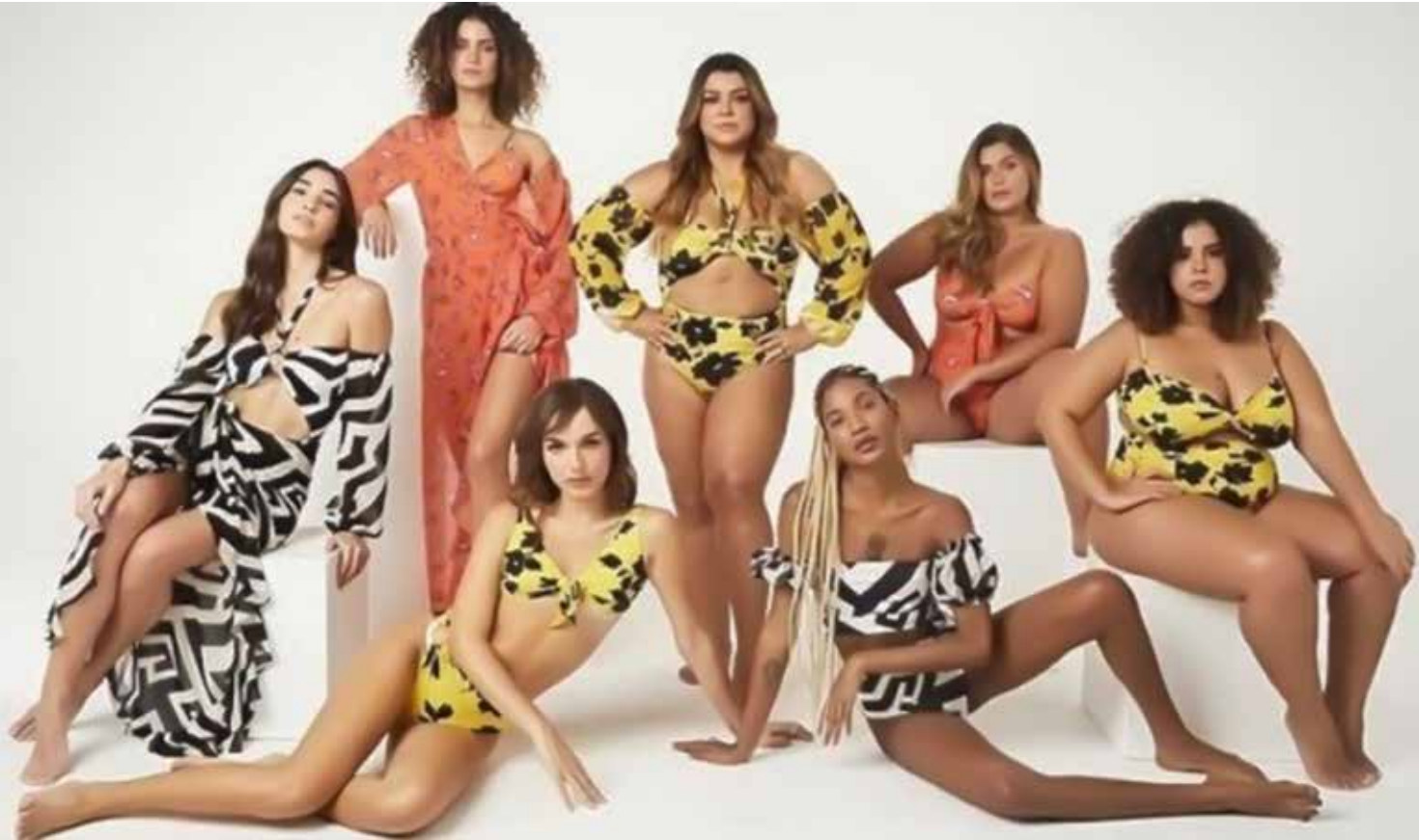
Preta desenvolveu uma linha bastante diversificada para a marca Feline