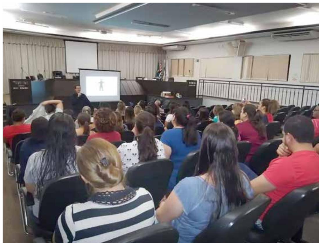
A palestra teve como tema "Prevenção de Suicídio e Qualidade de Vida em Saúde Mental"