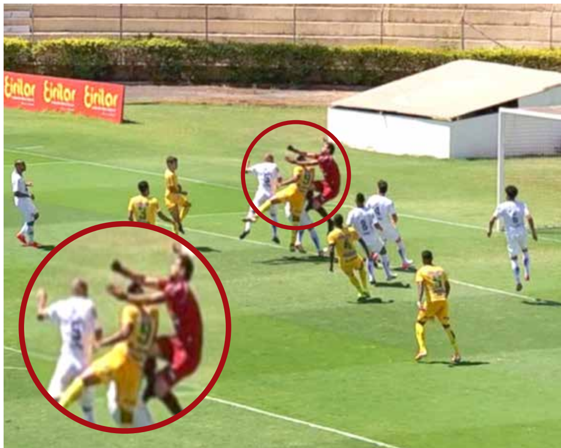
Bruno Mota durante choque com o goleiro Tom, do São Caetano

Utilize o QR Code para ter acesso a outras matérias relacionadas