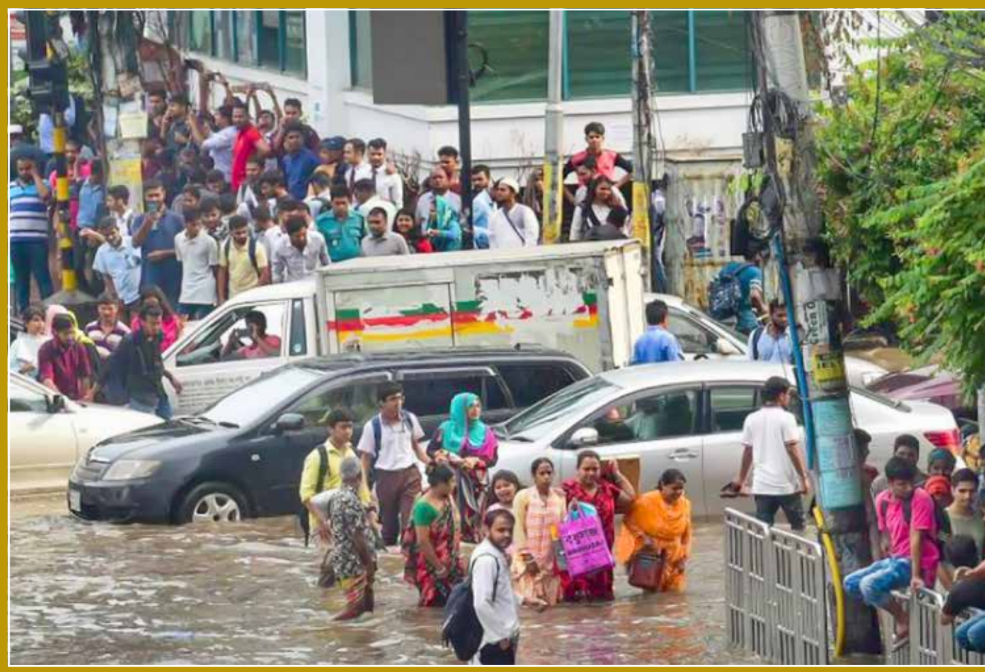
Pedestres caminham em meio a alagamento causado pelas fortes chuvas em Dhaka, Bangladesh.