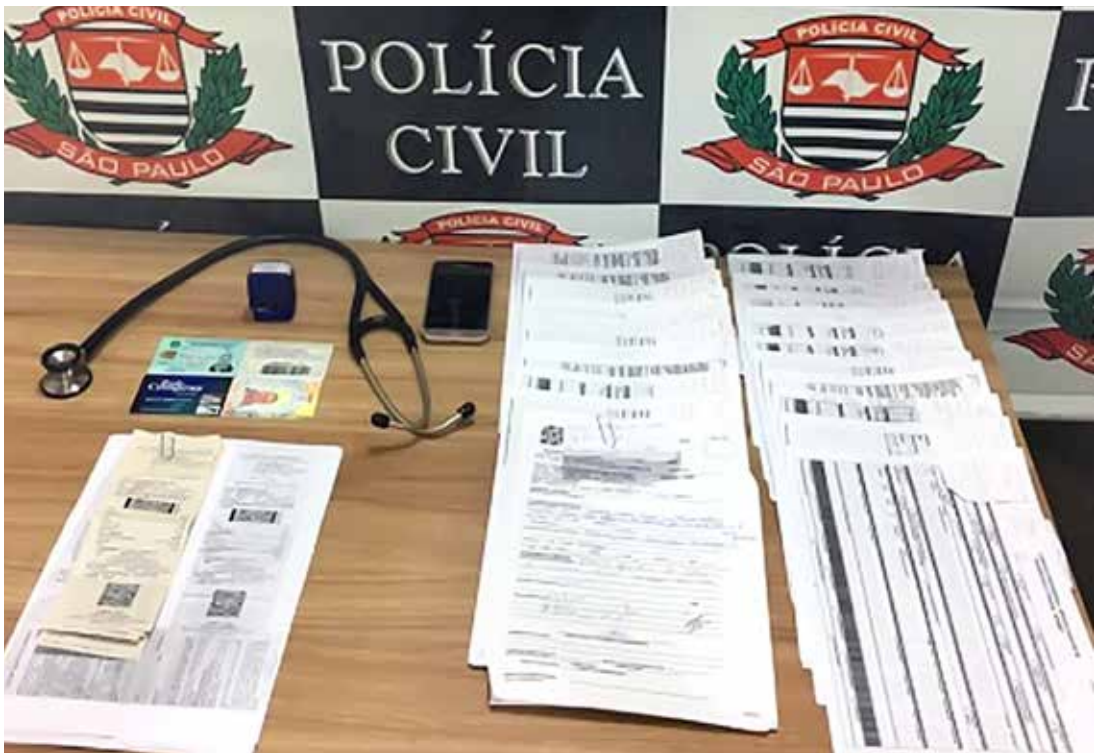
Segundo a polícia, ele confessou que os documentos dele no CRM eram de outra pessoa

→ Da REDAÇÃO contato@oextra.net O homem preso na sexta-feira, 25, em Fernandópolis por se passar por médico na Santa Casa da cidade estava atendendo no hospital havia um mês e realizado quatro plantões na unidade de saúde, segundo a polícia. Ainda de acordo com a polícia, os funcionários estranharam a maneira de atendimento do médico e resolveram checar o número de registro do CRM (Conselho Regional de Medicina). Com isso, verificaram que o número dele no site tinha uma foto diferente. Os funcionários foram até a delegacia e registraram a ocorrência. O delegado foi até o hospital e prendeu o falso médico em flagrante. Segundo a polícia, ele con-