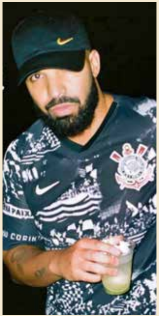
Drake usa camisa do Corinthians em bar do Rio

Além disso, desde que chegou, o ex de Rihanna não se mostrou simpático com os fãs e chegou a trazer sua própria comida e um chef particular. Drake ainda fez uma festinha com mulheres para aliviar a tensão antes do show.