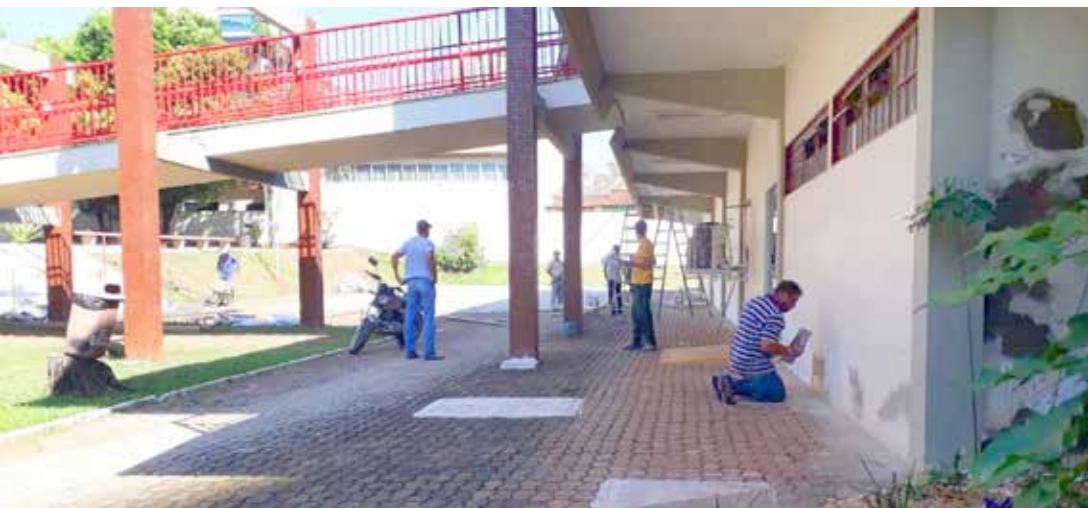
Pinturas, instalação de corrimãos estão sendo realizados pela Secretaria Municipal de Obras