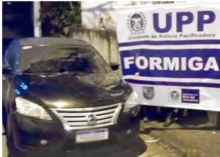
O automóvel, da produção do artista, foi recuperado momentos depois

automóvel, da produção do artista, foi recuperado momentos depois no Morro da Formiga, na Tijuca, Zona Norte. No veículo, estavam o cantor, um de seus músicos e o motorista. A equipe estava indo para uma apresentação na Penha, na Zona Norte da cidade. A produção enviou um outro carro e se encarregou de registrar a ocorrência.