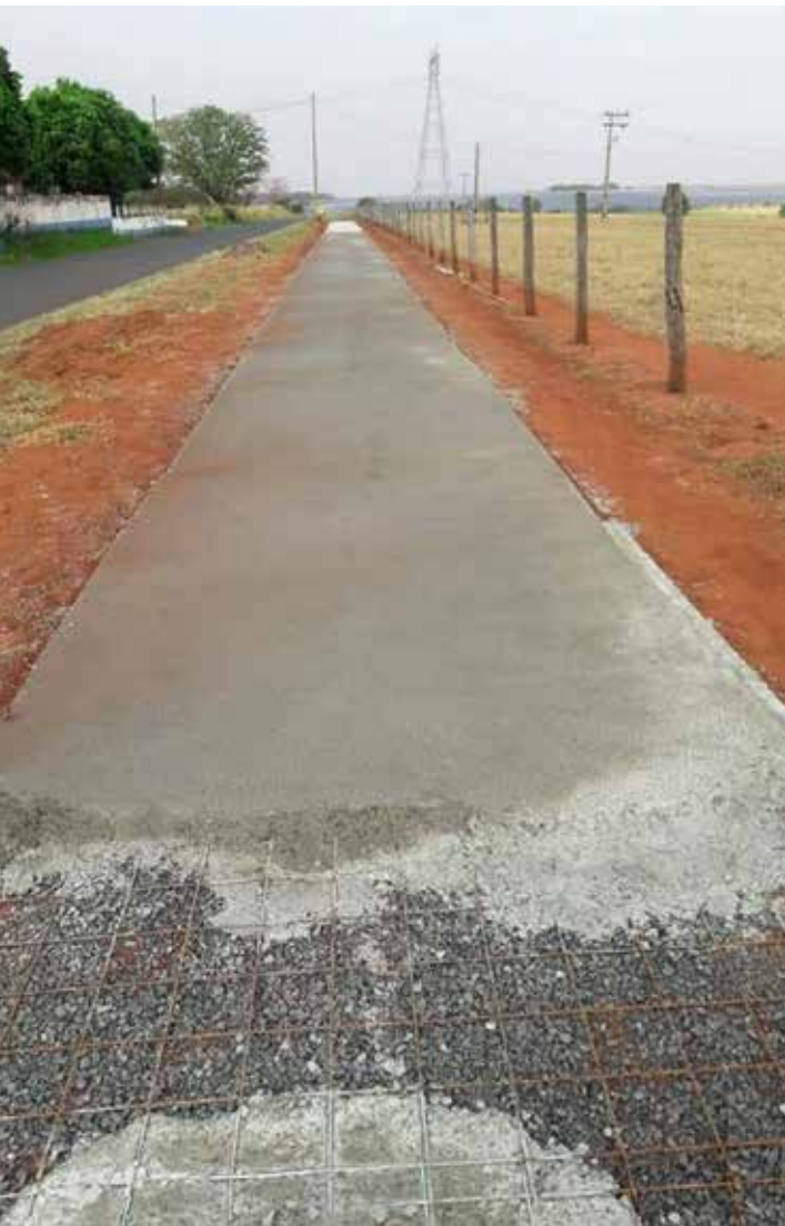
Obra será concluída em breve