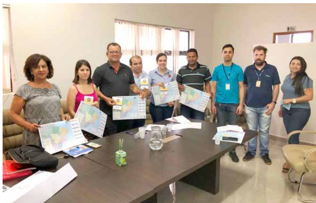
Reunião aconteceu na Câmara Municipal de Vereadores de Ouroeste

sa atenderá a diversos fins, tais como o repasse de verbas federais para cada um dos municípios brasileiros por meio do Fundo de Participação dos Municípios (FPM), a mensuração das contingentes populacionais por idade e sexo, de forma a permitir a implementação de mais diversas políticas públicas, com destaque para aquelas relacionadas à saúde e educação e servir de referência para a produção das estimativas populacionais e planejamento de pesquisas amostrais, seja elas do IBGE de outros órgãos produtores de estatísticas oficiais ou dos mais diversos institutos privados de pesquisa.