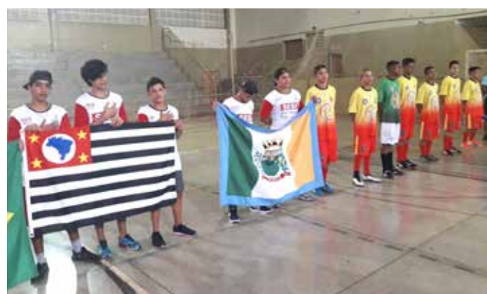
Campeonato é realizado em Ouroeste