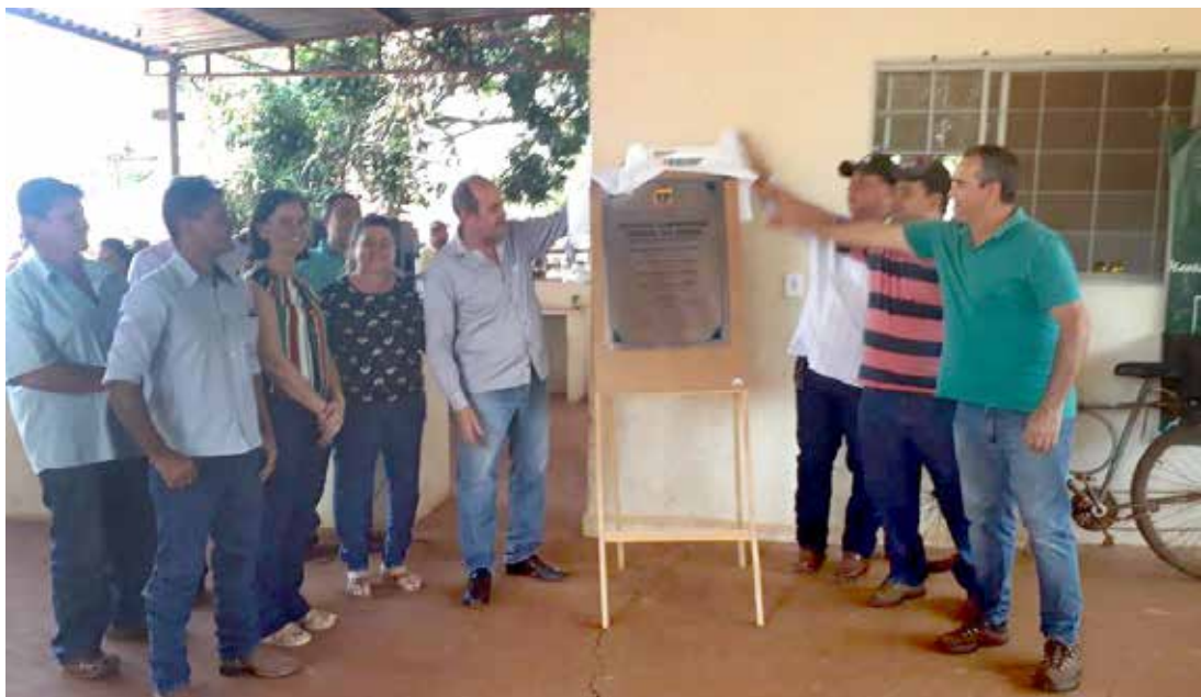
A inauguração foi realizada na sede do Assentamento União

Com a execução desta obra esta distância diminuiu, facilitando a trafegabilidade dos assentados até o perímetro urbano do município. A travessia trará mais agilidade aos serviços prestados pela prefeitura como transporte escolar, atendimento social às famílias e serviços de urgência e emergência.