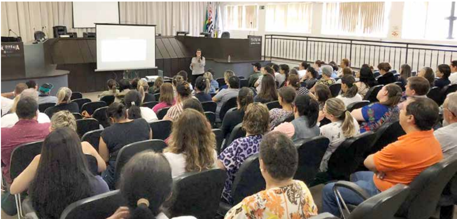
Audiência aconteceu no plenário da Câmara de Vereadores

Durante a audiência, a secretária de saúde apresentou o relatório detalhado sobre as ações específicas, citando números de atendimentos, procedimentos, investimentos, capacitações, entre outras, que contém informações referentes a toda movimentação financeira realizada no período, indicando, por exemplo, o montante e fontes dos recursos aplicados, receitas de impostos e transferências constitucionais. De acordo com os dados apresentados, o município excedeu a margem dos 15% dos recursos mínimos – próprios do tesouro da arrecadação dos impostos – que devem ser aplicados anualmente em Ações e Serviços Públicos de Saúde, atingindo 27,13%, o que significa que a saúde tem sido uma das grandes prioridades da administração municipal. A secretária salientou que o município investe na capacitação dos servidores