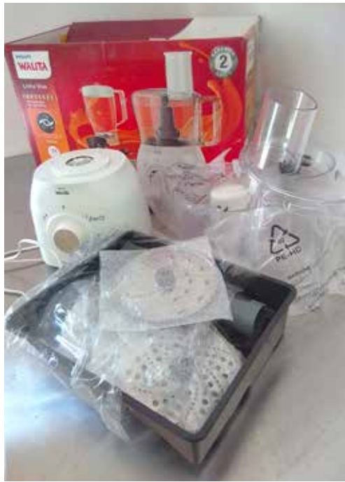
Equipamentos adquiridos para o desenvolvimento do Projeto “Pão Solidário”