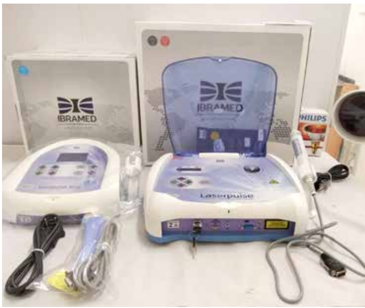
Equipamento adquirido pelo Setor de Fisioterapia

ca uma mediação do processo inflamatório), ou nos quadros de dor (crônicas e agudas). • Infra Vermelho: A fisioterapia com infravermelho é indicada para: Alívio da dor; Aumentar a mobilidade das articulações; Relaxamento muscular; Favorecer a cicatrização da pele e dos músculos; Alterações na pele, como infecção por fungos e em caso de psoríase.