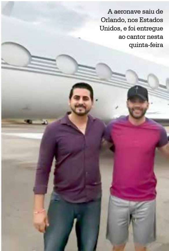
A aeronave saiu de Orlando, nos Estados Unidos, e foi entregue ao cantor nesta quinta-feira

Gustavo Lima agora tem seu próprio jatinho. A aeronave saiu de Orlando, nos Estados Unidos, e foi entregue ao cantor nesta quinta-feira. Ele fez questão de posar na cabine do piloto e estrear para se deslocar até o show de Minas Gerais. Nas redes sociais, o fornecedor