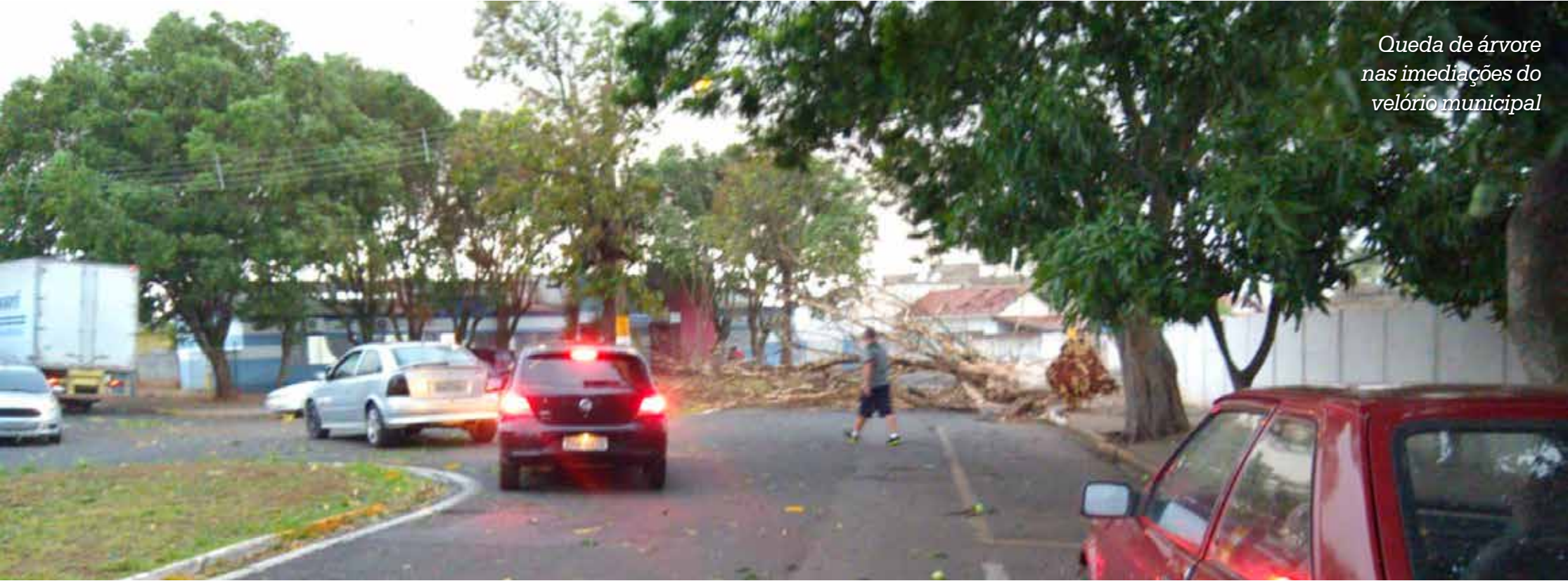
Queda de árvore nas imediações do velório municipal

va) não veio de forma branda como eu gostaria”, lamentou. De acordo com os sites meteorológicos, a previsão é que as chuvas continuem até quarta-feira, dia 23.