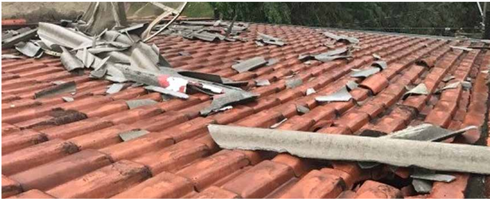
Residências no Coester ficaram com parte do telhado danificado

Uma forte chuva atingiu Fernandópolis, na tarde desta segunda-feira, 21, acompanhada de rajadas de fortes ventos, que destelhou casas no bairro Coester, zona leste do município, causando assim transtornos à população. Foram 40 minutos de chuva forte. Na região do 16º Batalhão da Polícia Militar, em um trecho da Avenida Líbero de Almeida Silveiras, houve queda de energia e os postes de iluminação ficaram inoperantes. Os bairros mais atingidos foram Brasília e Coester. Há registro de queda de árvore nas imediações do velório municipal e alagamentos em outros pontos do município.