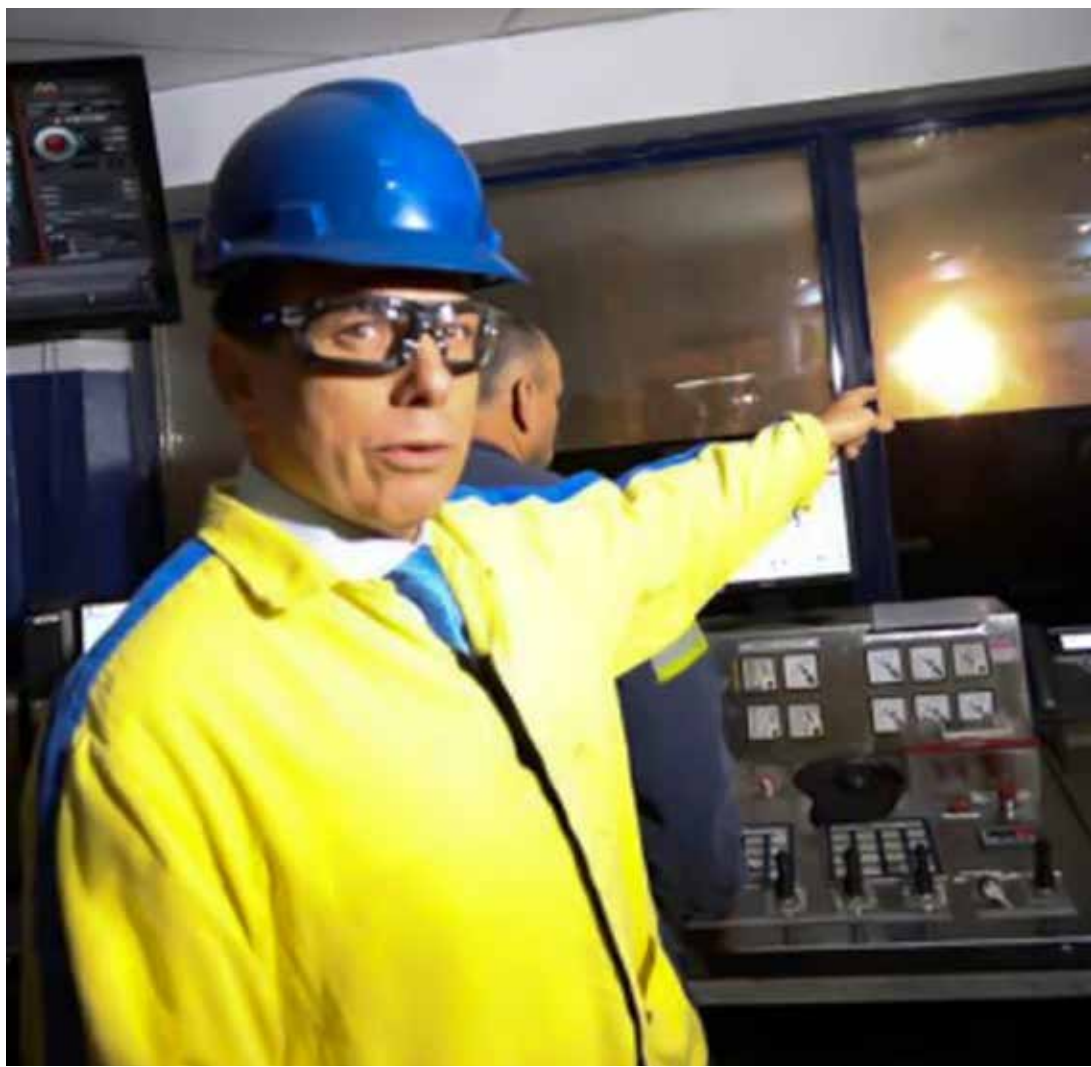
Desde o início do ano, mais de 70 toneladas de drogas já foram destruídas pelo Governo do Estado

truídas pelo Governo do Estado com a autorização da Justiça e acompanhamento da Vigilância Sanitária e do Ministério Público. Na incineração de hoje, foram destruídas 7,4 toneladas de maconha, 25,09 kg de ecstasy, 8,32 kg de cocaína, 24,5 kg de tetracaína e cafeína e 11,79 kg de metilenodioximetanfetamina (MDMA), utilizado na preparação de drogas sintéticas. Os entorpecentes foram recolhidos durante atividades deflagradas na capital paulista pela 2ª Delegacia Antissequestro do Departamento de Operações Especiais Estratégicas (Dope), 33º Distrito Policial (Pirituba) e 1ª e 3ª Delegacias de Investigações sobre Entorpecentes (Dise), do Departamento Estadual de Prevenção e Repressão ao Narcotráfico (Denarc). Em todo o Estado, 119,4 toneladas de entorpecentes foram apreendidas pelas polícias de São Paulo nos oito primeiros meses deste ano. No mesmo período, as polícias Civil e Militar prenderam mais de 38 mil traficantes.