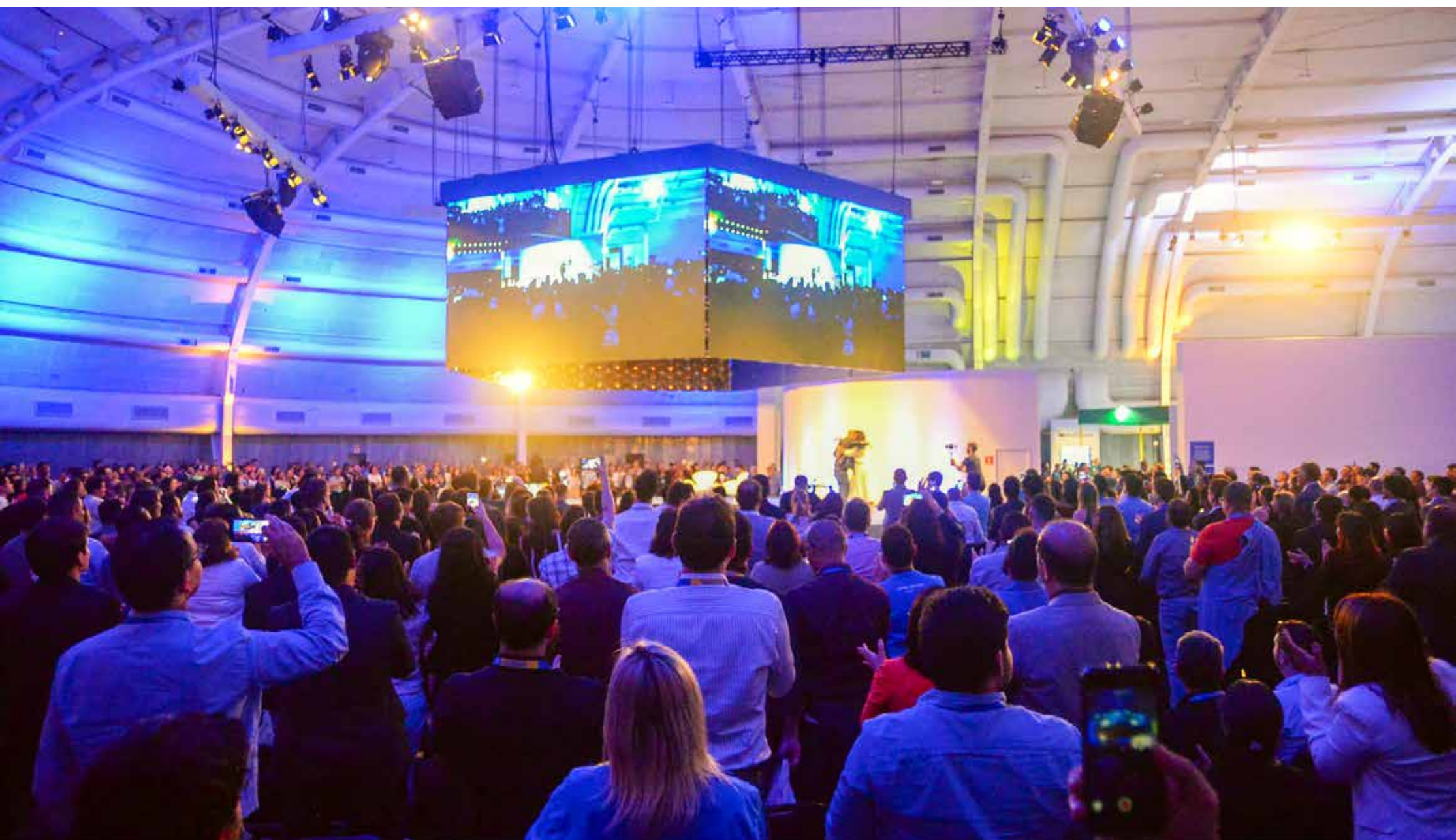
A conferência terá cinco palcos simultâneos, workshops, hackathon e feira de negócios

* Acre, Alagoas, Bahia, Ceará, Goiás, Maranhão, Mato Grosso, Mato Grosso do Sul, Minas Gerais, Pará, Paraíba, Paraná, Pernambuco, Piauí, Rio de Janeiro, Rio Grande do Norte, Rio Grande do Sul, Rondônia, Santa Catarina, São Paulo, Sergipe e Tocantins.