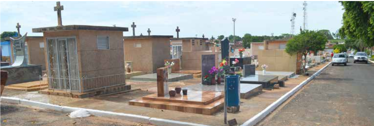
A partir de agora somente está liberada a limpeza dos jazigos

A determinação de prazo para estes serviços consta no decreto 7.907, de 23 de outubro de 2017. Independentemente da data especial, é importante que os familiares mantenham os túmulos bem conservados e em ordem para não causar transtornos aos visitantes dos cemitérios de Fernandópolis e de Brasitânia.