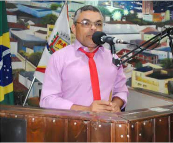
É a segunda vez que o vereador sugere tal benefício

“Sabemos que a preservação ao meio ambiente é muito importante, e temos que promover incentivos para que a população proceda com atitudes benéficas ao nosso meio ambiente, e desconto no IPTU, tenho certeza que seria um ótimo incentivo”, destacou Cidinho do Paraíso.