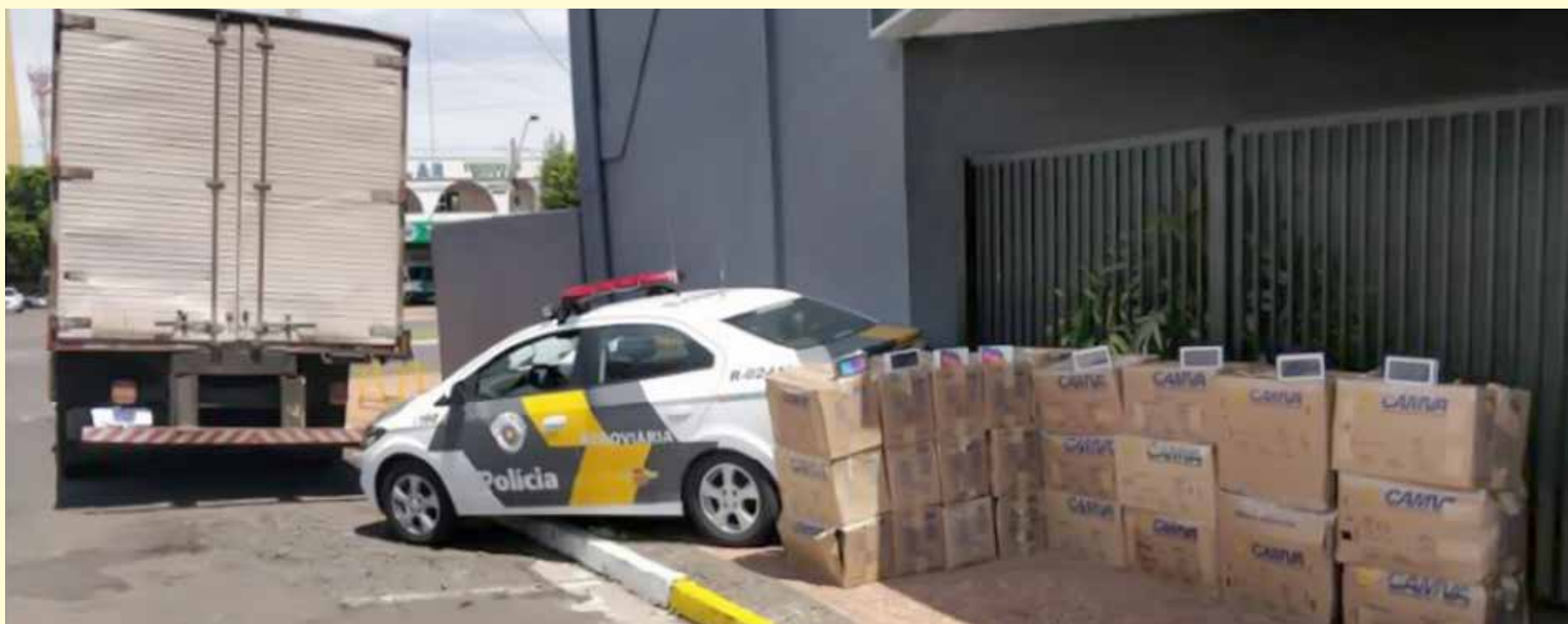
Celulares foram apreendidos dentro de baú de caminhão parado