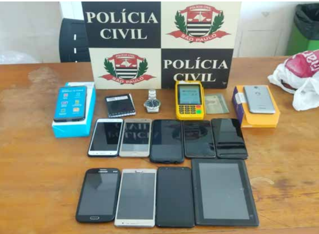
Celulares apreendidos pela polícia

Caso está sendo investigado pela Polícia Civil