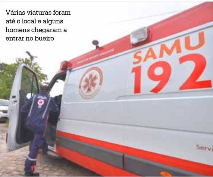
Várias viaturas foram até o local e alguns homens chegaram a entrar no bueiro

O caminhoneiro e a carga foram levados para a Polícia Federal de Araçatuba (SP). O suspeito foi liberado após pagar fiança arbitrada em R$ 3 mil e responderá pelo crime de descaminho em liberdade.