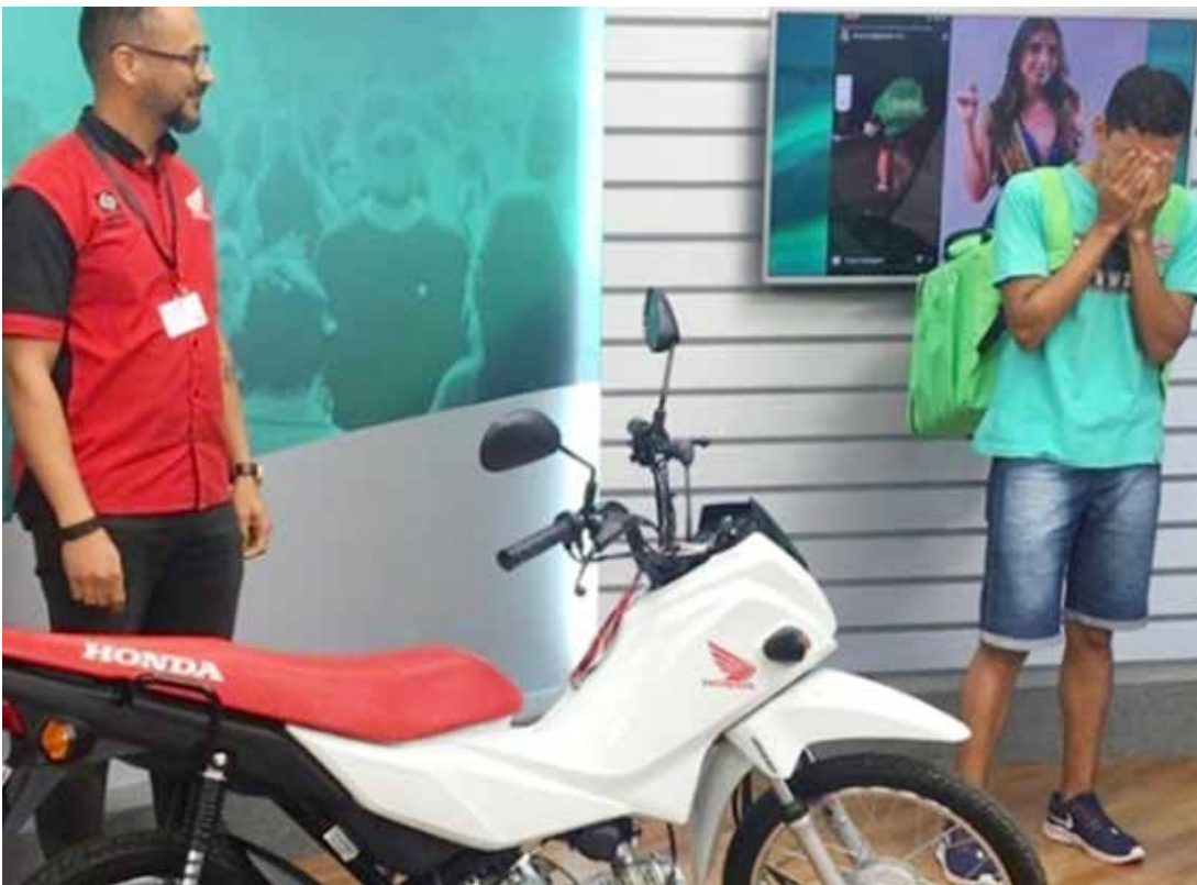
O presente foi dado por uma concessionária de Mato Grosso

Em nota, a organização do evento afirmou repudiar a atitude da jovem ou qualquer atitude discriminatória que deprecie outro ser humano.