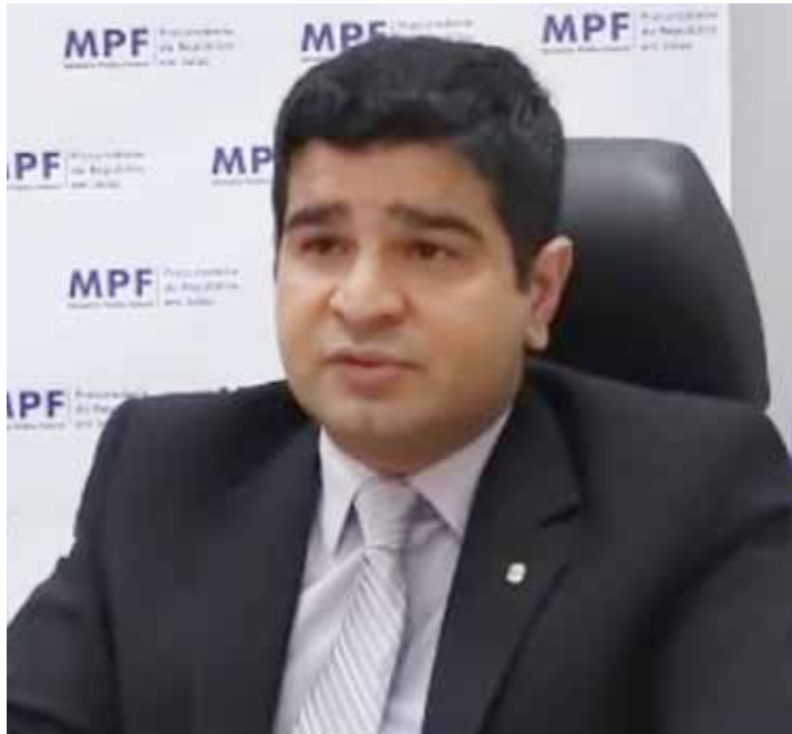
Procurador federal, José Rubens Plates