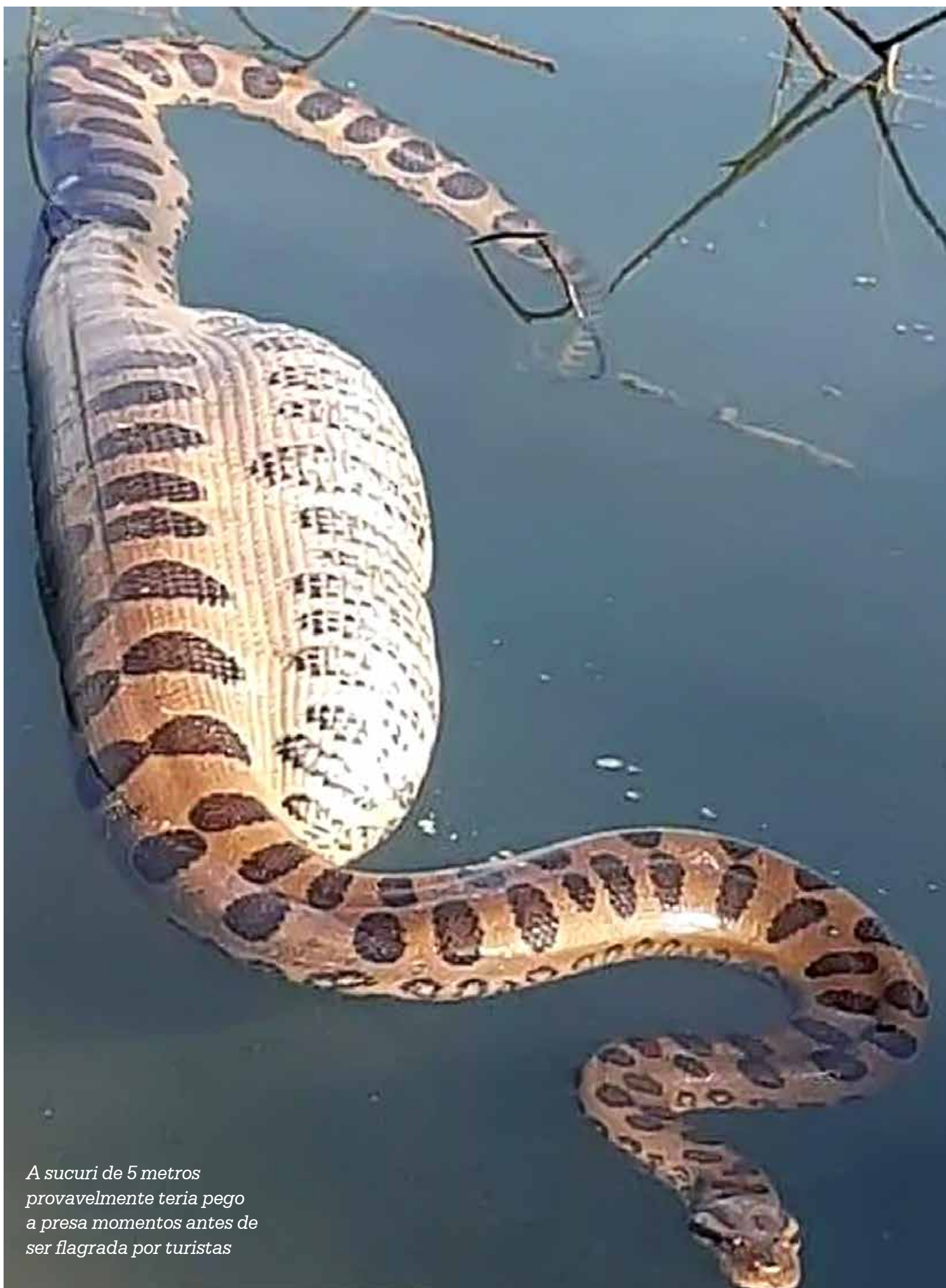
A sucure de 5 metros provavelmente teria pego a presa momentos antes de ser flagrada por turistas