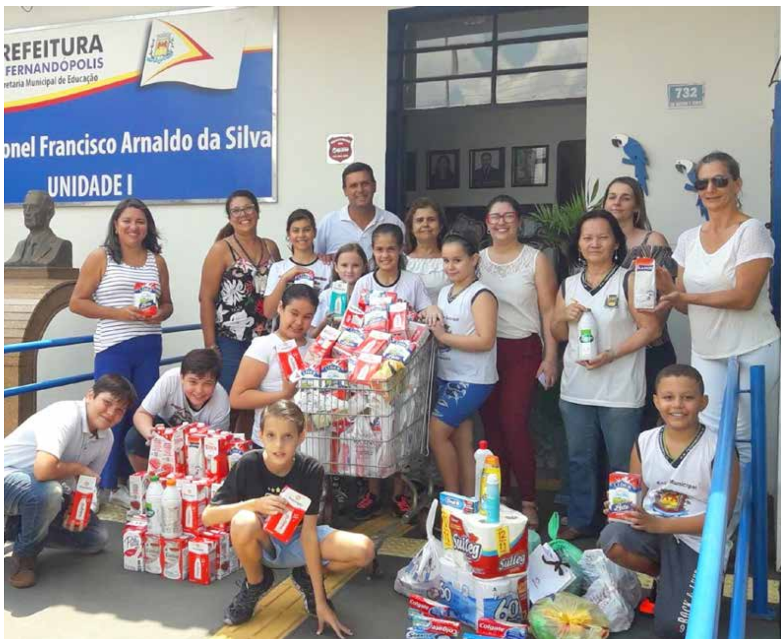
Foram arrecadados mais de 200 litros de leite e diversos produtos de higiene pessoal