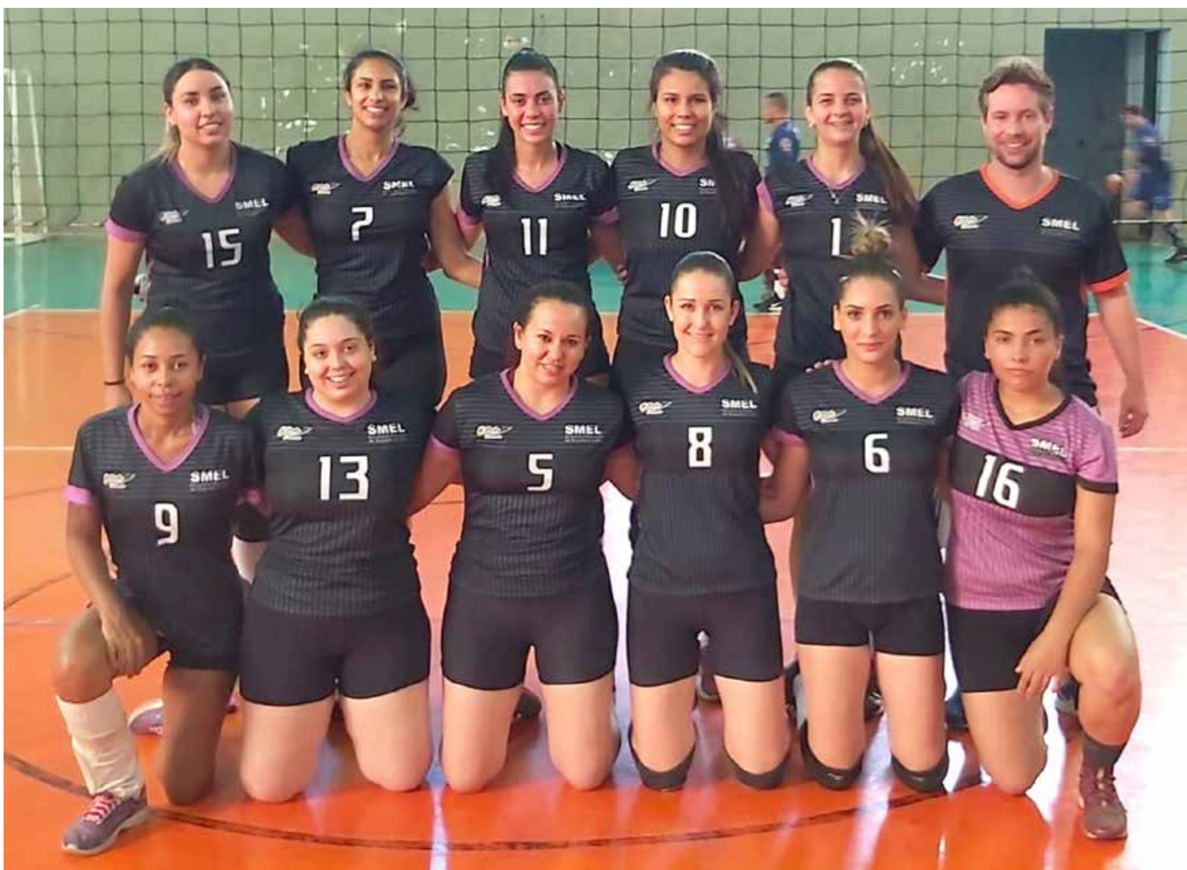
Equipes feminina e masculina conquistaram a classificação para a final no último final de semana

Já o masculino venceu a equipe de Bady Bassitt por 2 sets a 0. As duas equipes protagonizaram um grande duelo que garantiu a classificação de Fernandópolis para a final, que será contra Votuporanga no dia 10 de novembro.