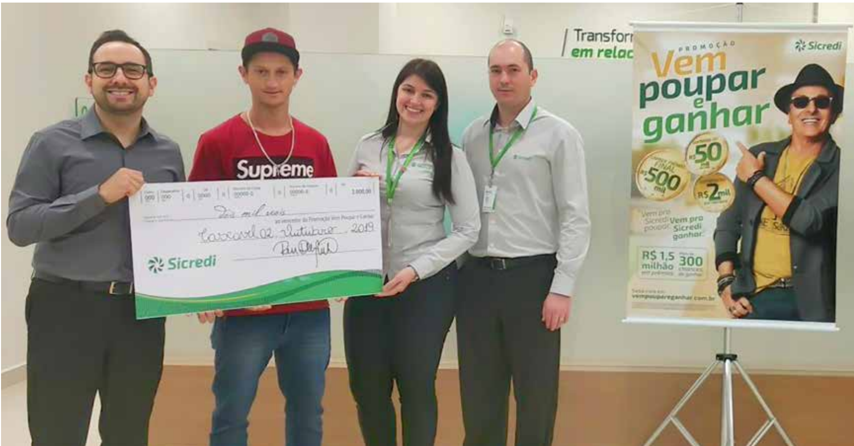
Para participar é simples: a cada R$ 100 de incremento líquido na poupança do associado, um número da sorte é distribuído

Sicredi A campanha de incentivo à poupança “Vem Poupar e Ganhar”, desenvolvida pelo Sicredi nos estados do Paraná, São Paulo e Rio de Janeiro chega na reta final com o sorteio do grande prêmio de R$ 500 mil, marcado para o dia 16 de dezembro de 2019. Até o final de outubro, já foram distribuídos mais de R$ 400 mil em prêmios. Ao final dos nove meses da promoção, a soma de prêmios distribuídos chega a R$ 1,5 milhão, com 10 sorteios semanais de R$ 2 mil e mensais de R$ 50 mil. Para participar é muito simples: a cada R$ 100 de incremento líquido na poupança do associado, um número da sorte é distribuído – se as aplicações forem na modalidade programada (quando há o débito mensal para conta poupança do associado), as chances de ganhar são dobradas, já que o investidor ganha dois números para concorrer.