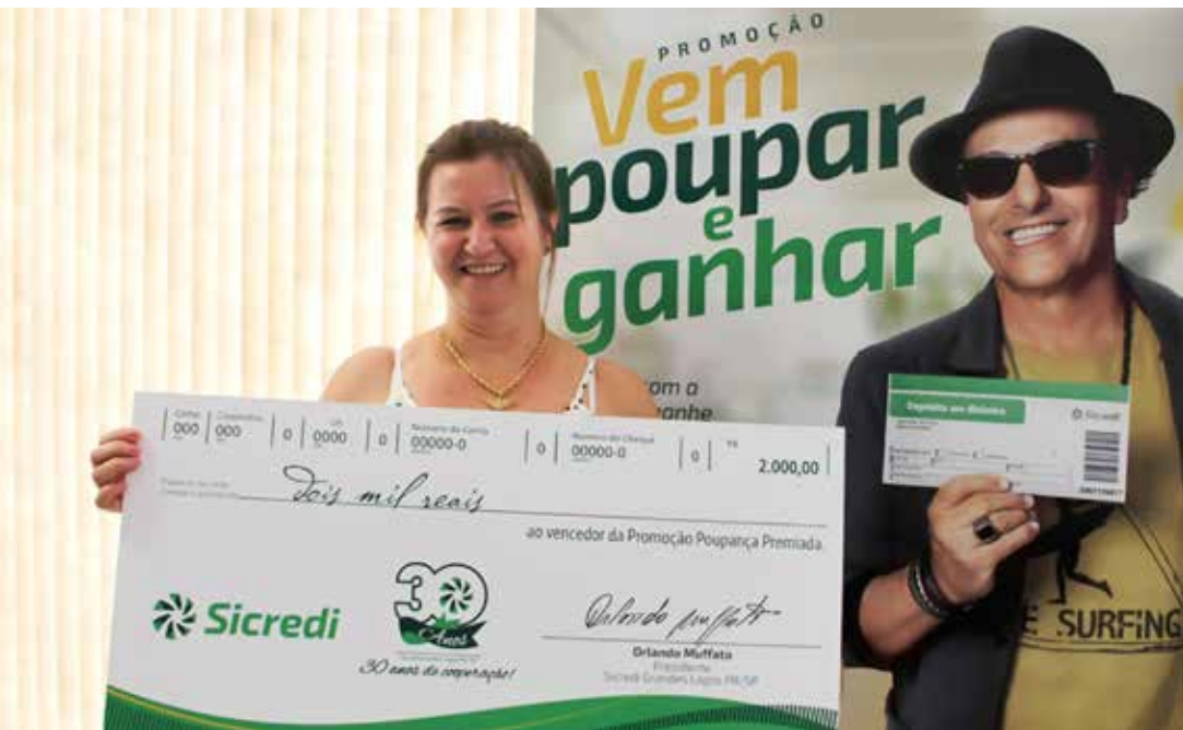
A campanha “Vem Poupar e Ganhar” também realiza sorteios semanais de R$ 2 mil e mensais de R$ 50 mil

* Acre, Alagoas, Bahia, Ceará, Goiás, Maranhão, Mato Grosso, Mato Grosso do Sul, Minas Gerais, Pará, Paraíba, Paraná, Pernambuco, Piauí, Rio de Janeiro, Rio Grande do Norte, Rio Grande do Sul, Rondônia, Santa Catarina, São Paulo, Sergipe e Tocantins.