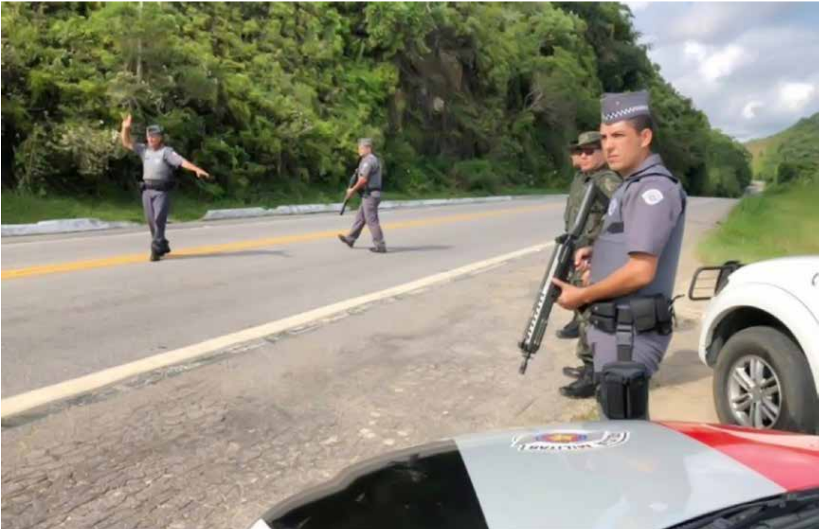
Ação teve a mobilização de 18.481 policiais militares, com o emprego de 7.849 viaturas e onze helicópteros