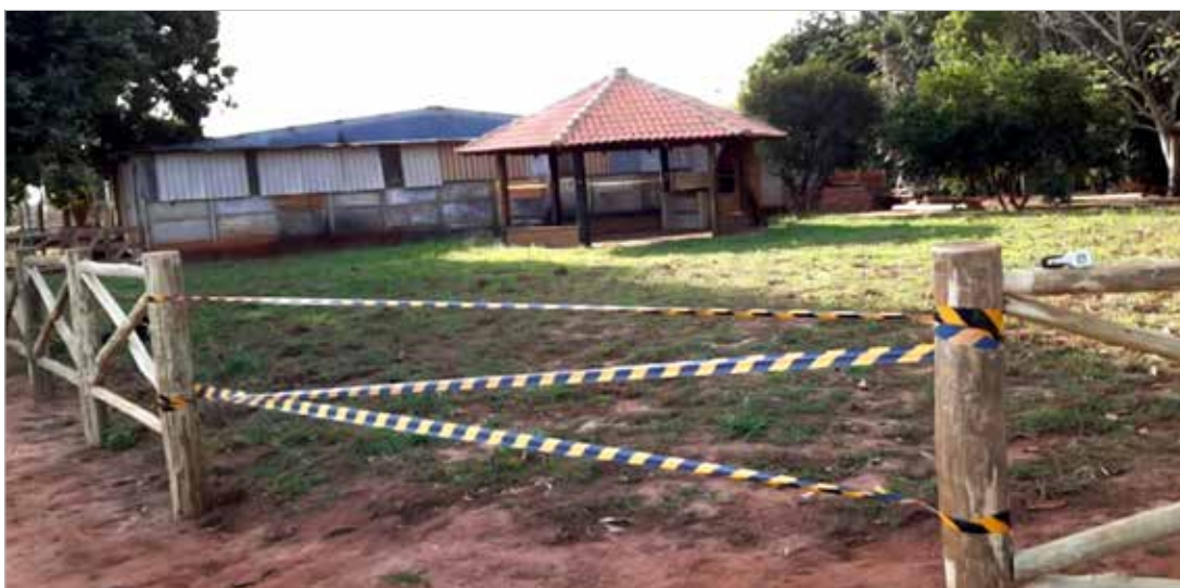
Os trabalhos de orientação e fiscalização se estenderão ao longo da semana

Ainda de acordo com a Prefeitura, os trabalhos de orientação e fiscalização se estenderão ao longo da semana, afim de dispersar aglomerações, principal-