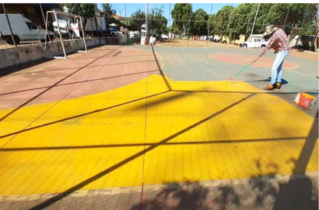
Reforma da quadra é uma antiga reivindicação dos moradores da Cohab Antonio Brandini