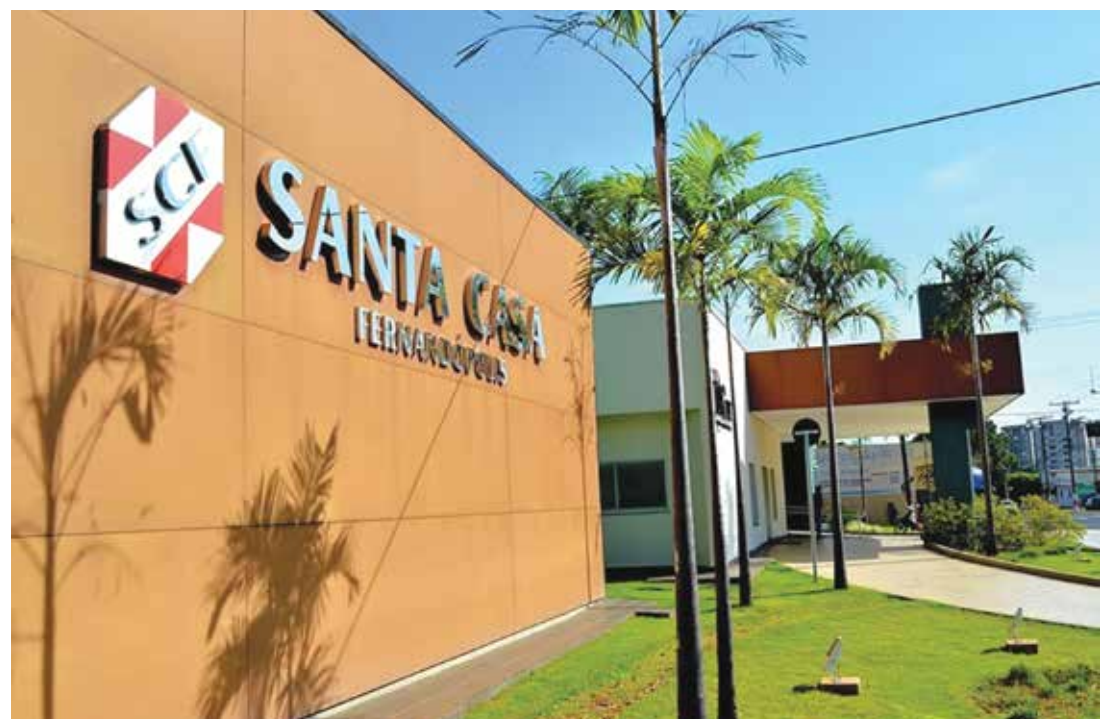
O Ministério Público está acompanhando a falta de medicamentos sedativos e relaxantes musculares em hospitais da região

No domingo, 21, eram 211 internados com síndrome respiratória aguda grave (SRAG), sendo 126 em enfermaria e 85 em UTI. Desses, 90 já tinham Covid-19 confirmada. "A doença está fugindo de tudo que a gente viveu. Já