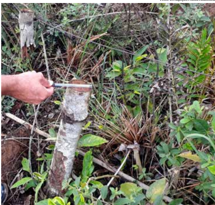
No local foram constatados corte de árvores de preservação permanente, uma barragem e desvios irregulares de água do córrego

Pelo local foi constatado o corte de 13 árvores, sendo 5 embaúbas, 8 árvores situadas em área considerada de Preservação Permanente, bem como verificaram também uma pequena barragem no citado córrego, realizado através da utilização de lascas arbóreas, diminuindo o fluxo de água