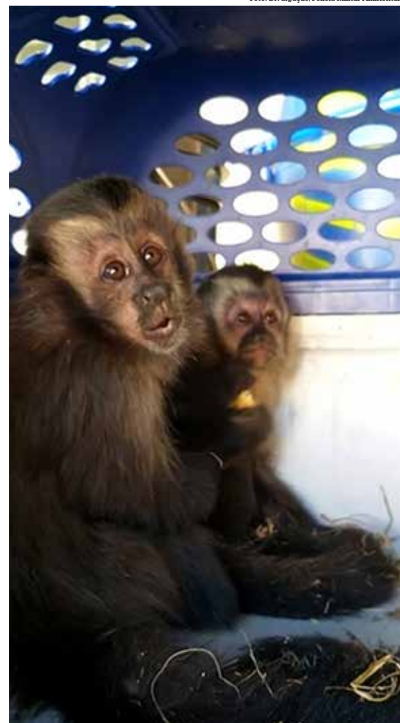
Macacos foram encontrados dentro de porta-luvas em Catanduva