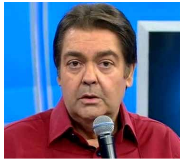
Fausto Silva não apresenta programa inédito neste domingo na Globo