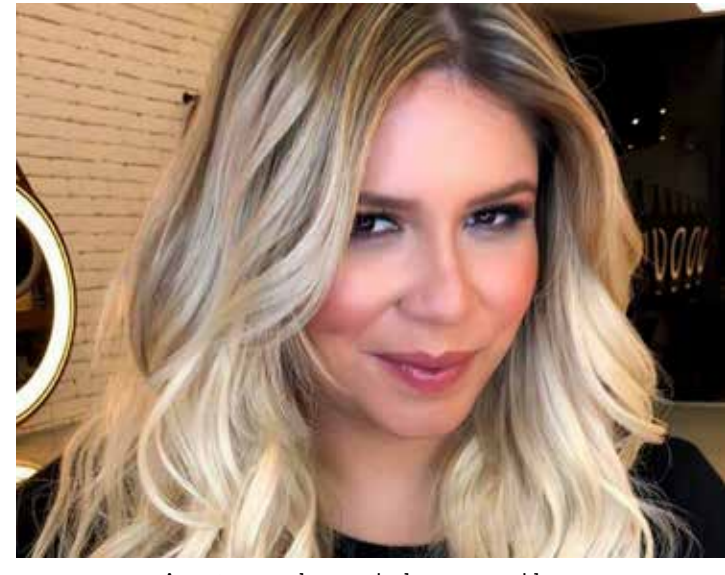
A cantora recebeu apoio de seus seguidores

F5 que foi diagnosticada com TDAH. O cantor e ator Fiuk é outro artista que tem o transtorno e revelou o problema durante sua participação no BBB 21 .