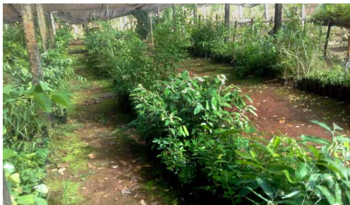
AES Tietê fez a doação de 5 mil mudas de espécies nativas para o Viveiro Municipal de Ouroeste