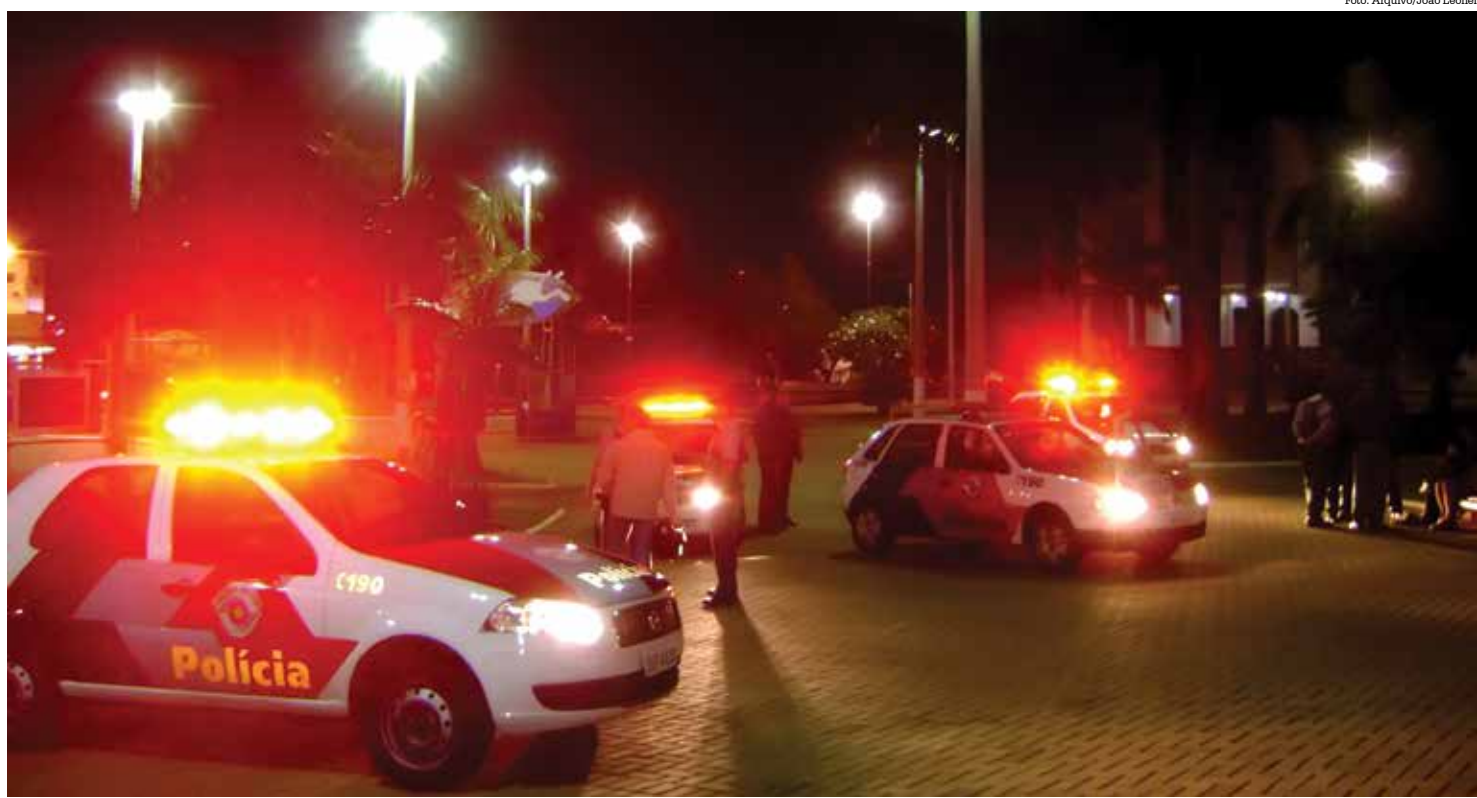
O combate a aglomerações geradas em festas, confraternizações e os tradicionais churrascos, que estão proibidos por decreto municipal, contará com ações conjuntas entre Polícias Militar e Civil, que acompanharão fiscais da prefeitura: aumento de autuações e multas é dado como certo

É o Decreto nº 8.917, que traz em seu artigo 12: "Fica proibida a realização de aulas presenciais em estabelecimentos e instituições de ensino e educação, da rede pública municipal, estadual, privada, inclusive curso pré-vestibular, bem como em estabelecimentos e instituições de ensino superior".