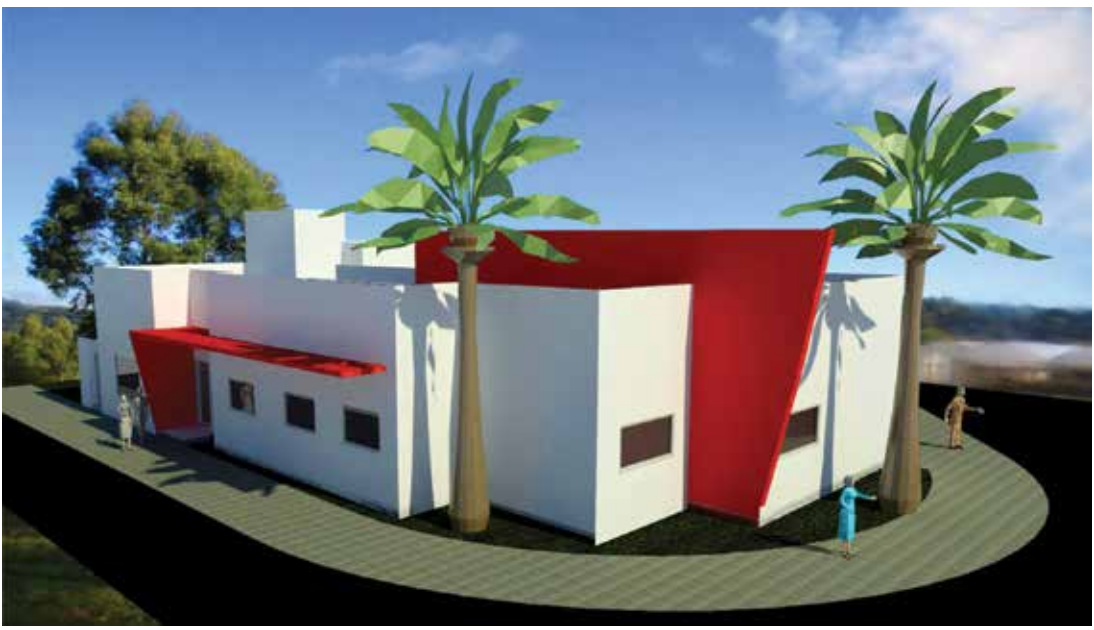
A nova sede, que sempre foi uma meta da entidade, já está projetada e será construída no Residencial Mathias

Um sonho antigo que está se tornando uma realidade. A AVCC – Associação dos Voluntários no Combate ao Câncer – de Fernandópolis começou no segundo semestre de 2020 a mobilizar recursos para a construção de uma sede própria. Para tanto, tem contado com a parceria de voluntários e, principalmente, a participação de empresários da região que juntos, têm destinados recursos humano, material e financeiro para a conclusão do projeto.