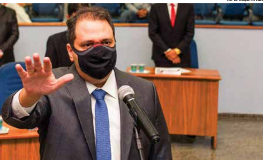
O prefeito Luis Henrique Moreira, durante o cerimonial de posse: projeto polêmico