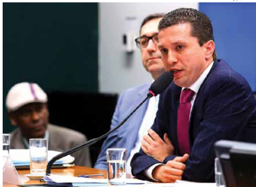
O deputado Fausto Pinato durante audiência na Câmara Federal