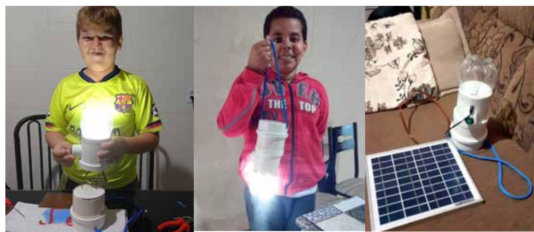
O projeto foi desenvolvido pelo Litro de Luz e visa levar energia para locais de difícil acesso