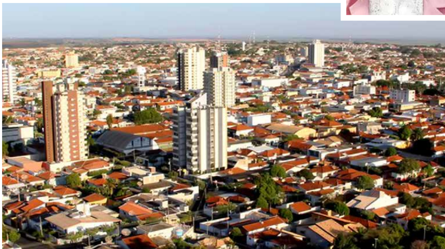
No detalhe, Sueno Sato: a primeira vítima fatal de Covid-19 em Fernandópolis

Em um ano, 244 pessoas morreram no município vítimas da doença; apenas nos 11 primeiros dias de junho já são 16 mortes