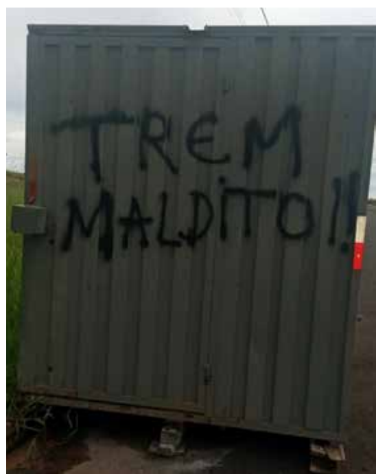
Pichações: o som da buzina tem incomodado também os moradores da zona sul de Fernandópolis