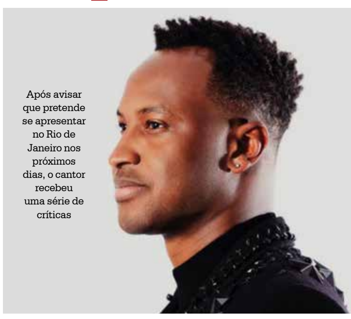
Após avisar que pretende se apresentar no Rio de Janeiro nos próximos dias, o cantor recebeu uma série de críticas

de de lotação da casa reduzida e ingressos limitados. Além disso, todos os rigorosos protocolos de segurança serão respeitados! Já ansioso pro nosso reencontro, Rio!", disse Thiaguinho. Centenas de opiniões contrárias foram deixadas nos comentários da publicação do cantor: "Show? Como assim? Amo Thiaguinho, mas já vai ter show?", "Porra, Thiago. 500mil mortes, meu parceiro. Segura a onda e ajuda a derrubar o presidente antes". "É serio isso? Amo seu trabalho, mas fico triste com esses shows". "Poxa, Thiaguinho, ainda não é o momento! Olha a situação do país. A maior recomendação segue sendo isolamento quando possível. Show tá longe de ser essencial, diante do quadro", considerou uma internauta. Diante da repercussão ne-