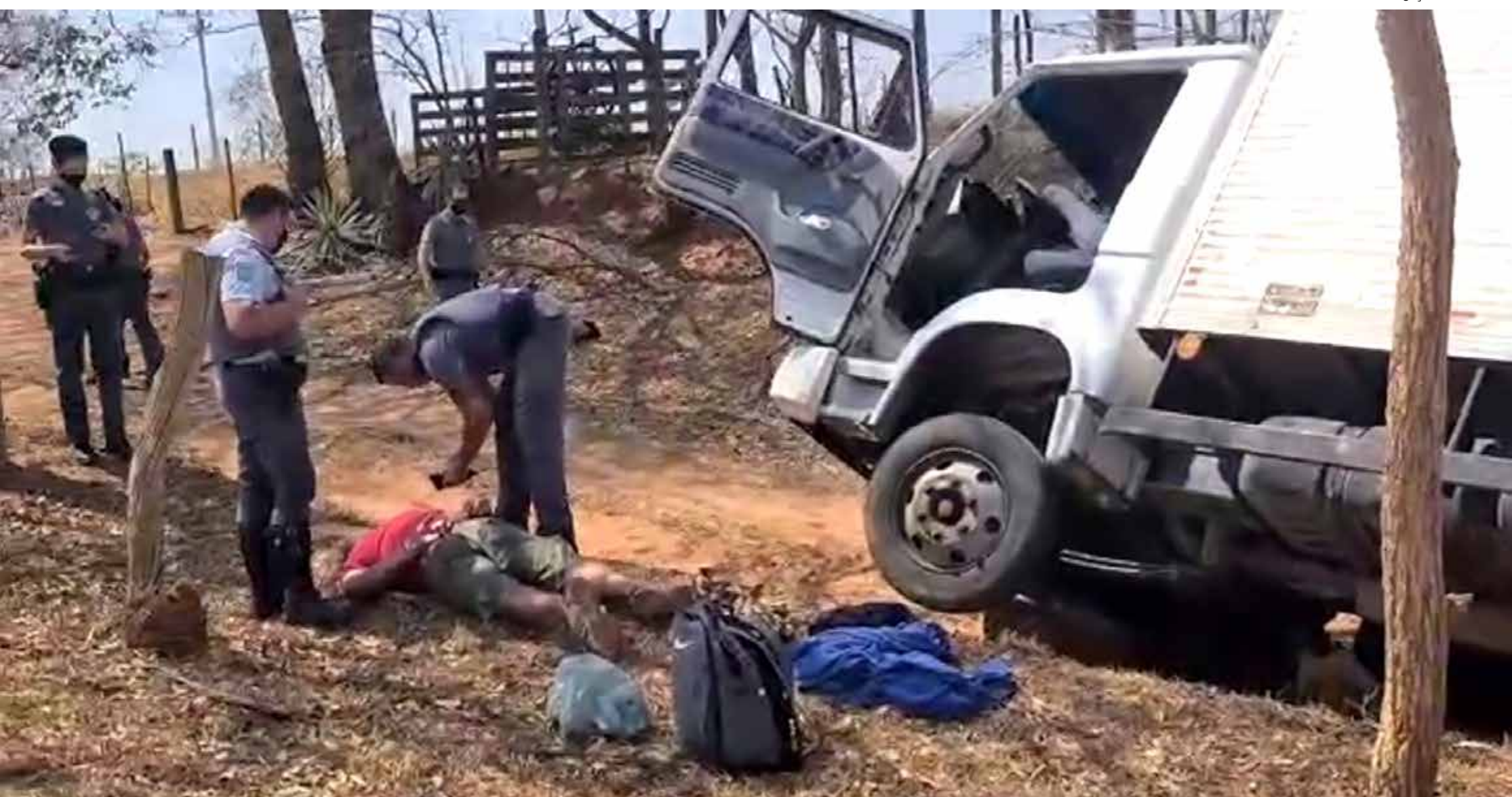
Criminosos foram presos após cerco policial

Três ladrões de carga foram presos pelas polícias Rodoviária e Militar de Jales. A prisão aconteceu após uma denúncia feita pela empresa de monitoramento contratada pela transportadora de um caminhão de defensivos agrícolas que havia sido roubado pelo grupo. O caminhão, que transportava uma carga avaliada em R$ 1 milhão, foi localizado na rodovia Jarbas de Moraes, porém, o motorista ignorou a ordem de parada dos policiais e iniciou uma fuga. A polícia conseguiu parar o caminhão em um cerco realizado por diversas viaturas em uma estrada rural próxima a rodovia Elyeser Montenegro Magalhães. Dois homens estavam na cabine do caminhão, enquanto um terceiro estava no baú junto com a carga. Após o assalto dar errado, o refém foi abandonado no km 140 da rodovia Elyeser Montenegro Magalhães.