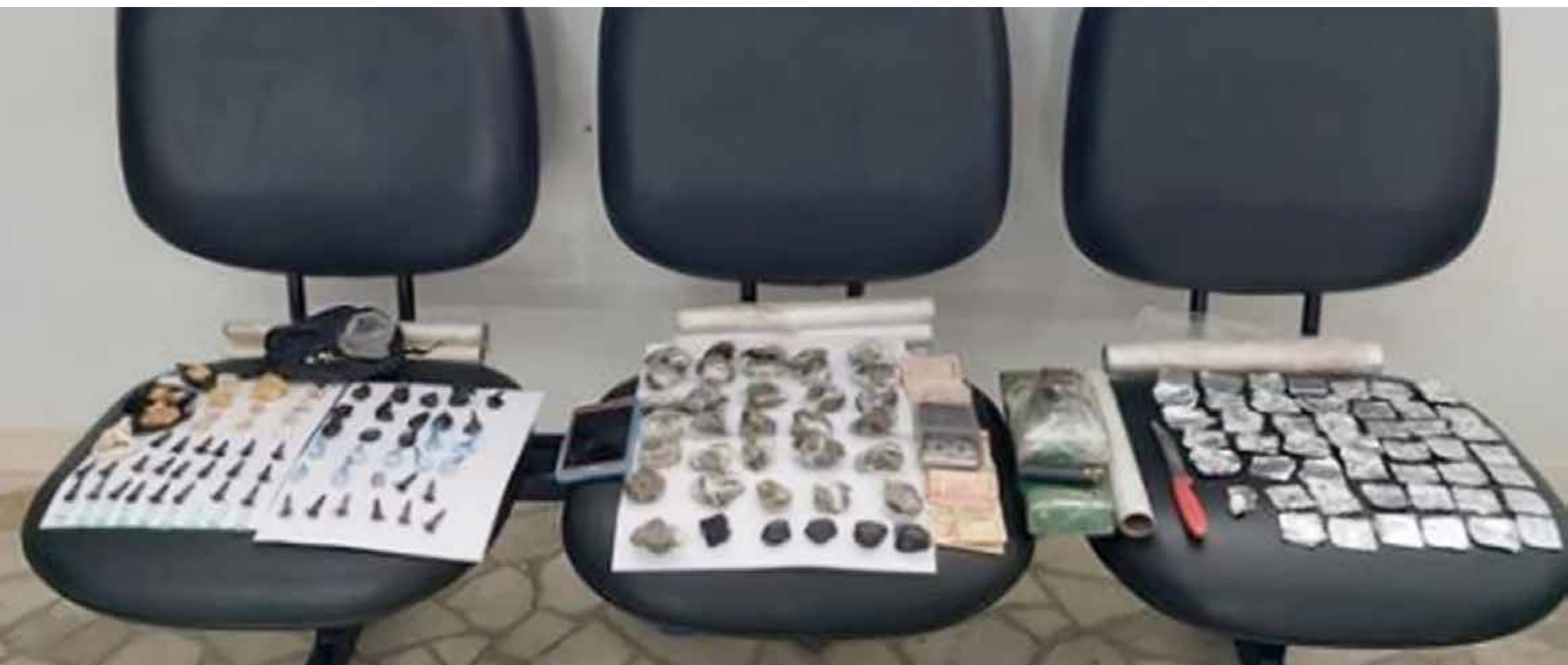
Drogas apreendidas durante a operação

Além da droga sintética, também foram apreendidas porções de maconha e cocaína