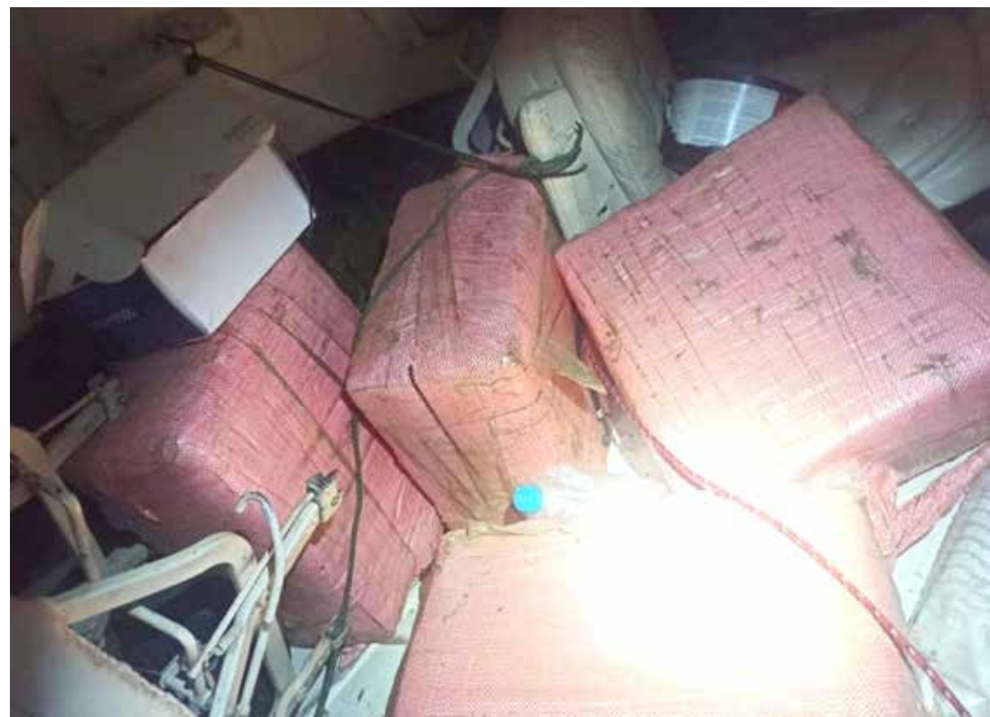
Aeronave transportava aproximadamente 300 kg de cocaína