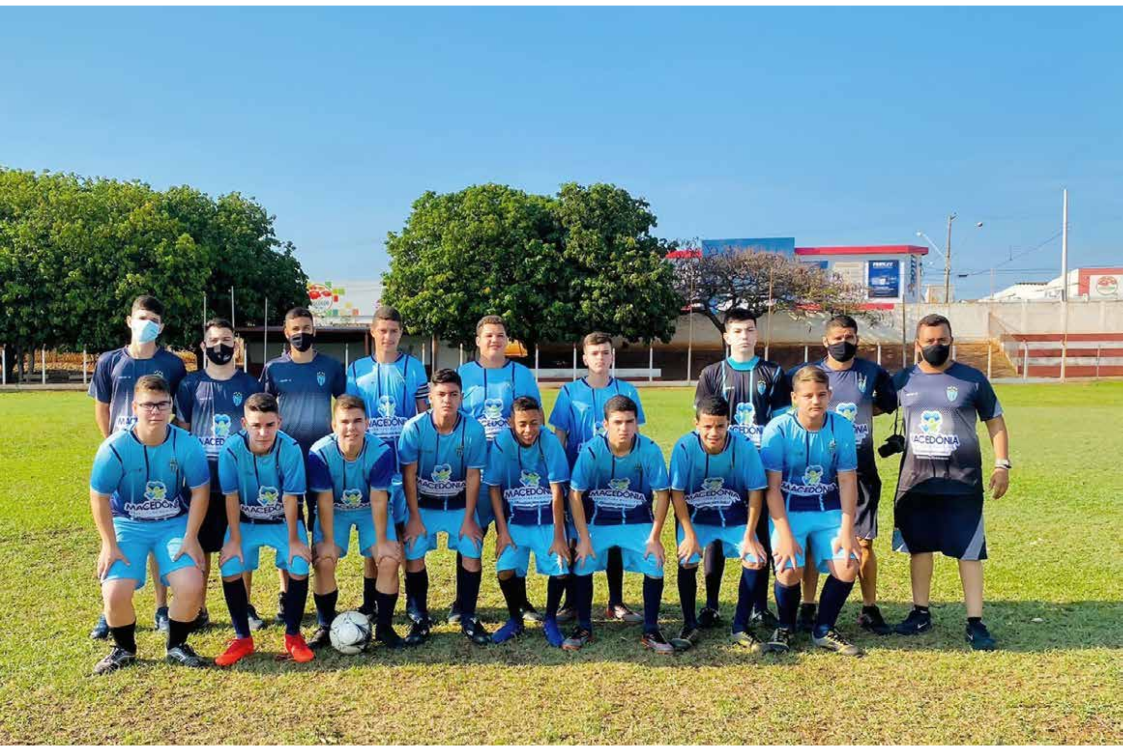
O próximo jogo está marcado para o dia 10 de outubro em Mira Estrela, nas categorias Sub 13 e 15

O embate aconteceu no estádio da Brasilândia em Fernandópolis