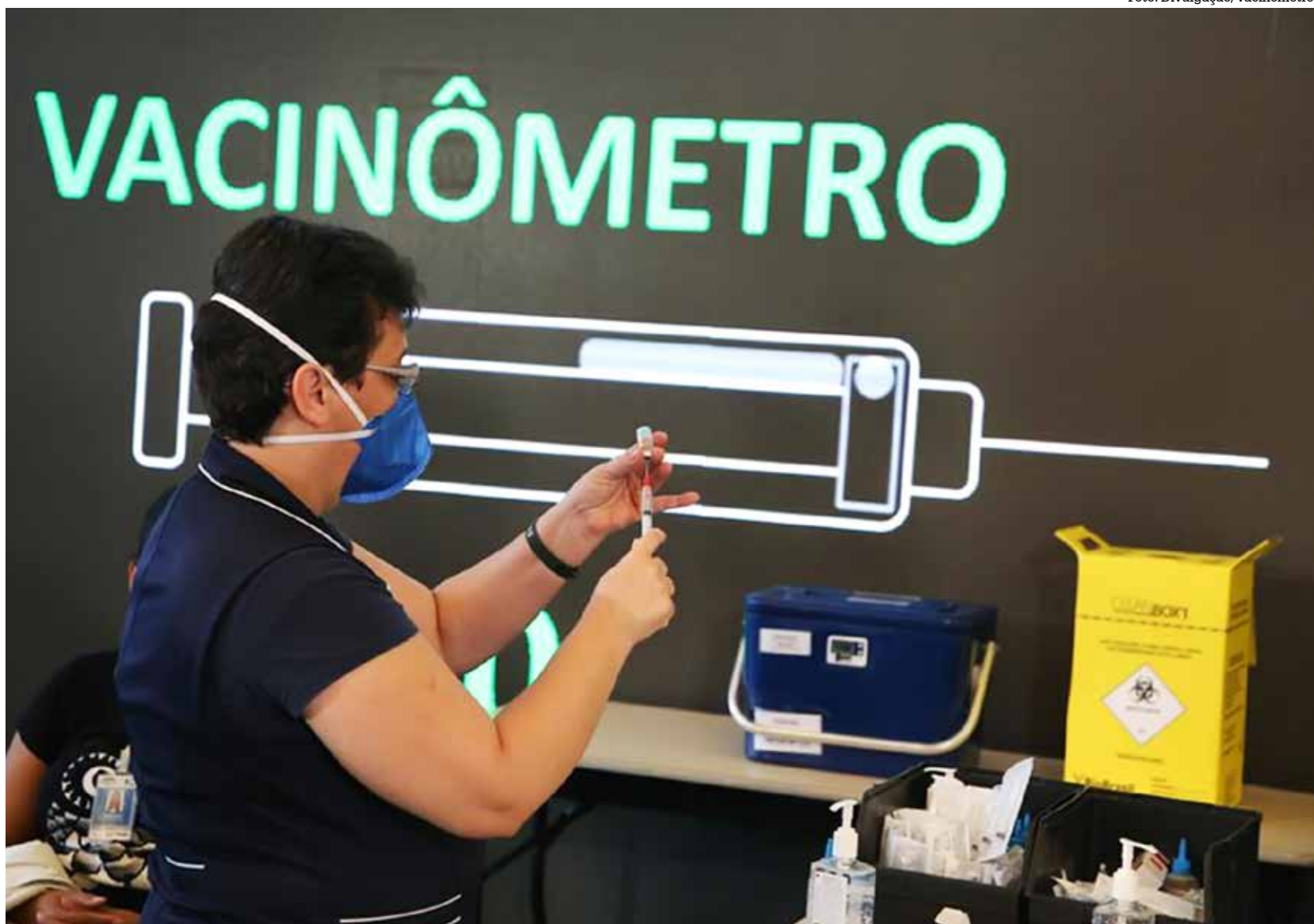
A reportagem confirmou junto à Secretaria Municipal da Saúde a chegada dos seguintes lotes de vacinas entre os dias 13 e 23 de setembro: 3.642 doses de Pfizer; 1.660 doses de CoronaVac; e 1.205 de AstraZeneca

Com ao menos uma dose, eram 60.209 moradores vacinados, o que correspondia a 86,7% da população. Com imunização completa (não computadas as doses de re-