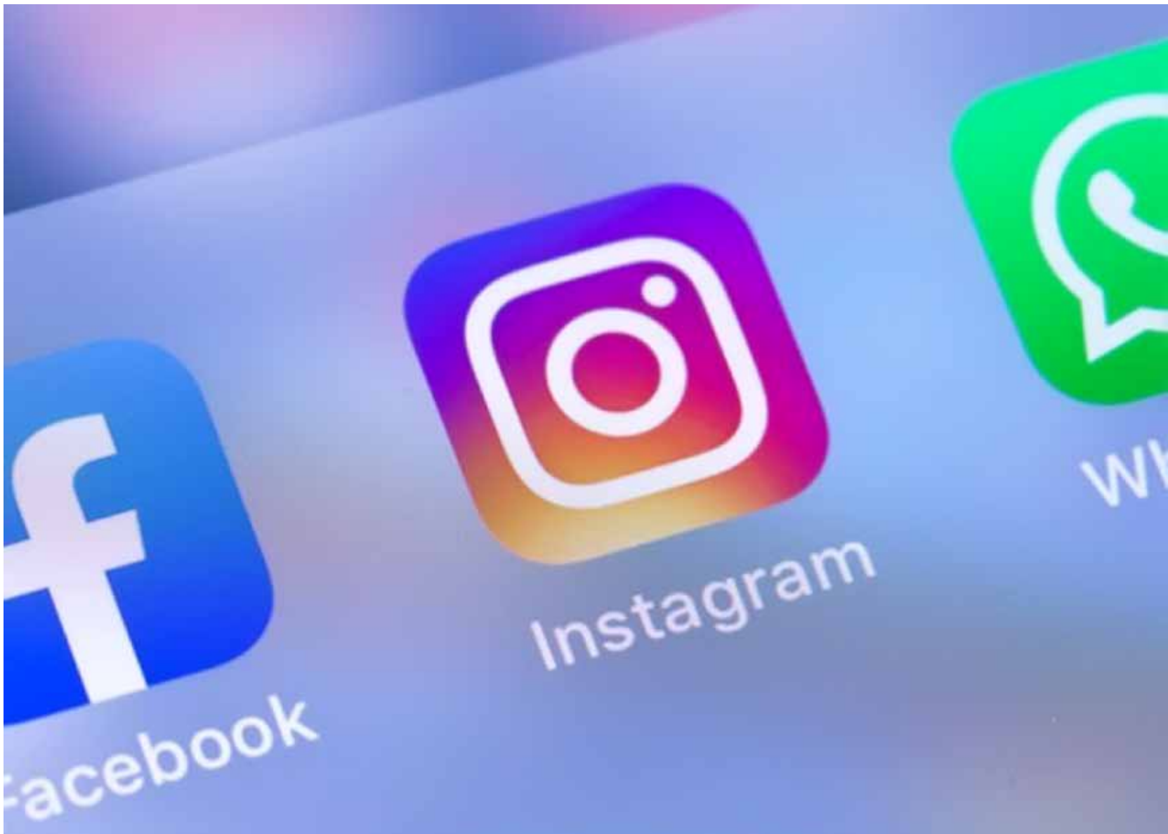
O relato geral era de inacessibilidade dos sites e o não carregamento dos aplicativos

Aplicativos estão fora do ar desde o começo da tarde desta segunda-feira