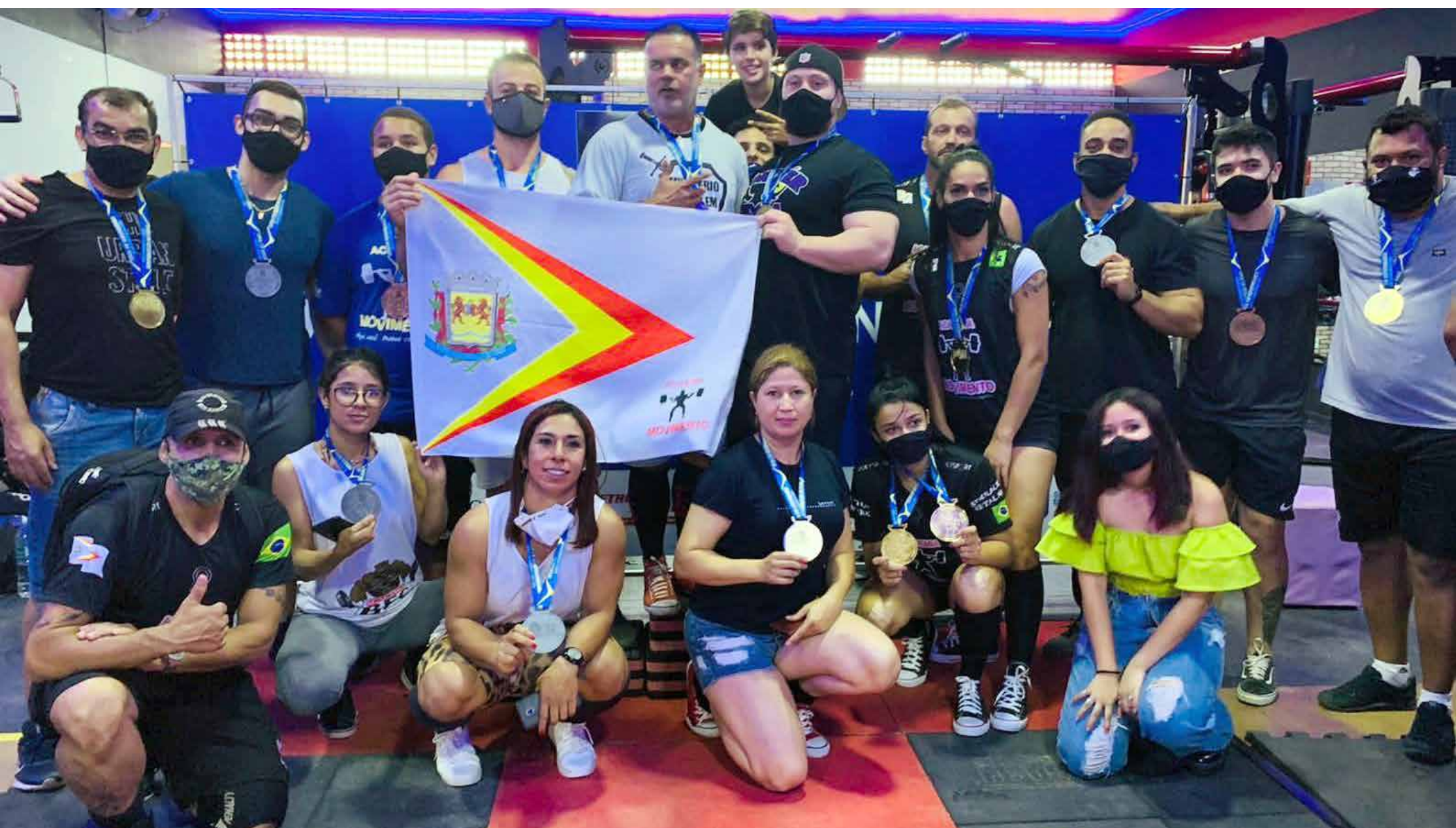
Atletas de Fernandópolis foram campeões por equipe

14 atletas conquistaram medalhas pela competição Open Powerlifter